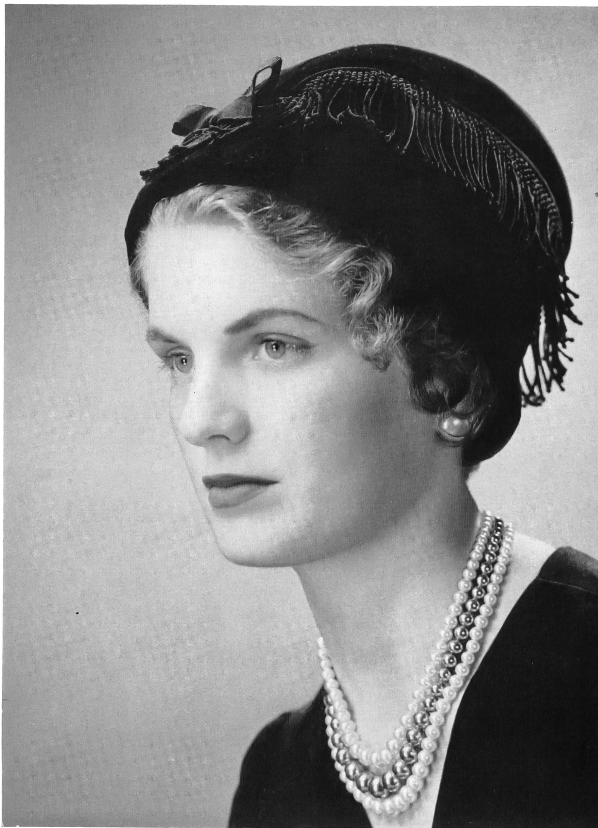
LANVIN CASTILLO Frange de guipure noire de Union S. A., Saint-Gall