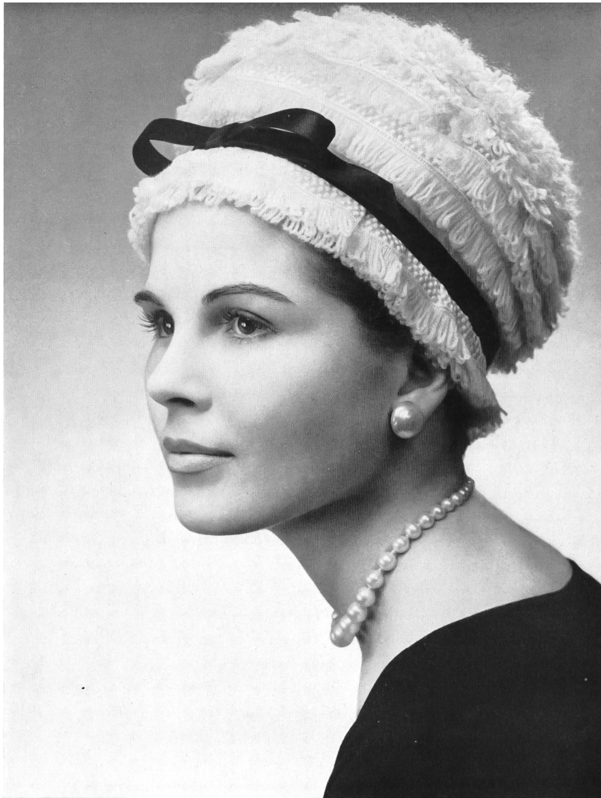
LANVIN CASTILLO Frange de laine brodée de Union S. A., Saint-Gall