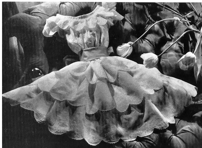
Créations « Nanouchka » en broderie de Saint-Gall pour la Cour de Monaco.