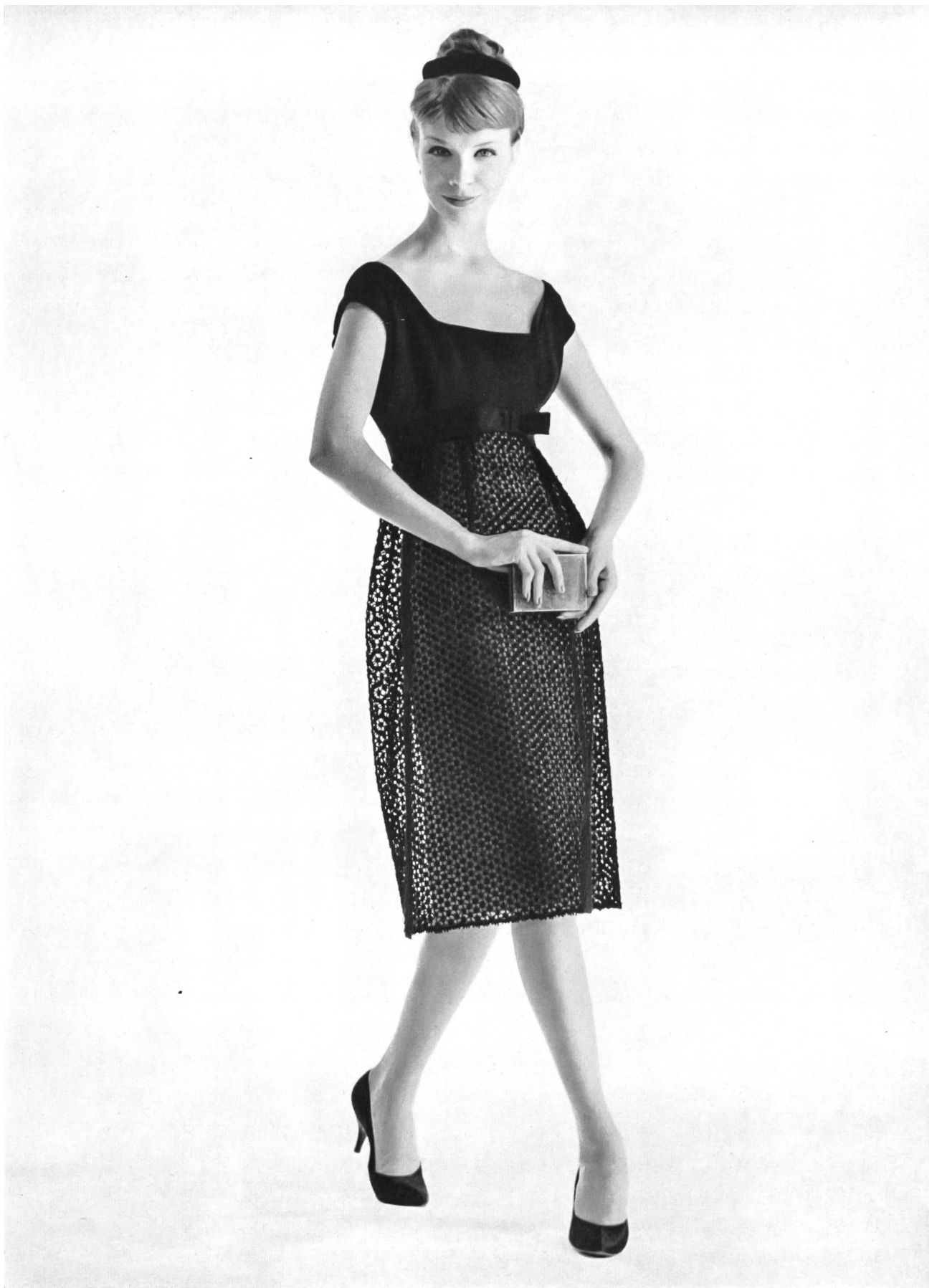
GUY LAROCHE Dentelle de laine de Forster Willi & Co., Saint-Gall Grossiste à Paris : Pierre Brivet S.à.r.l.

Modèles exclusifs – Reproduction interdite