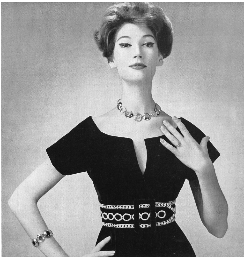
CHRISTIAN DIOR (Boutique) Galon en broderie or de Union S. A., Saint-Gall