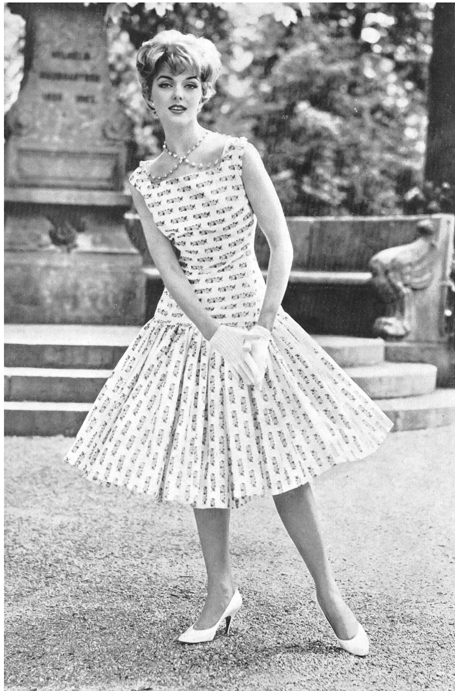
« FISBA », CHRISTIAN FISCHBACHER CO., SAINT-GALL

« Riviera Prints », coton imprimé / printed cotton fabric / tejido de algodón estampado / bedrucktes Baumwollgewebe. Modèle : Marty & Co., Zurich.