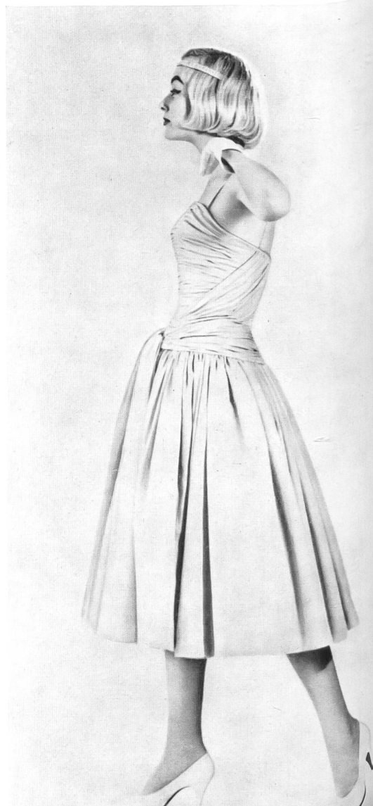
« FISBA », CHRISTIAN FISCHBACHER CO., SAINT-GALL

« Riviera Prints », coton imprimé / printed cotton fabric / tejido de algodón estampado / bedrucktes Baumwollgewebe. Modèle : Marty & Co., Zurich.