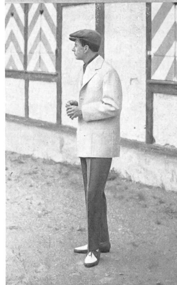
Modèles Ritex