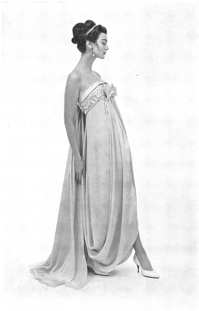
L. ABRAHAM & CIE, SOIERIES S.A., ZURICH Mousseline Rachelle Robe du soir de : / Evening gown by : Count Sarmi pour Elisabeth Arden, New-York

elegancia discreta y de buen gusto. Son artículos de clase sobresaliente y se comprende que las norteamericanas que confeccionan ellas mismas sus vestidos valiéndose de los excelentes patrones americanos, elijan como tela lo mejorcito que existe. Son mujeres que saben lo que se quieren y que palpan como peritas las creaciones importadas de Suiza sabiendo que conferirán aspecto de alta costura al vestido más sencillo, lo mismo si su hechura es la de camisa saco que la de camisero más clásico.