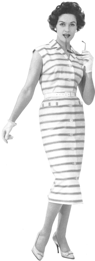
WINZELER, OTT & CIE S.A., WEINFELDEN Gabardine rayée en coton peigné mercerisé Gestreifte Gabardine aus mercerisierter gekämmter Baumwolle Modèle : Textilwerk Mann GmbH, Ludwigsburg