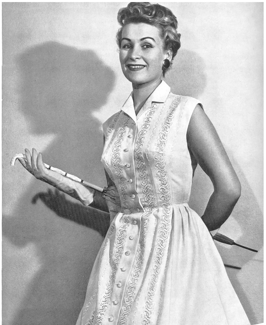
JACOB ROHNER S.A., REBSTEIN Broderie ton sur ton sur crêpe de coton blanc «Minicare» Ton auf Ton Stickerei auf weissem «Minicare» Baumwollcrepe Modèle : Thiele-Förster