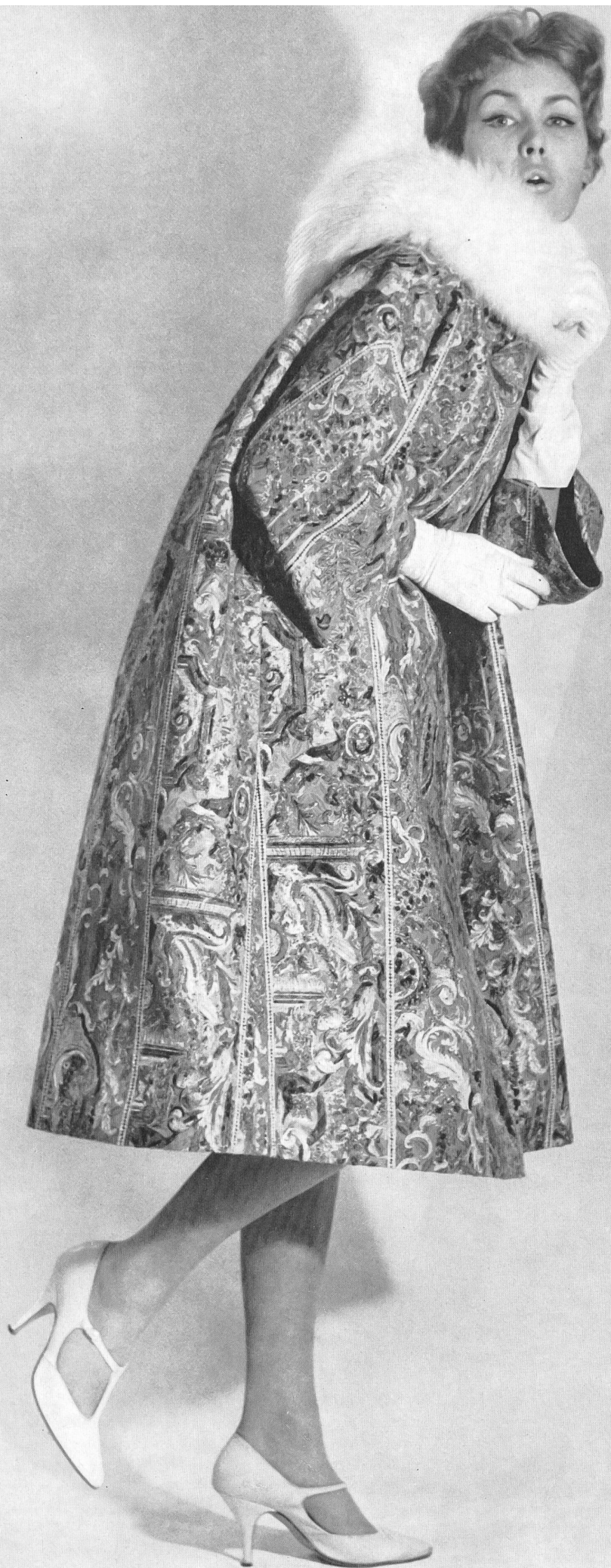
METTLER & CIE S.A., SAINT-GALL Brocart jacquard et or avec motifs Renaissance imprimés Gold-Brocade-Jacquard mit bedruckten Renaissance- Mustern Modèle : Heinz Oestergaard, Berlin