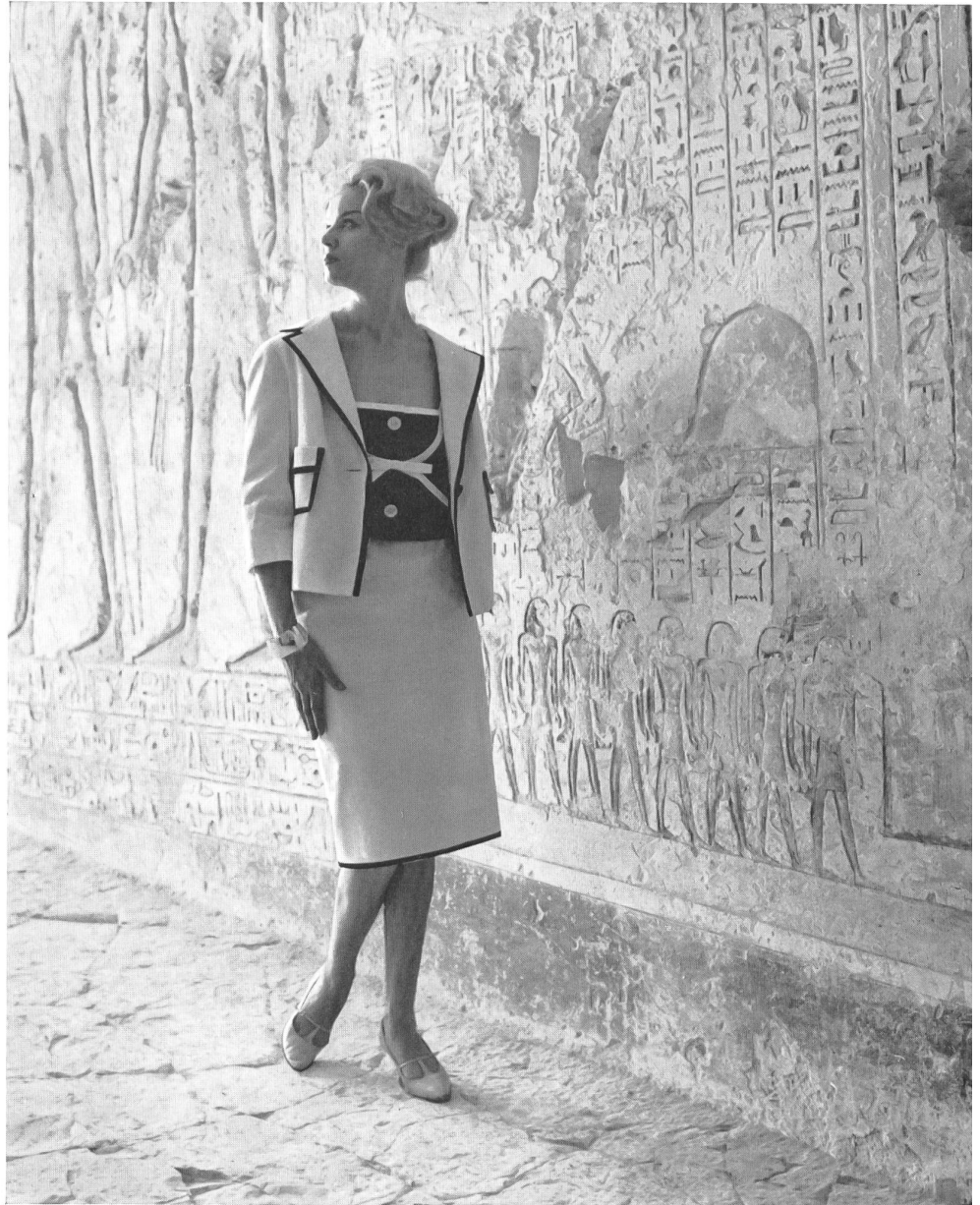
CHRISTIAN FISCHBACHER CO., SAINT-GALL Tissu de coton genre lin Baumwolle in Leinencharakter Modèle : Heinz Oestergaard, Berlin

Desgraciadamente, las presentaciones hubieron de verificarse durante el mes del Ramadán, cuaresma mahometana que prohíbe mostrar descubierta una parte cualquiera del cuerpo. Una comisión, presidida por una dama, severa funcionaria del gobierno, examinó atentamente los modelos que habían de ser presentados y, finalmente, concedió la autorización requerida por haberle parecido los bajos bastante discretos.