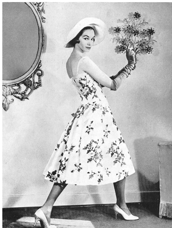
FORSTER WILLI & CO., SAINT-GALL Broderie de laine sur organdi de soie jaune Wollstickerei auf gelbem Seidenorgandy Robe de cocktail de : / Cocktailkleid von : Ritter-Modelle, Hambourg