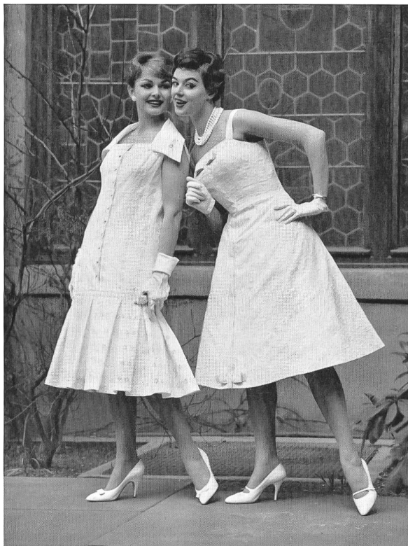
WALTER SCHRANK & CO., SAINT-GALL Batiste de lin brodée Leinenbatist mit Stickerei Modèle : Toni Schiesser, Francfort s.M.