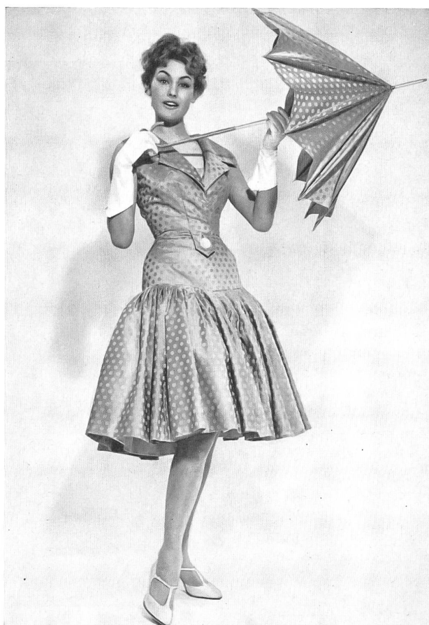
«RECO», REICHENBACH & CO., SAINT-GALL Satin de coton reversible Baumwollsatın, beidseitig verwendbar Modèle : Heinz Oestergaard, Berlin

El salón de Toni Schiesser atrae cada vez mayor número de clientes elegantes y ricos de la Alemania Occidental : mujeres de diplomáticos, de ministros y de grandes industriales, princesas y estrellas del cine que vienen comprando allí sus vestidos desde hace años ; una gran parte de la colección, muy juvenil y de un gusto muy parisiense, está confeccionada con tejidos suizos. Obtuvo un éxito muy notable con sus vestidos