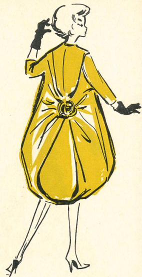
PIERRE CARDIN: manteau du soir en satin duchesse bleu turquoise; rose du même tissu.

Todas las colecciones están bajo el signo de la ilusión óptica, lo que, indudablemente, tiene su explicación. La generación actual de los modelistas es hija del surrealismo. Ha nacido después que éste y sus clásicos fueron las obras escritas, pintadas o talladas de esa escuela. Muy joven, estaba ya familiarizada con la Girafa en fuego de Salvador Dali ya fenecido, que vigila la mujer con los muslos erizados de cajones. Ha visto a la gente precipitarse hacia las tiendas de antigüedades en busca de objetos que no son lo que parecen. Y, encontrándose en una época en la que la actualidad y la preocupación por lo nuevo son unos imperativos devoradores, se vuelve hacia sus orígenes. Pero no es ésta la primera vez cuando la costura se evade de la simple noción de vestido para acceder a la fantasía. Lo que sí es nuevo es ahora la totalidad de esa evolución, mientras que ya cuando Poiret, algo antes de la guerra de 1914, escandalizaba y revolucionaba con sus atrevidos conceptos al mundillo de los modistas, aquello se debía ya al mismo impulso espiritual. A Paul Poiret le cupo en suerte el sino de los precursores y aquel fuego de artificio se apagó después del estampido de los últimos cohetes, pero las chispas tan sólo estaban aparentemente extinguidas. Bajo el acicate de la renovación solicitada mundialmente, y agujoneados por la confección de lujo