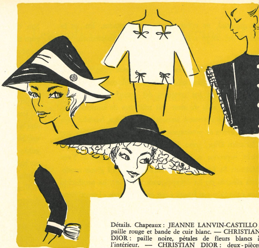
Détails. Chapeaux : JEANNE LANVIN-CASTILLO : paille rouge et bande de cuir blanc. — CHRISTIAN DIOR : paille noire, pétales de fleurs blancs à l'intérieur. — CHRISTIAN DIOR : deux-pièces avec quatre petits nœuds. — JEANNE LANVIN-CASTILLO : manche double avec tuyauté. — CHANEL : pompon de laine blanche et noire sur jersey noir.

Basta recordar los principios de Jacques Fath cuando cogía un jersey con cuello enrollado, lo cubría de lentejuelas y hacía de él un vestido de gala. Pues se trata del mismo sistema. Crear una cosa que no es lo que debería ser. Hacer una especie de modelo que se salga del cuadro clásico y que su forma,