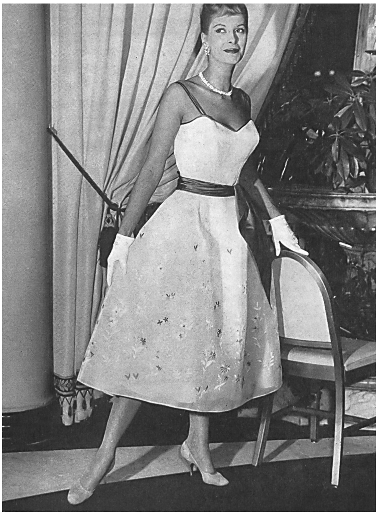
Embroidered white organdy with permanent finish. Model by Doge Separates, New York

de agujerearla como lo hace el encaje calado y llamado de punto inglés. El dibujo adquiere la mayor importancia, como también lo hace la elección de los colores. Tanto en el bordado como en el estampado, el dibujo avalorado por el color puede renovarse indefinidamente adaptándose progresivamente a las tendencias variables de la moda. El empleo de varios colores abre nuevos horizontes al bordado que, con ello, deja de tener motivo para estereotiparse en los modelos clásicos de bordados blancos procedentes de los años aquellos en los que la reina Victoria era joven y que han seguido repitiéndose con éxito hasta el día de hoy.