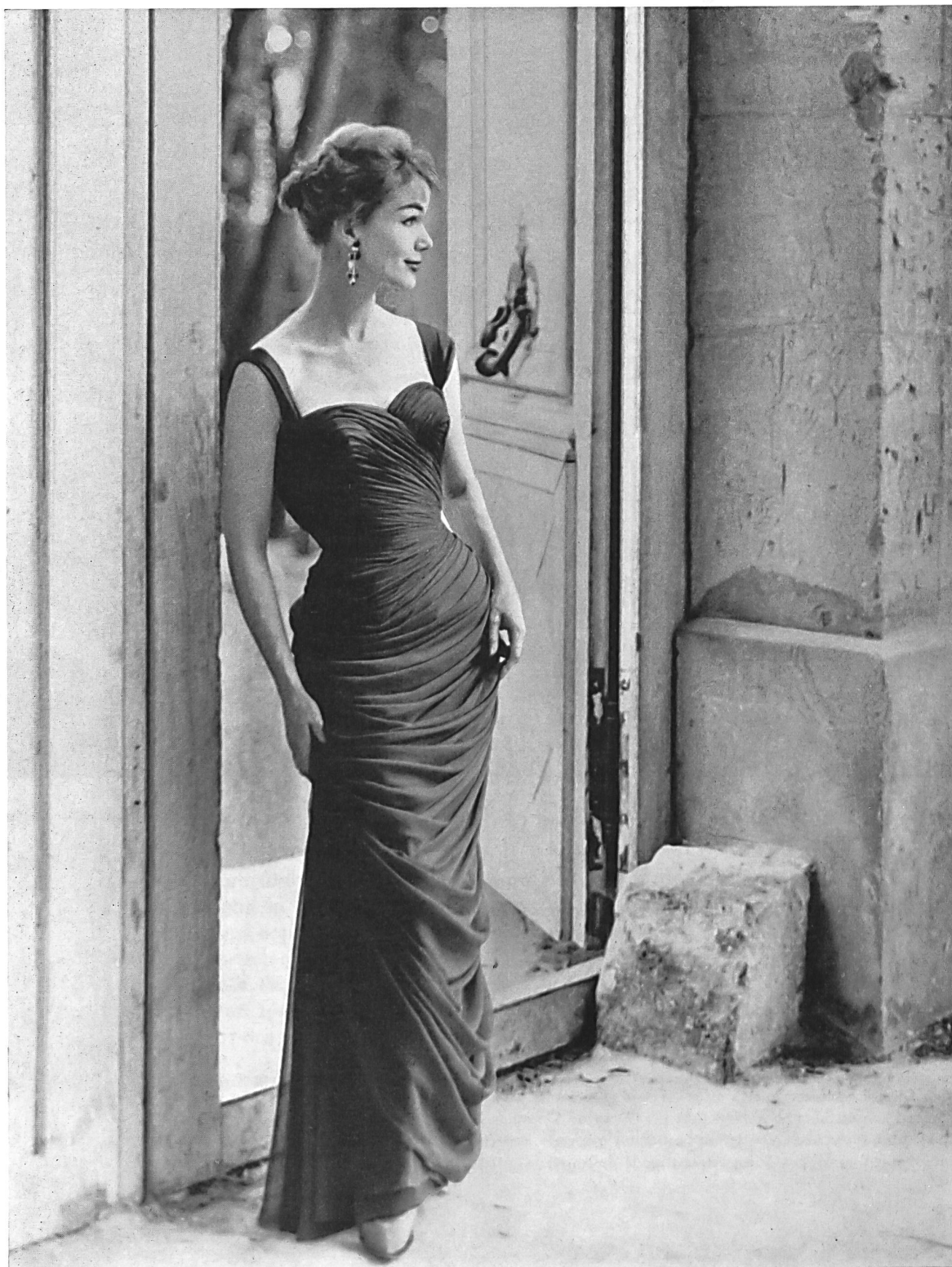
PIERRE BALMAIN Mousseline « Follette » de L. Abraham & Cie, Soieries S. A., Zurich