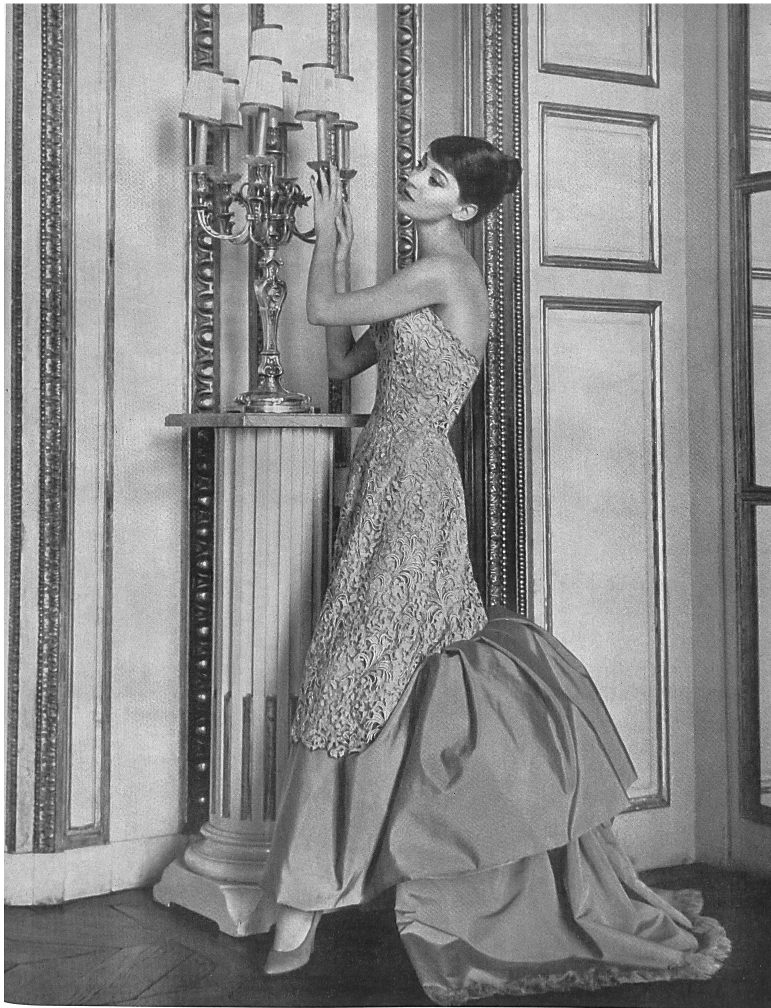
JEAN DESSES Guipure en lamé or de Forster Willi & Co., Saint-Gall Grossiste à Paris : Les Tisseurs B de M