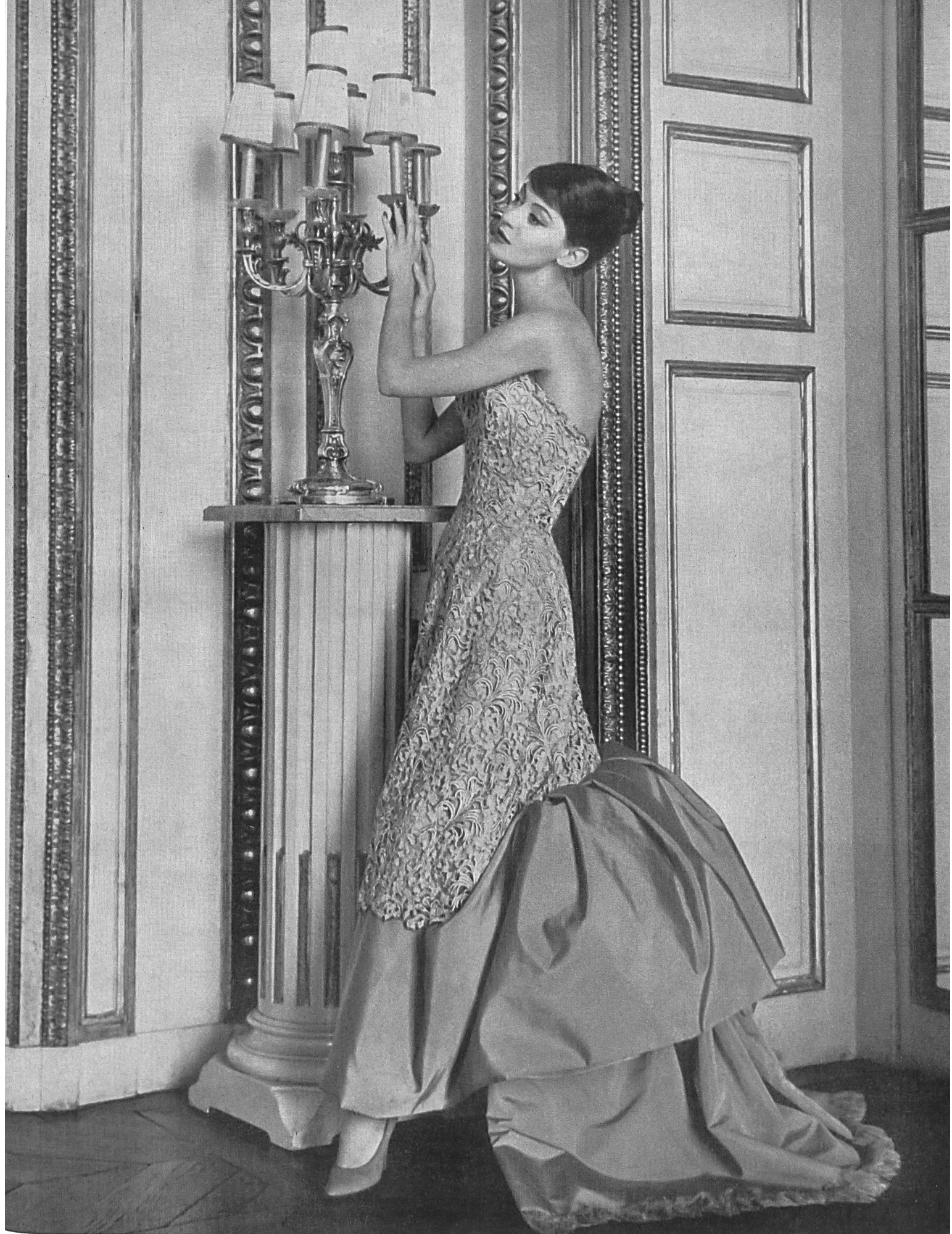
JEAN DESSES Guipure en lamé or de Forster Willi & Co., Saint-Gall Grossiste à Paris : Les Tisseurs B de M