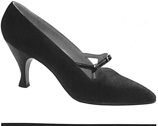
Algunos zapatos de la colección otoño/invierno 1957-58.