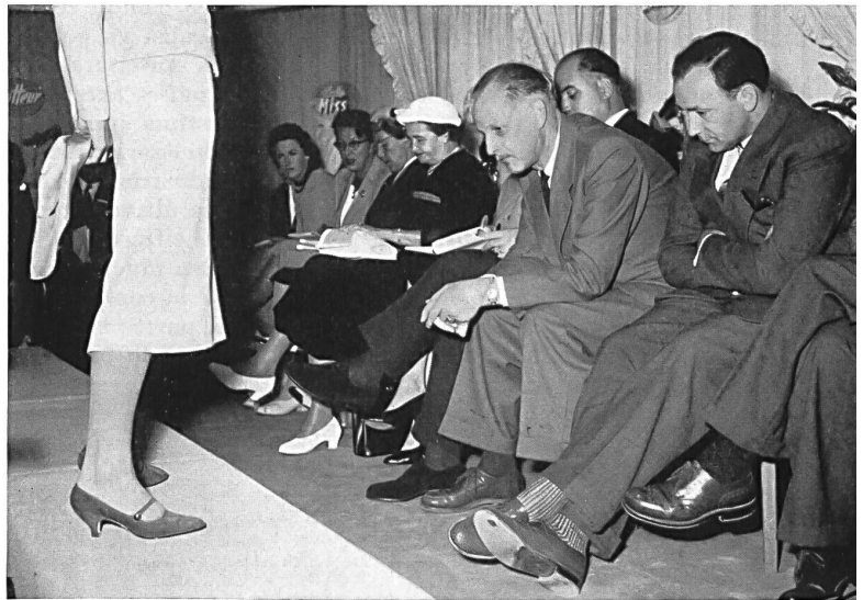
Presentación a la Prensa de la colección.