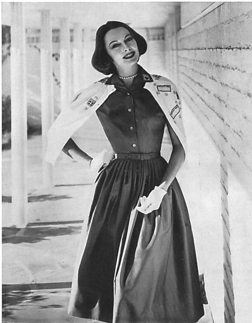
HAUSAMMANN TEXTILES LTD., WINTERTHUR Cotton broadcloth.

El vestido hechura blusa encaminó a Sir James hacia la fabricación de vestidos, y esta casa ha llegado a producir en la actualidad vestidos sumamente cómodos y elegantes en las clases de fantasía y deportiva. Ha abierto una nueva fábrica en lugar magnífico del Arizona, donde unas obreras muy hábiles trabajan en unos locales ultramodernos y con aire acondicionado; los sueldos que paga son muy elevados y la producción es de primera calidad. Este concepto industrial y el empleo de tejidos originales y atractivos le ha valido a la marca « Sir James » lo mismo que a tantas otras firmas californianas, un éxito muy grande en la clase de la confección a precios medios y en la cual la competencia es siempre muy viva. El señor Horowitz dice que los tejidos suizos que viene utilizando desde hace dos años, han desempeñado un papel principal en el desarrollo logrado y que seguirán desempeñándolo también en lo porvenir. Aprecia sobre