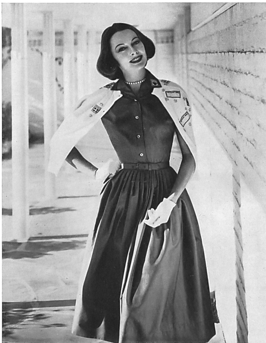
HAUSAMMANN TEXTILES LTD., WINTERTHUR Cotton broadcloth.