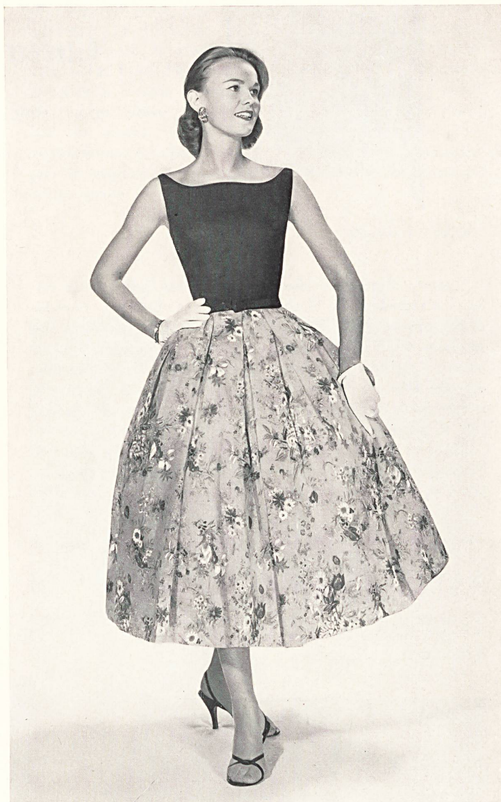
J. G. NEF & CO. S.A., HERISAU « Nelo flor » color printed creped organdy. Model by Marjorie Michael Inc., California.