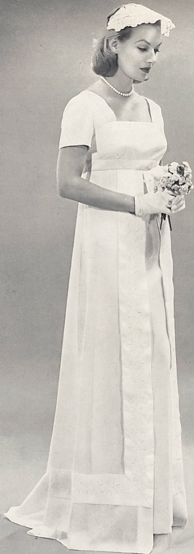
REICHENBACH & CO., SAINT-GALL Embroidered supervoile « Recolux ». Bridal dress by Cahill Ltd. of California.