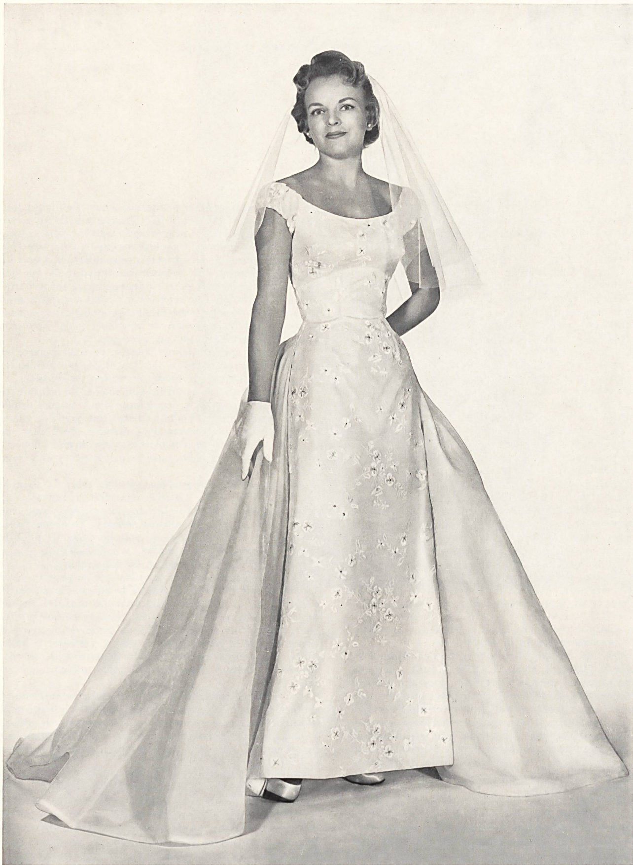
FORSTER WILLI & CO., SAINT-GALL Gold embroidered white silk organza. Wedding gown by Priscilla Bridals, Boston.