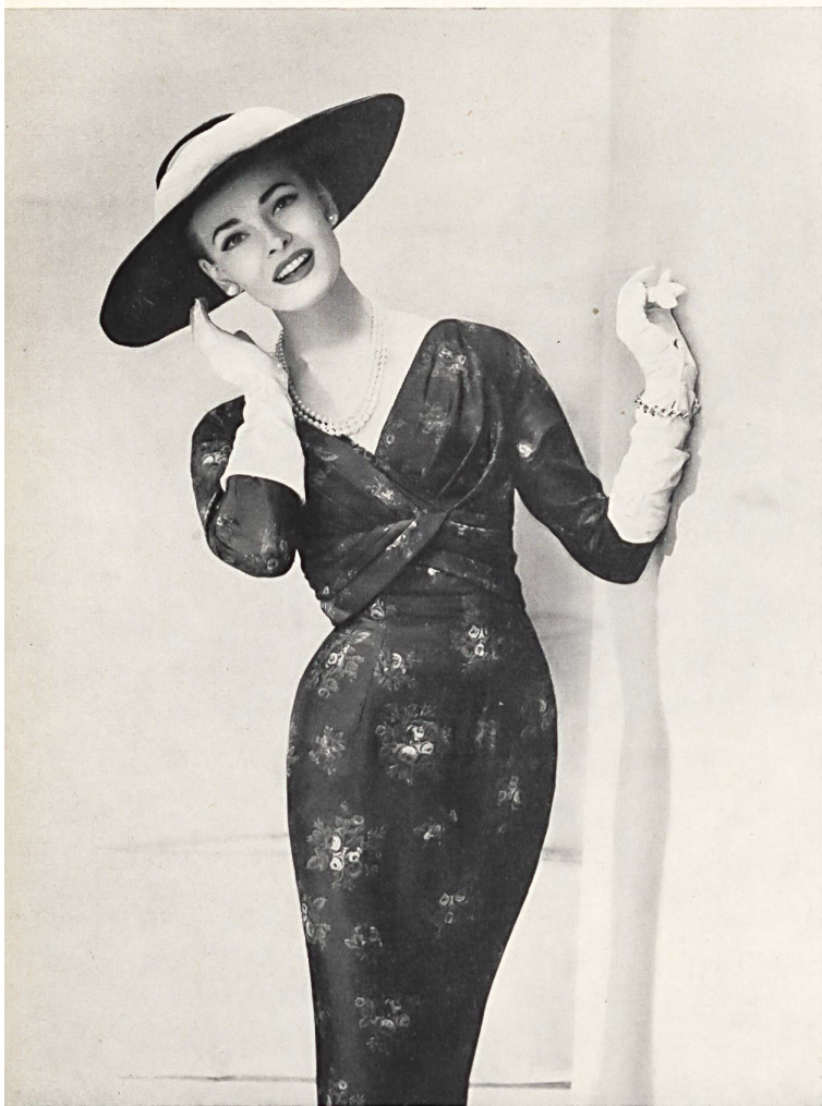
L. ABRAHAM & CO. SILKS LTD., ZURICH

Para contrastar con los algodones flexibles, casi todas las colecciones de ropa confeccionada contienen modelos de rayón o de tejidos de mezclas suaves y que requieren una línea más moderada, con bustos drapeados y talles ceñidos, a veces con « cummerbunds », y con graciosas faldas más rectas y con elegantes pliegues sin planchar. Una ventaja evidente de estos vestidos de líneas más