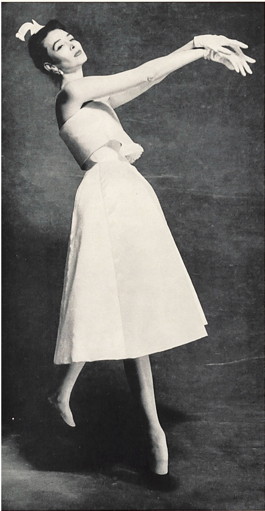
HUBERT DE GIVENCHY