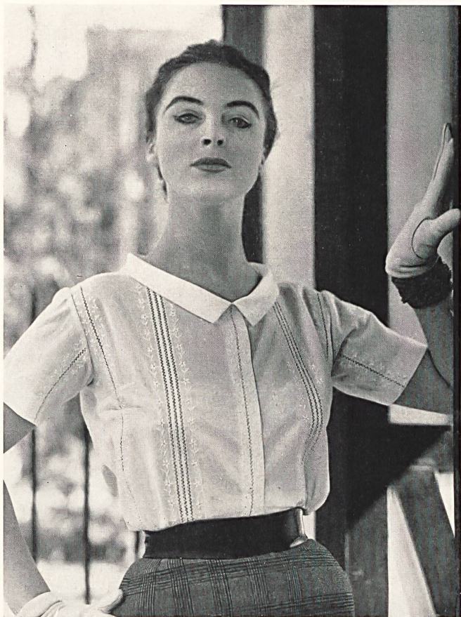
CHRISTIAN DIOR (Boutique) Printemps 1956 Batiste brodée blanche de Reichenbach & Cie, Saint-Gall Montex, Paris