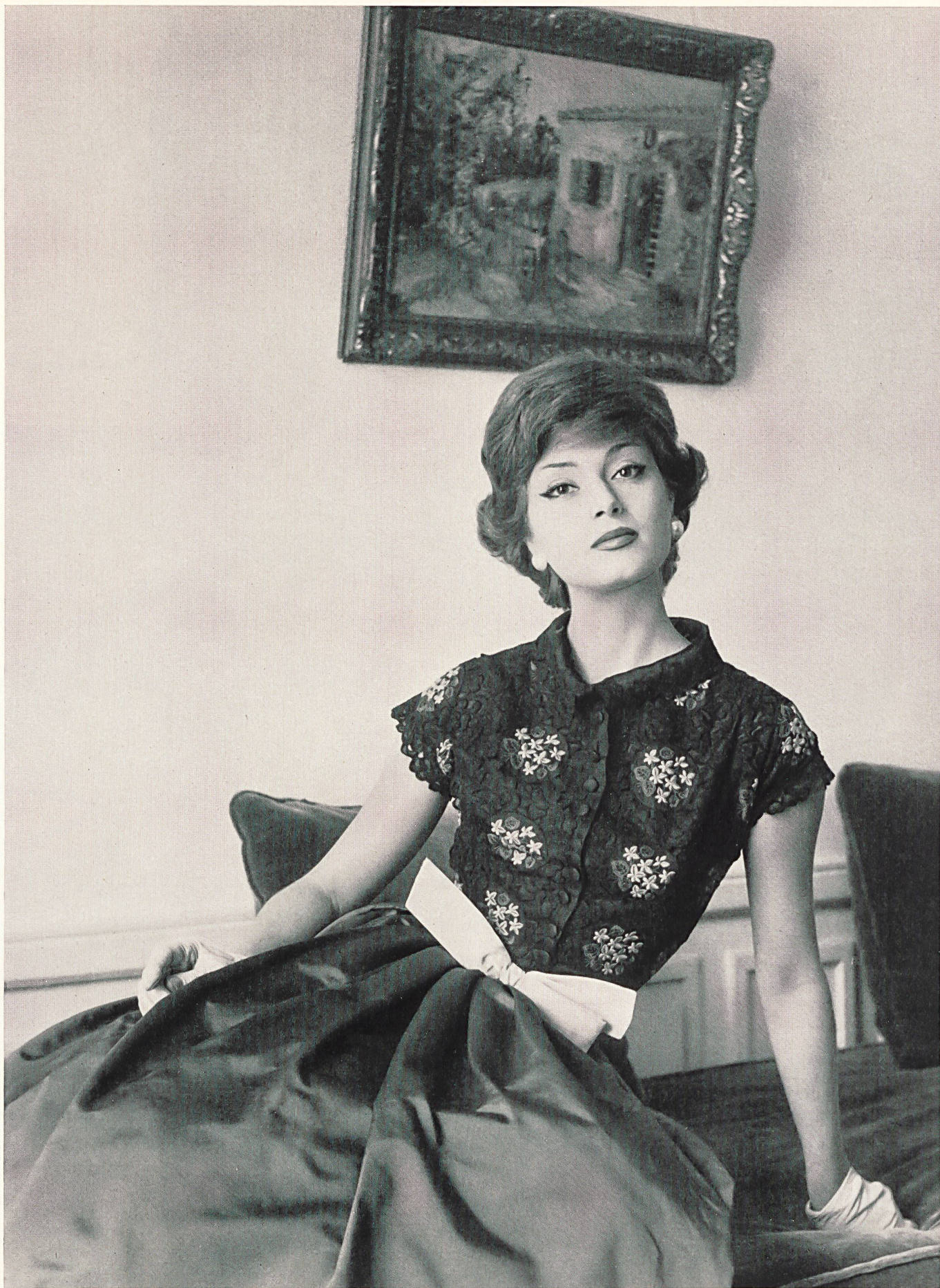
JEAN PATOU Broderies couleurs de A. Naef & Cie, Flawil Placé par Inamo, Zurich