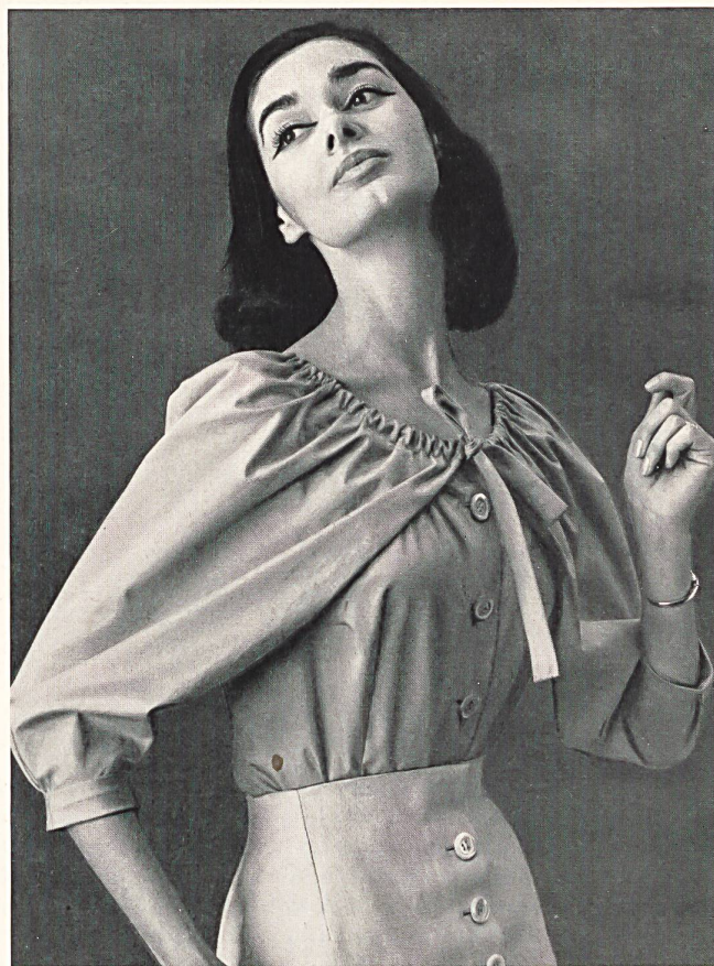
HUBERT DE GIVENCHY (Boutique) Printemps 1956