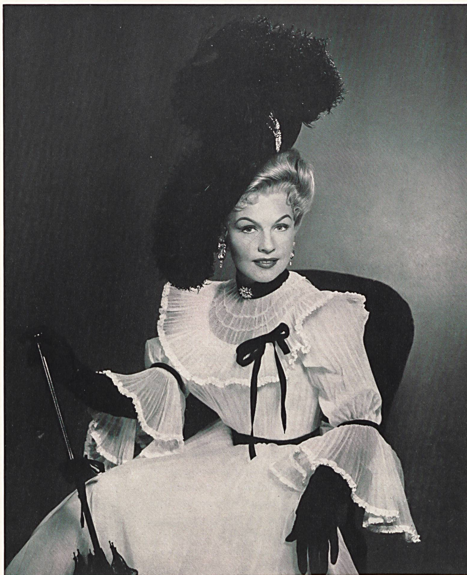
STOFFEL & Co., SAINT-GALL

A nuestros lectores les interesará saber que la creación de los trajes para la pantalla difiere esencialmente de la de los vestidos destinados a ser llevados en la vida real. A pesar de que las modas dibujadas para una película no dependen de una «época» determinada, deberán conformarse con las tendencias del momento en sus grandes líneas. Deberá evitarse, no obstante, toda exageración puesto que los espectadores no van al cine para ver un desfile de modas, sino una historia y las «estrellas» puestas de realce. Por consiguiente, los vestidos han de sentar bien pero sin llamar demasiado la atención, más bien que ser creaciones por sí mismas, y quien los dibuja debe estudiar atentamente el escenario para penetrarse bien de las intenciones del autor.