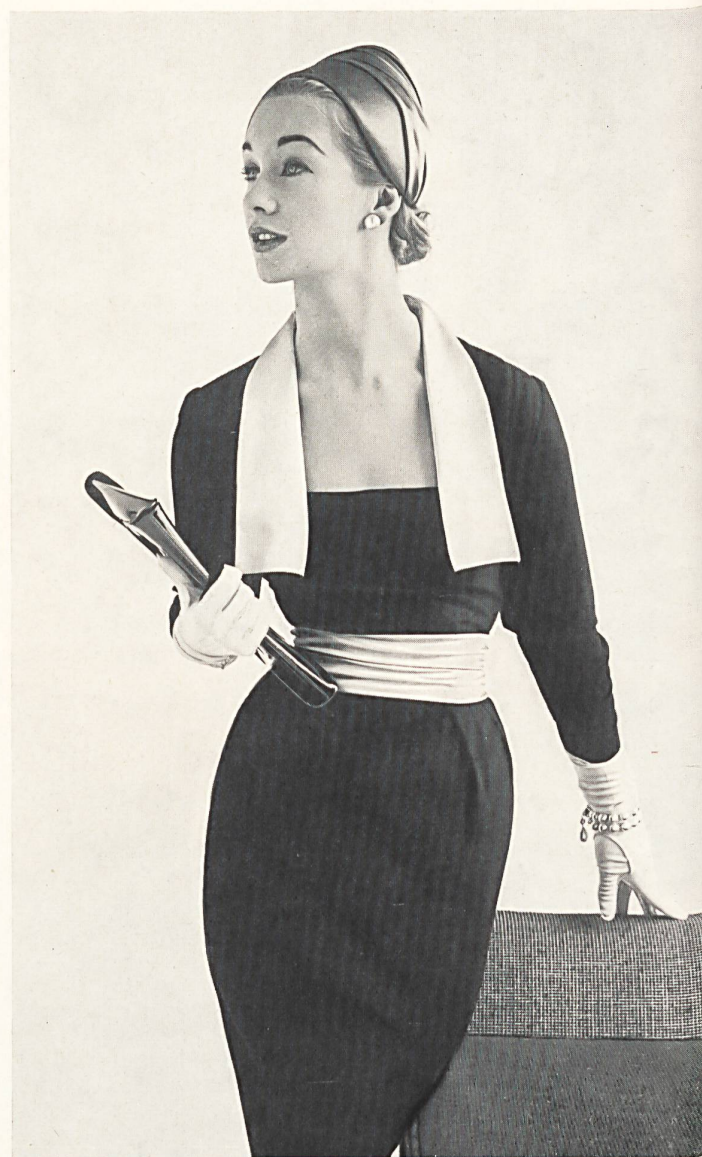
L. ABRAHAM & Co., SILKS Ltd., ZURICH

En los salones de uno de los principales importadores de vestidos confeccionados suizos he podido ver las colecciones de varios fabricantes muy conocidos y que se han especializado en los productos de calidad. Había un maravilloso dospiezas (Egeka), perfecto para las veladas de solaz en casa, constituido por un pantalón ahusado con un