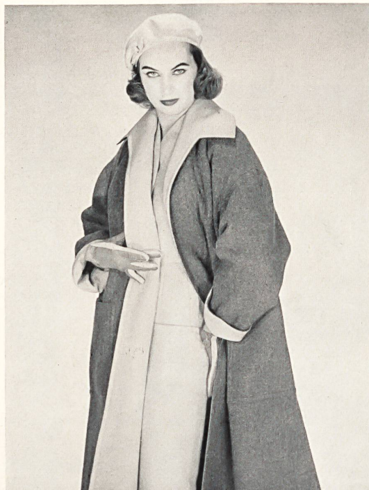
Traje sastre, de lana fantasía ; abrigo de viaje reversible tweed y gardina