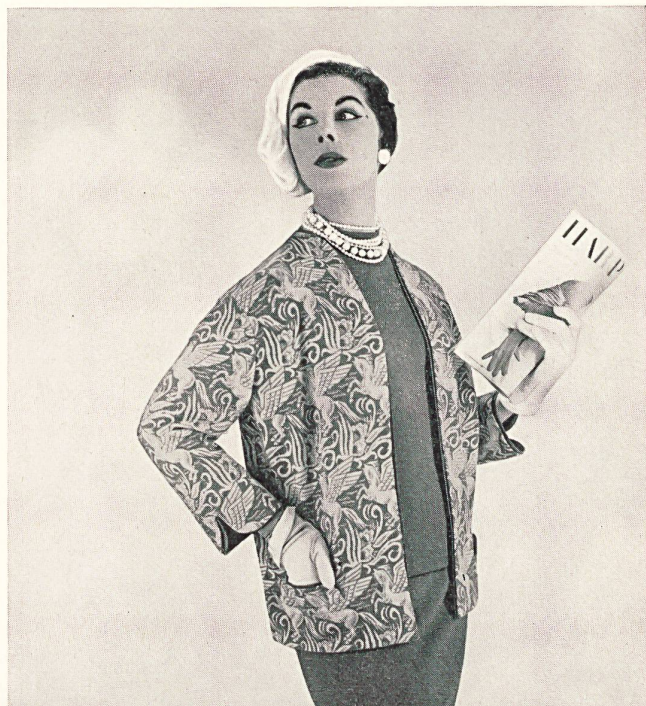
Conjunto de tres piezas, de punto wevenit-jacquard