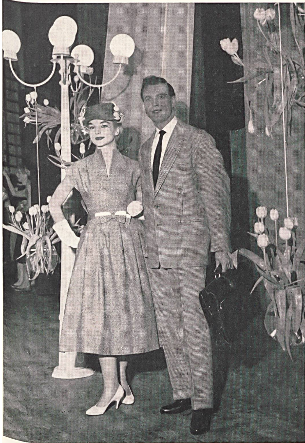
Complet pied de poule en laine d'agneau. Continental-Style. Houndstooth suit in lamb's wool. Continental-Style. Terno pie de gallo, de lana de cordero. Estilo « Continental ». Anzug mit Gänsefussmuster aus Lammwolle. Continental-Style.