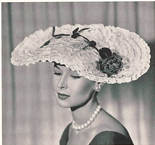
Swiss straw lace

El consejo principal que da Rex a las mujeres es el de ser, ante todo, naturales. Muchas entre sus más bellas clientes son mujeres de cabellos canos que lograron cultivar su encanto personal y que, por ser de bastante edad para conocerse bien, habían renunciado a luchar vanamente para llegar a ser distintas de como son y... más jóvenes.