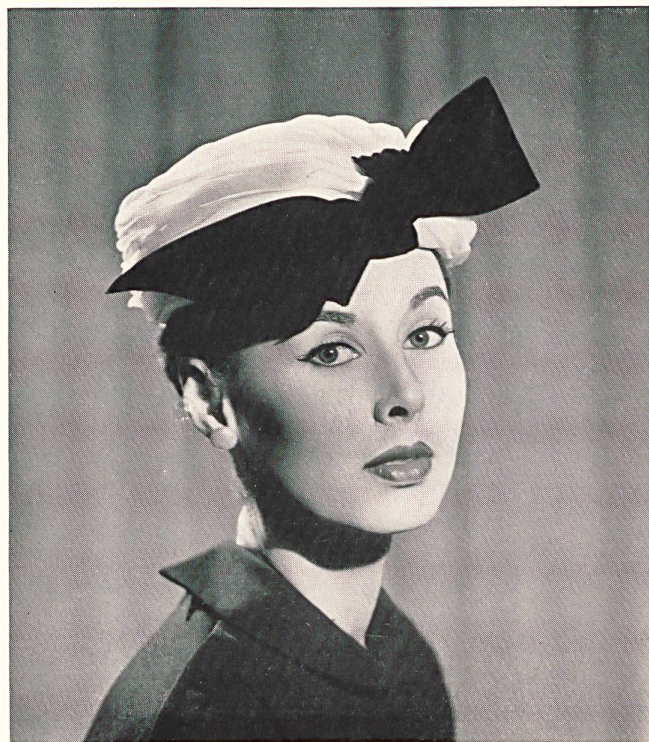
Swiss white organdy