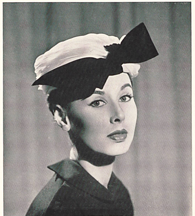
Swiss white organdy