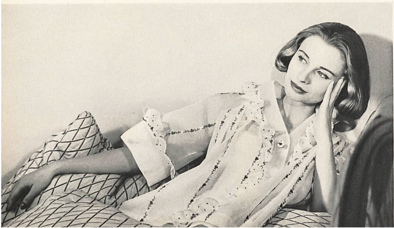
CHRISTIAN DIOR (Boutique) Organdi brodé couleurs de Forster Willi & Co., Saint-Gall