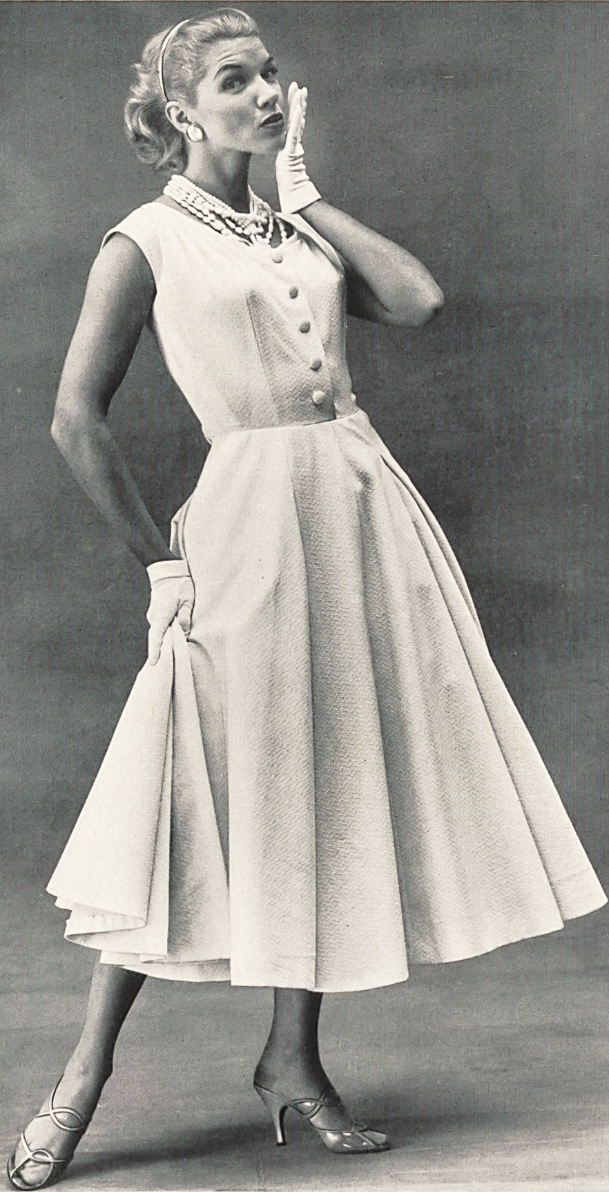
CHARLES MONTAIGNE Tissu piqué fantaisie de Reichenbach & Co., Saint-Gall Montex, Paris