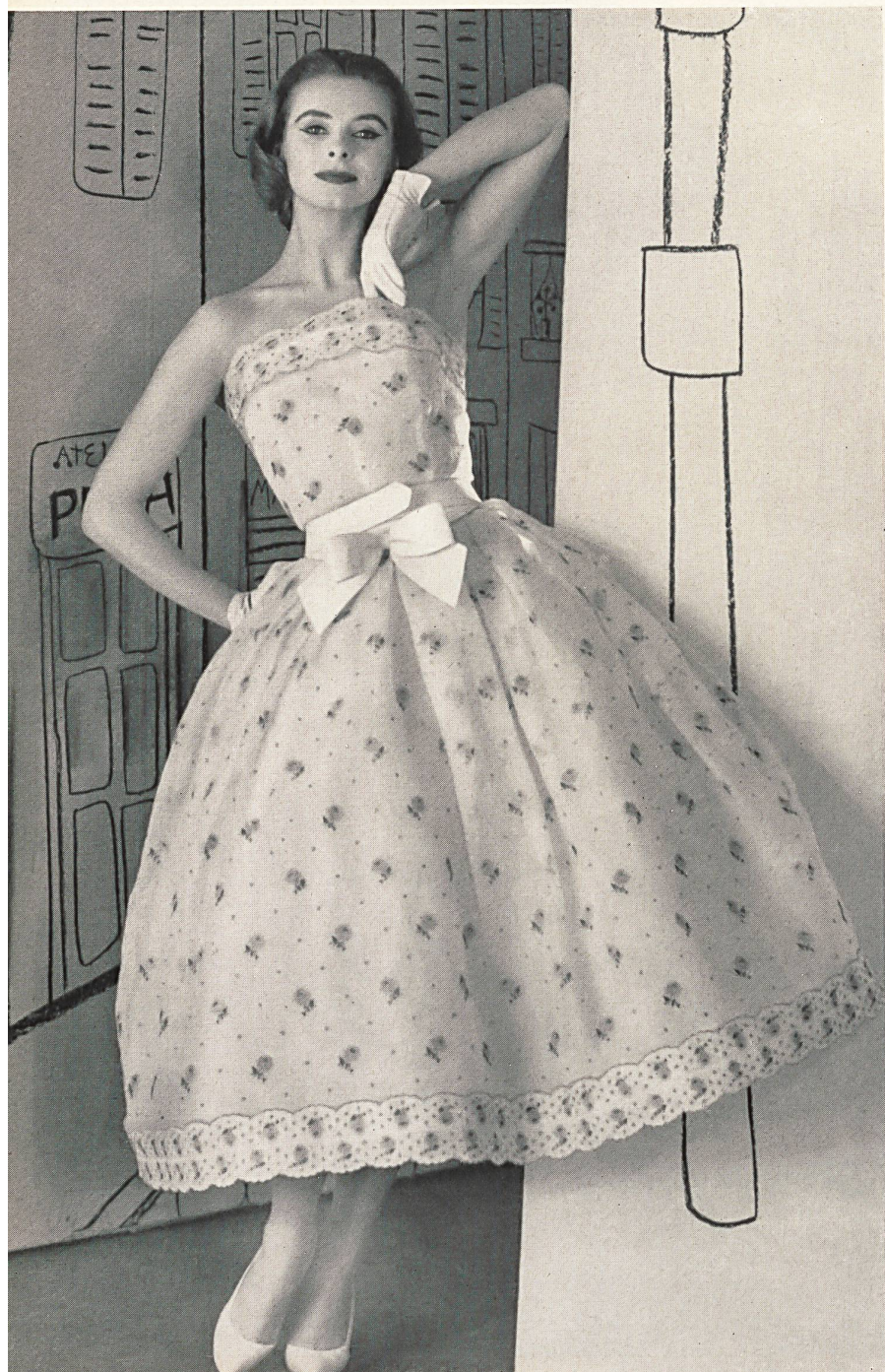
CHRISTIAN DIOR (Boutique) Organdi blanc, brodé de fleurettes corail de Union S.A., Saint-Gall