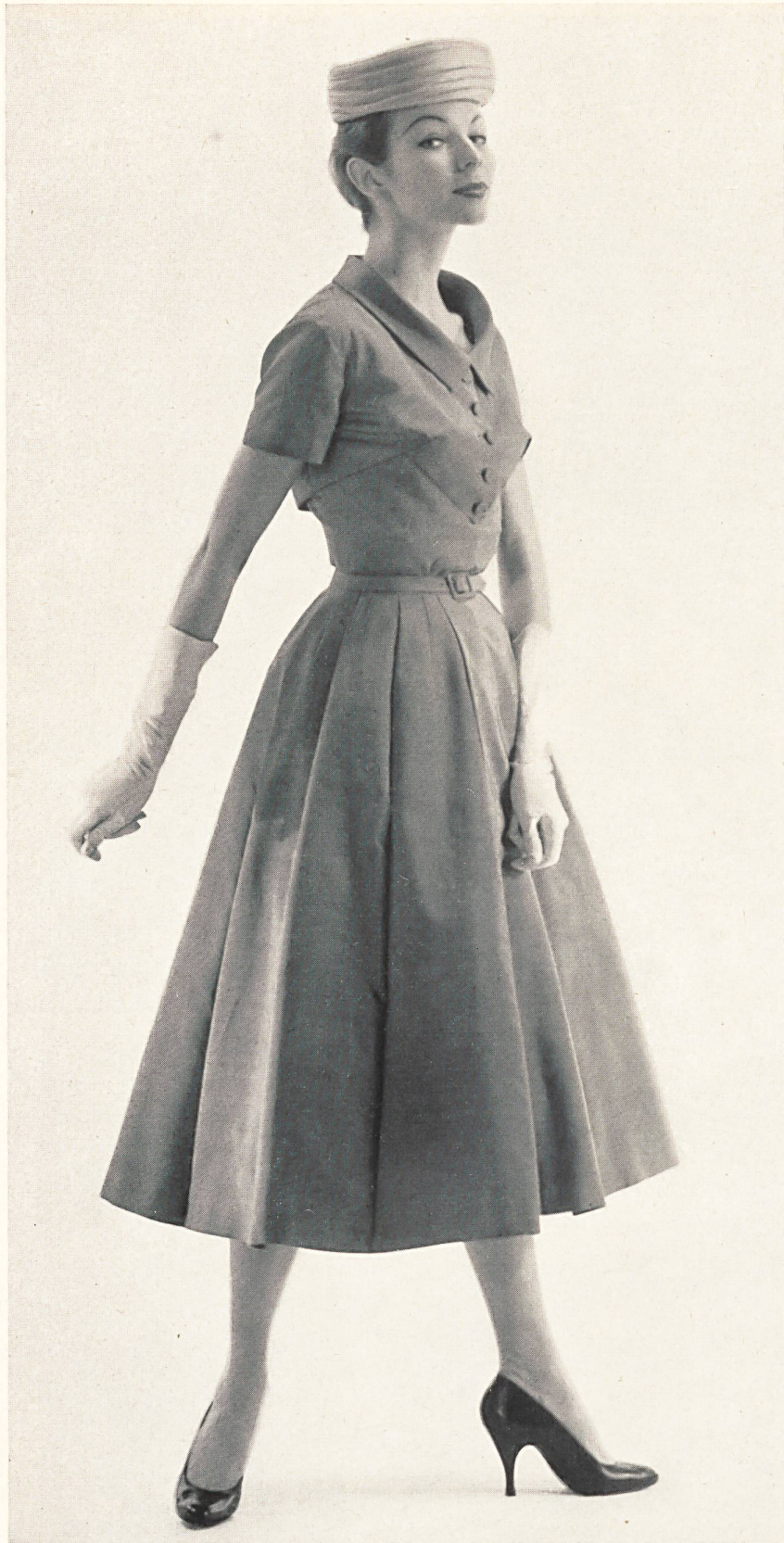
PIERRE BALMAIN (Boutique) Honan uni