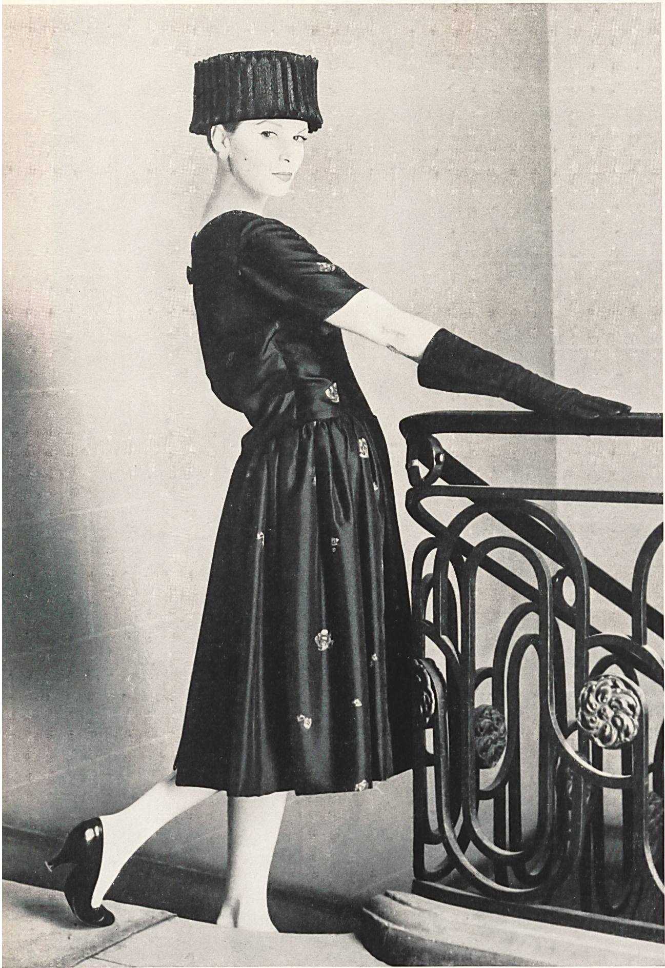
HUBERT DE GIVENCHY «Taftalia» imprimé de L. Abraham & Cie., Soieries S.A., Zurich