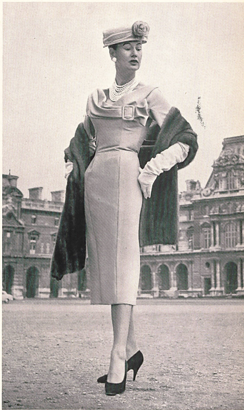
Création JEANNE LAFAURIE Tissu nouveau «Draplyne» de Heer & Cie. S.A., Thalwil