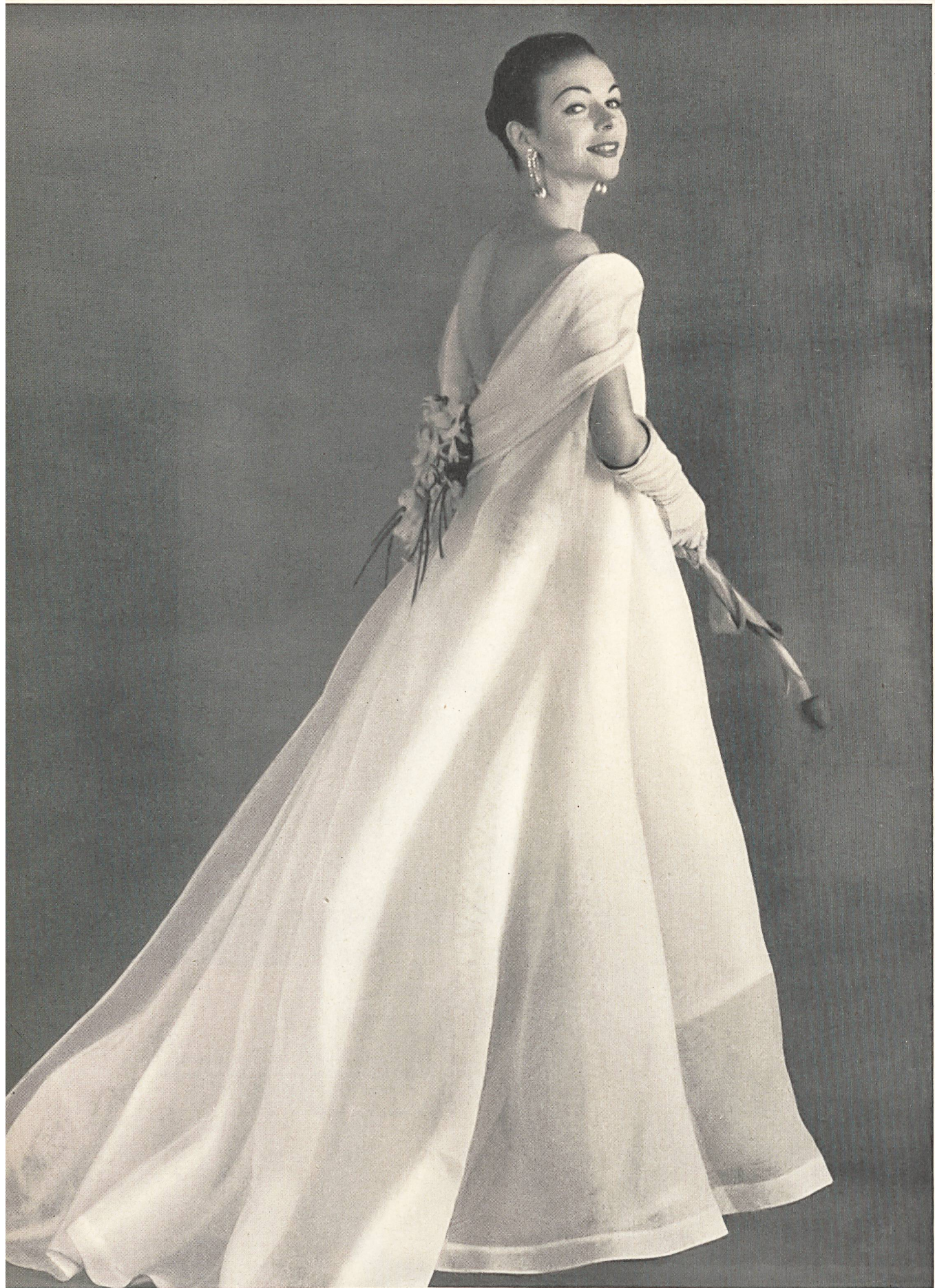
MAGGY ROUFF Organdi uni de Reichenbach & Co., Saint-Gall Montex, Paris