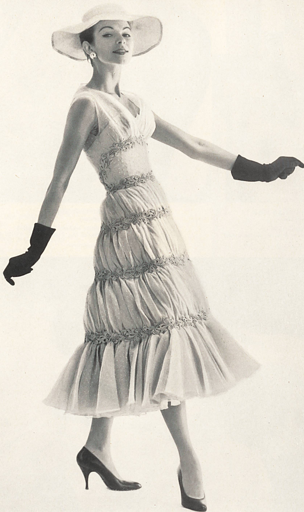
JEAN DESSES Tissu batiste «Recodoret» avec guipure de Reichenbach & Co., Saint-Gall Montex, Paris