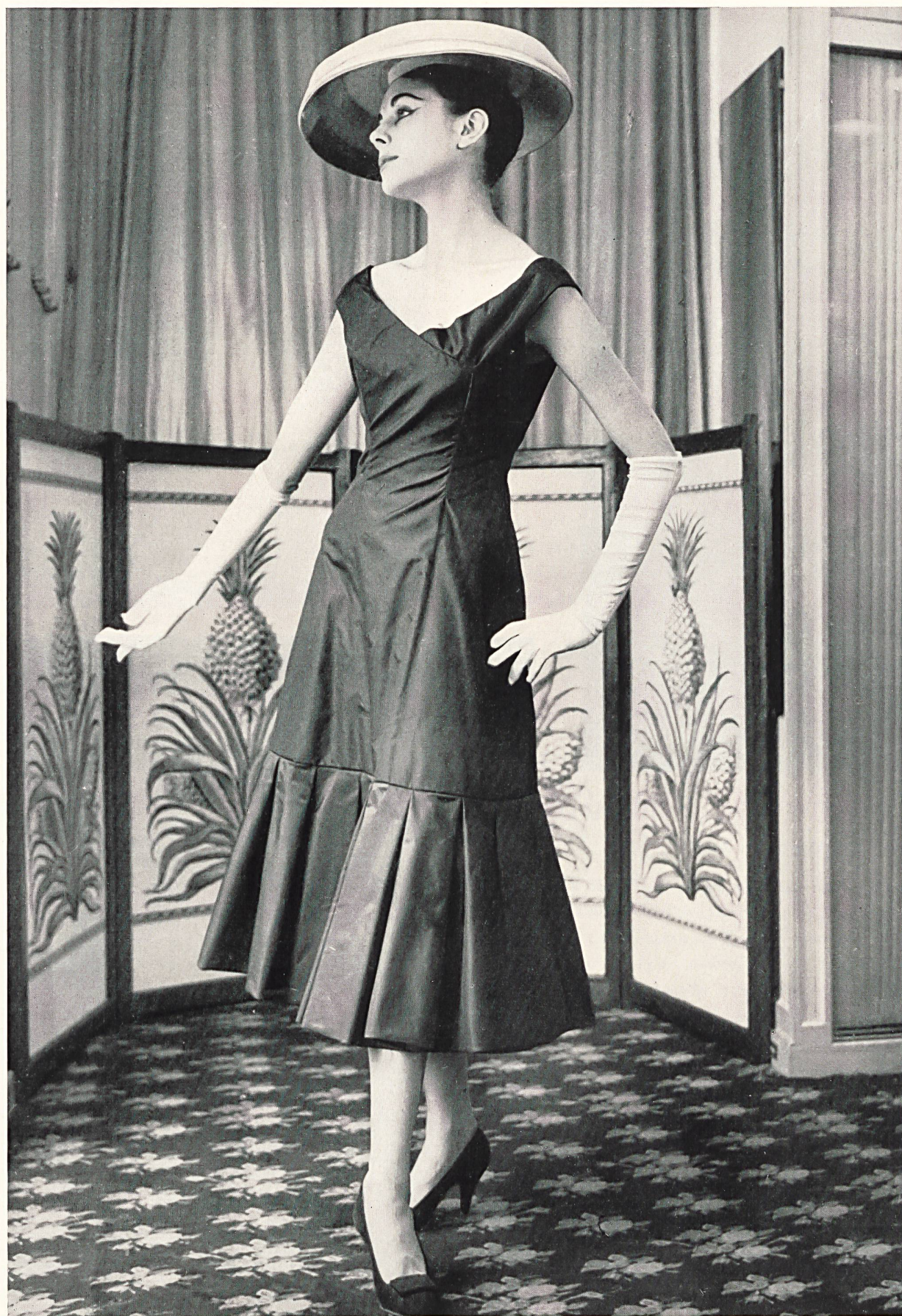
JEANNE LANVIN/CASTILLO Taffetas « Criton » soie noire de la Société Anonyme Stünzi Fils, Horgen