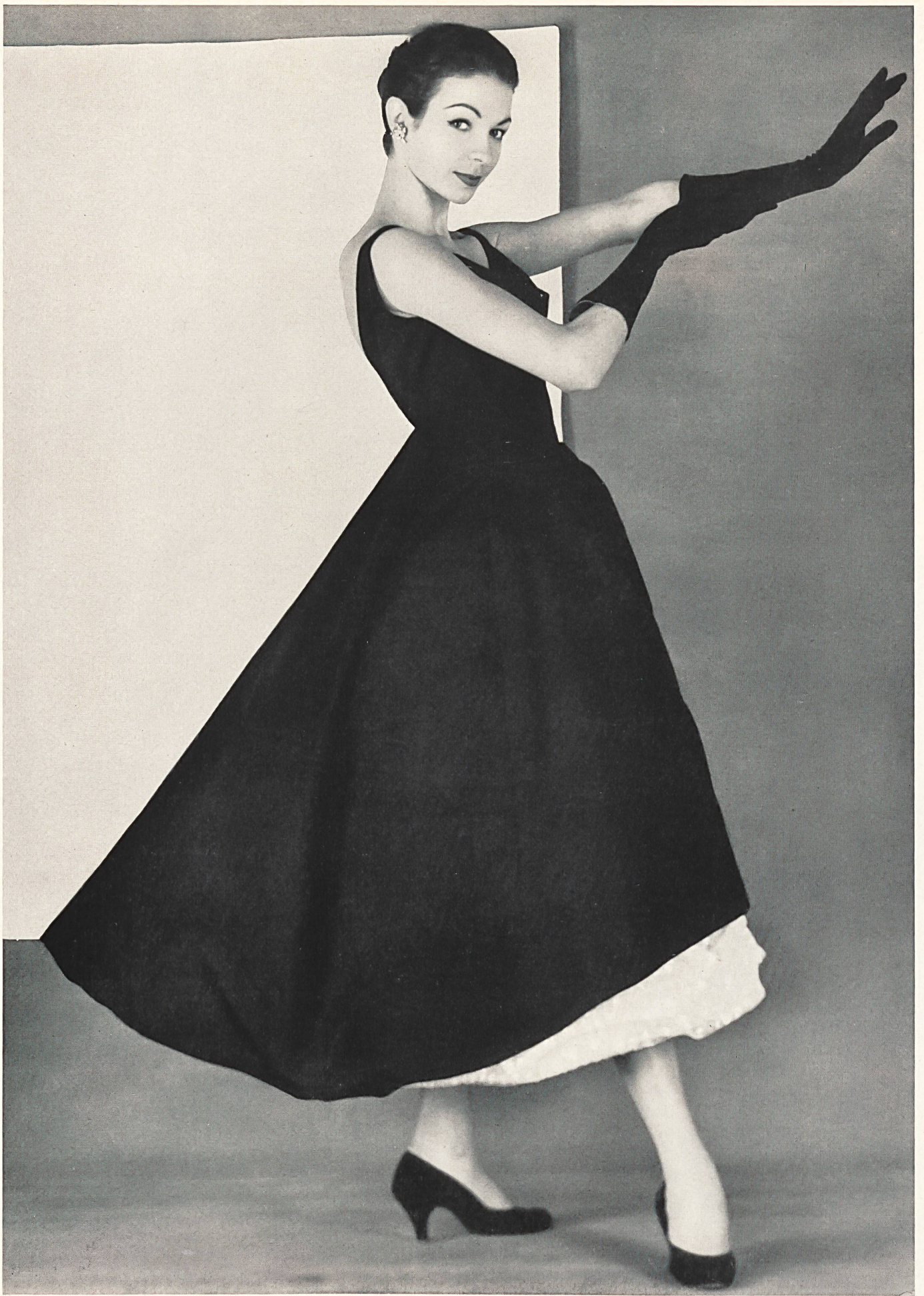
JACQUES HEIM Soie «Kashmir» de Stehli & Co., Zurich Distribué par Fred Carlin, Paris