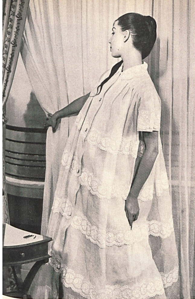
CHRISTIAN DIOR (Boutique) Organdi brodé de Forster Willi & Co., Saint-Gall