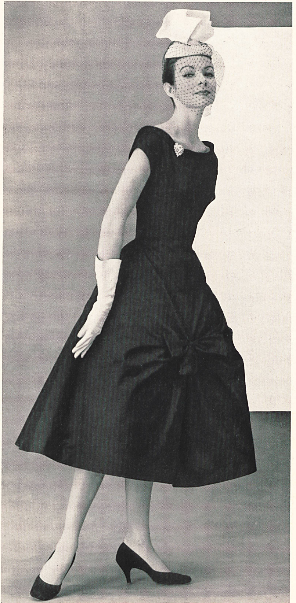
MAGGY ROUFF Soie «Gala» de Stehli & Co., Zurich Distribué par Fred Carlin, Paris