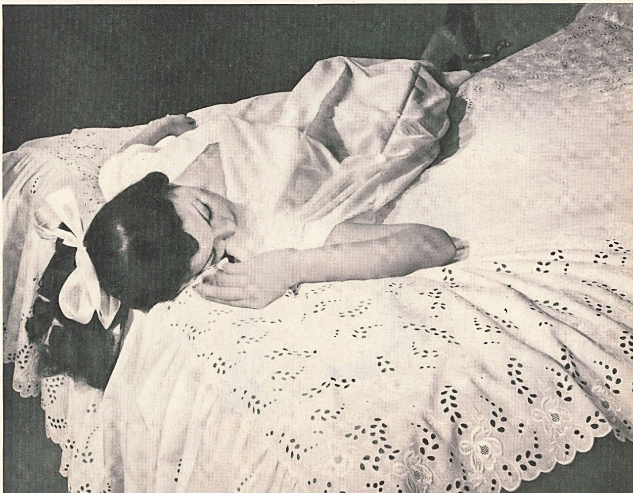
CHRISTIAN DIOR (Boutique) Couvre-lit en broderies de A. Naef & Cie, Flawil