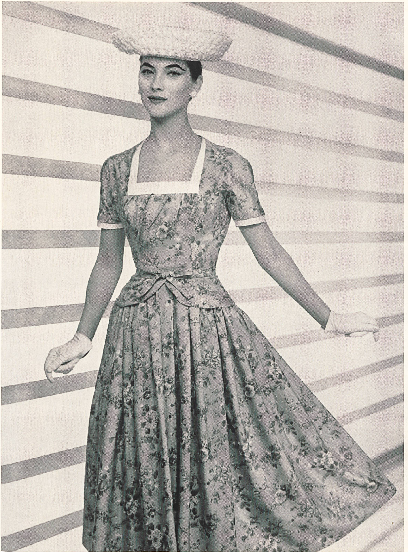
JACQUES FATH Tussah imprimé de Rudolf Brauchbar & Cie., Zurich Montex, Paris