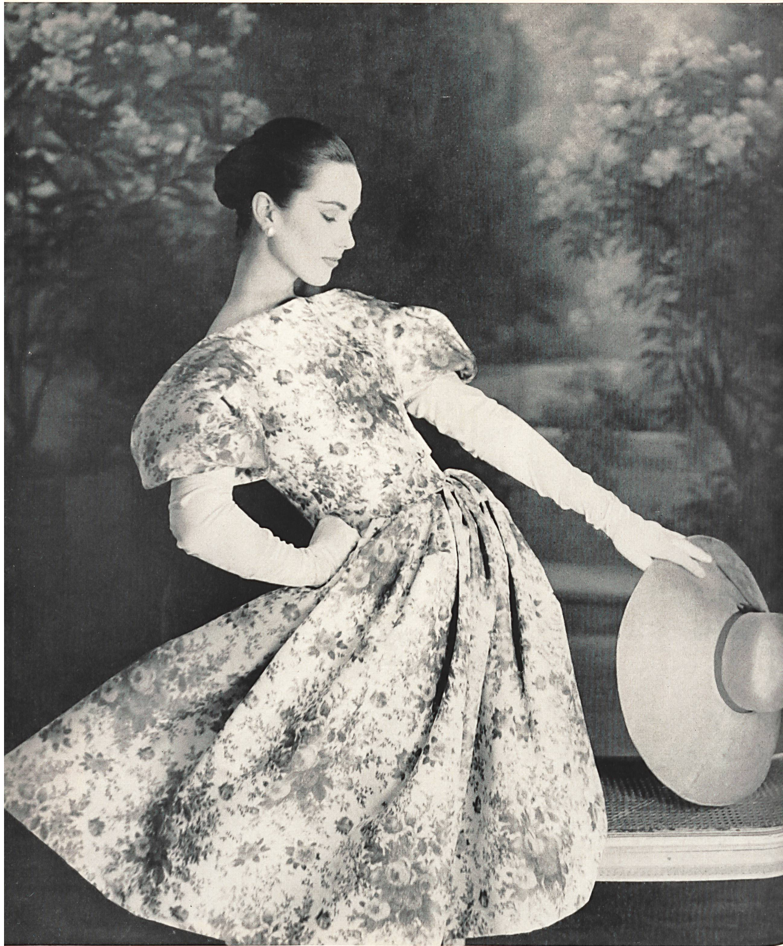
CHRISTIAN DIOR Faille chinée de L. Abraham & Cie., Soieries S.A., Zurich