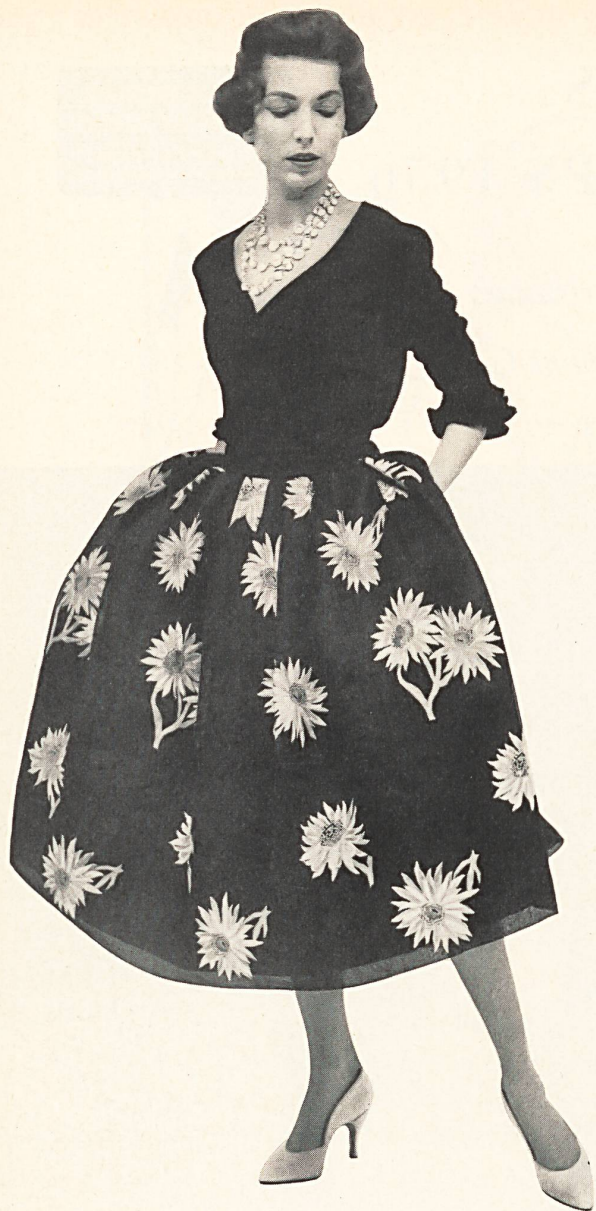
CHRISTIAN DIOR Organdi brodé couleurs de A. Naef & Cie, Flawil

CHRISTIAN DIOR → Organdi brodé couleurs de Forster Willi & Co., Saint-Gall