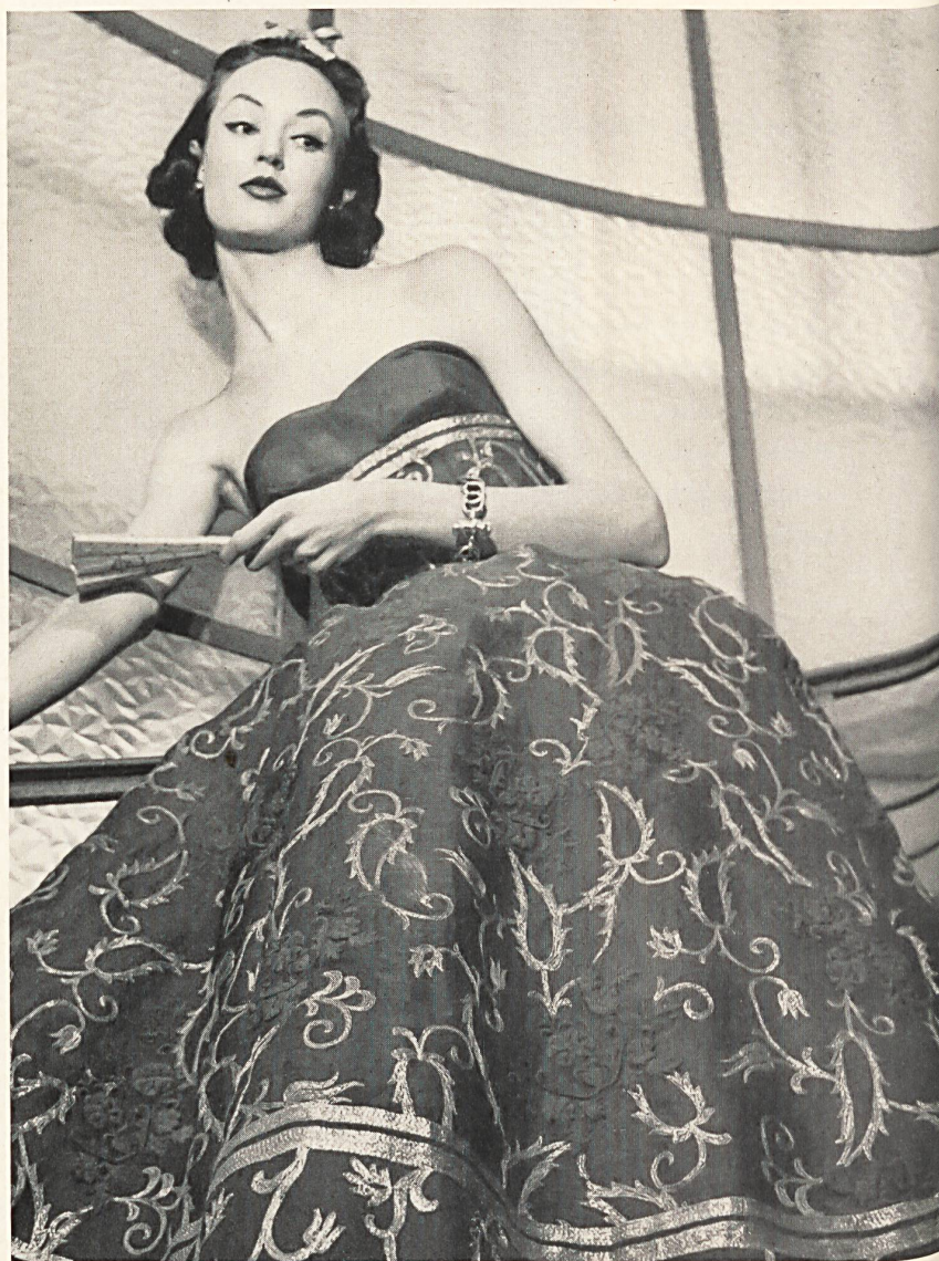
JEANNE LANVIN / CASTILLO Organdi rouge brodé laine et métal de Forster Willi & Co., Saint-Gall Grossiste à Paris: Chatillon, Mouly, Roussel S. A.