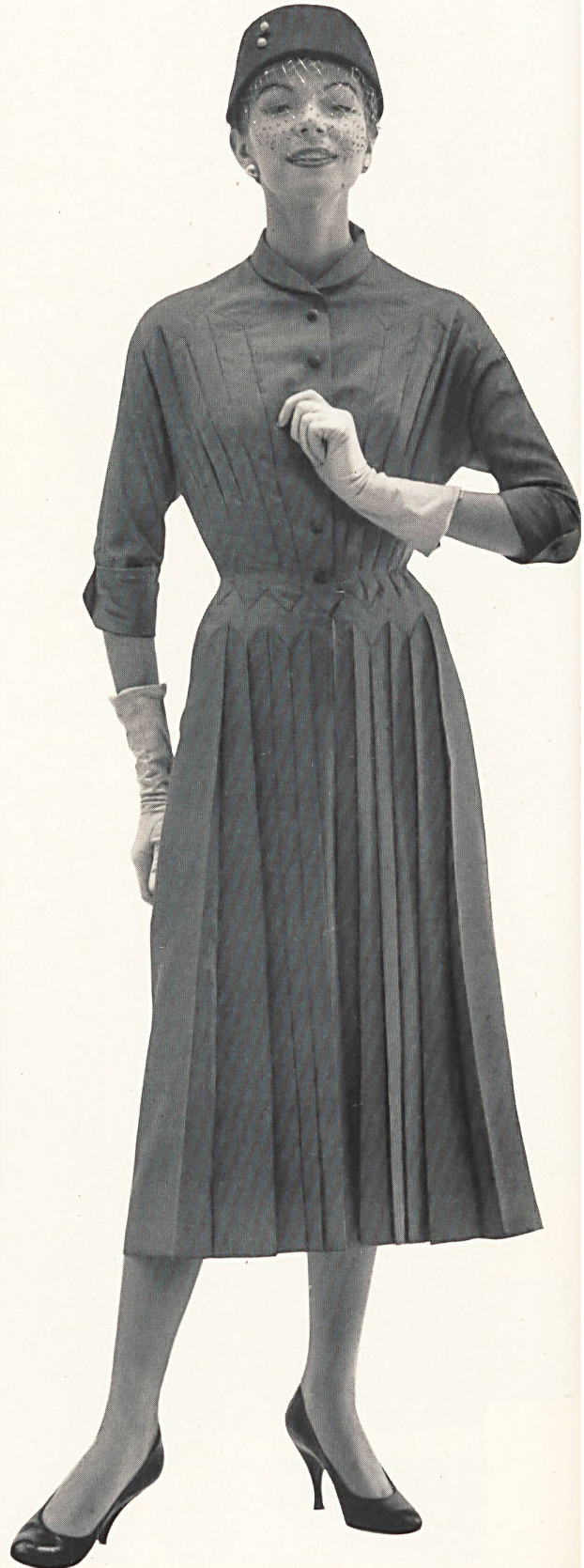
MANGUIN Honan uni de Rudolf Brauchbar & Cie., Zurich Montex, Paris