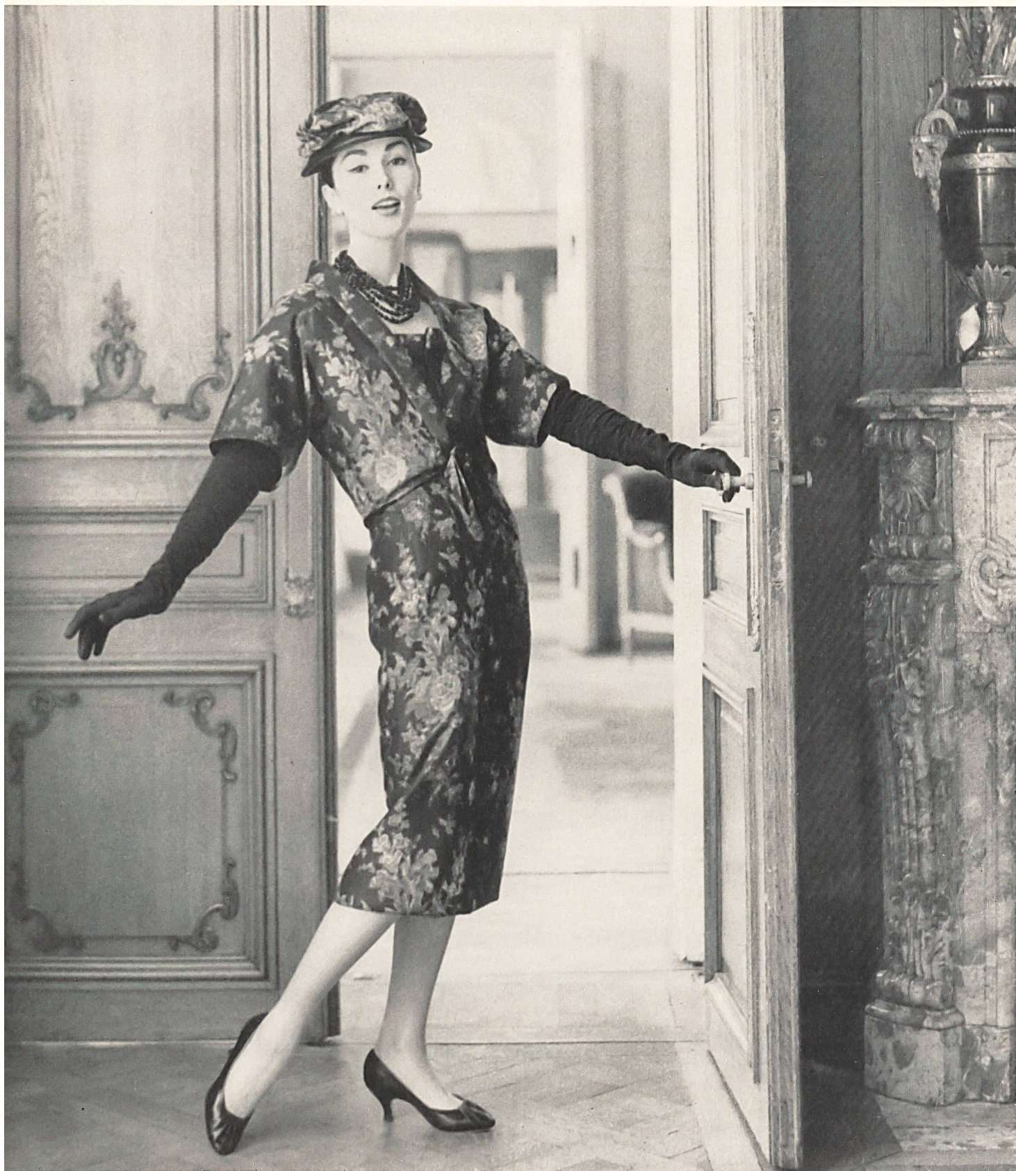
CHRISTIAN DIOR «Taftalia» imprimé de L. Abraham & Cie Soieries S.A., Zurich

MODÈLES EXCLUSIFS REPRODUCTION INTERDITE (Chambre syndicale de la couture parisienne)