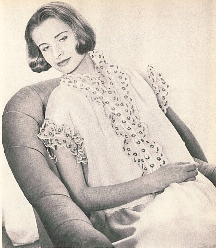
CHRISTIAN DIOR (Boutique) Broderies couleurs sur organdi de A. Naef & Cie, Flawil