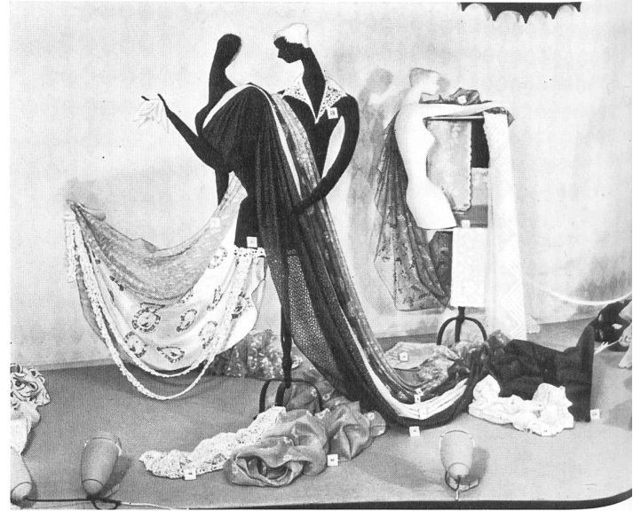
Bordados y tejidos finos de algodón de San-Gall.

La « Semana Suiza » de Estocolmo ha constituido un éxito. Esperemos que contribuirá duraderamente a desarrollar las relaciones comerciales sueco-suizas, como fué expresado por todos los participantes.