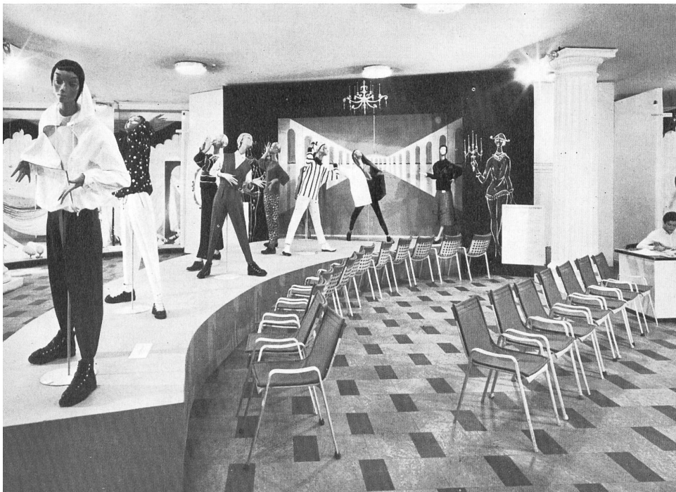
Vestidos de deporte.