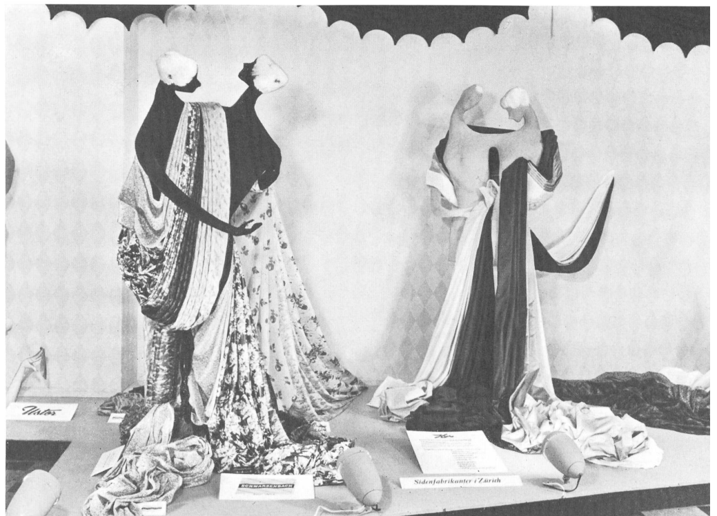
Un aspecto de la exposición de la industria de la seda.