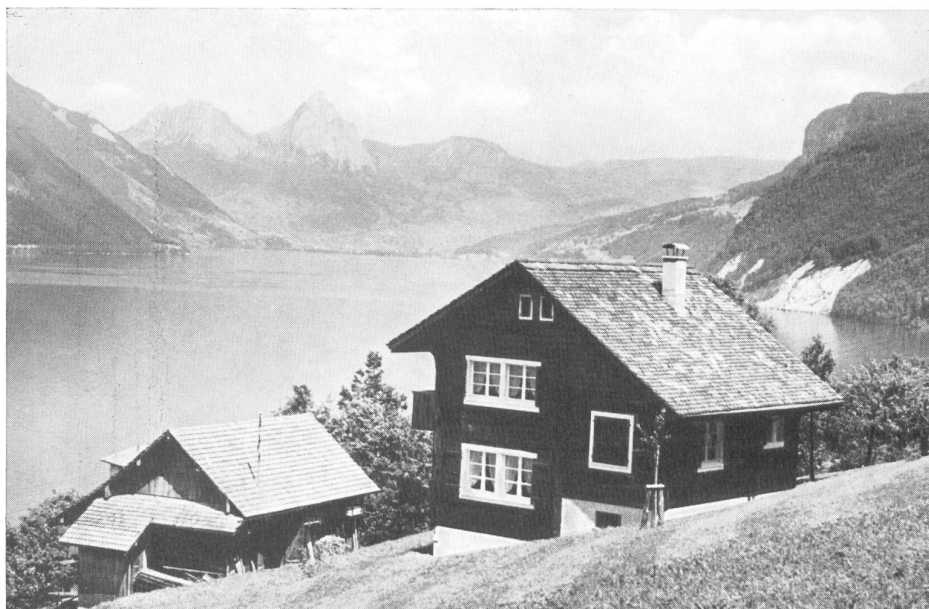
Una de las casas de reposo para los empleados, en Beckenried cerca de Lucerna.

La obra conmemorativa de la Hilatura del Lorze debe quedar reseñada como un modelo de su clase. Al disponer de una documentación abundante y completa, el autor supo sacar provecho muy competentemente y, al mismo tiempo que reseña el historial de una empresa, ha logrado escribir un capítulo en el que estudia muy a fondo el desarrollo industrial y económico suizo durante los últimos cien años transcurridos.