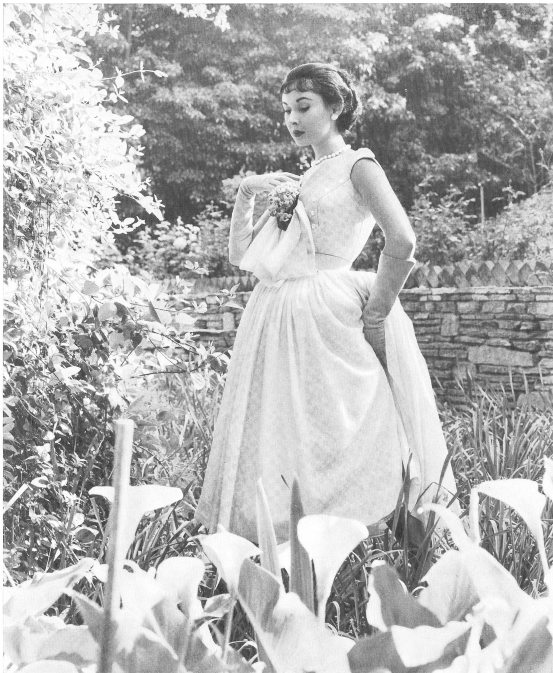
Blue check patterned cotton voile.

afamado salón de Hattie Carnegie. Dióse cuenta entonces de que era precisamente en esta esfera donde estaba su vocación y, ya durante su aprendizaje, estudió el dibujo en una escuela de bellas artes, aprendió la técnica del corte y del drapeado y, como tenía talento, empezó a vender dibujos suyos a las casas neoyorkinas fabricantes de ropa confeccionada.