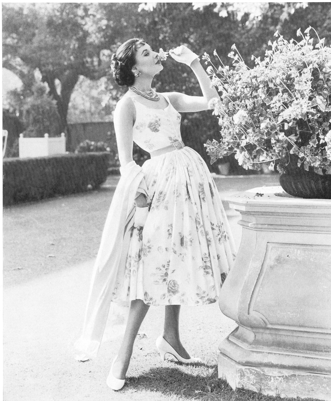
White cotton fabric with pink printed roses.

Esto nos hace volver la vista veintinueve años atrás, cuando James Galanos nació en Filadelfia, en una familia de emigrados griegos. Primeramente vivió en pequeñas poblaciones de Pensilvania y de Nueva Jersey hasta que salió del domicilio de sus padres a los dieciocho años para vender tejidos y procurar crearse relaciones en el