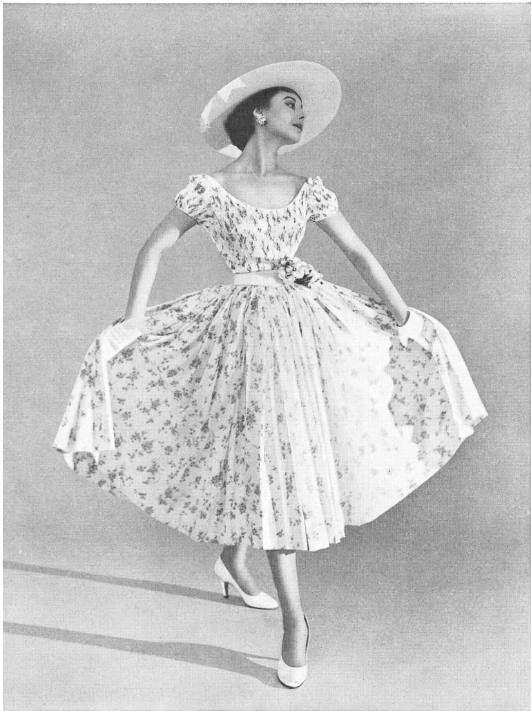
« Voiletta » cotton fabric with dainty posies print.