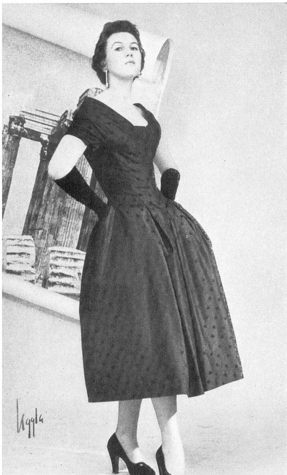
AB Martin-Konfektion, Stockholm Damas tussah pure soie de Emar S. A., Zurich