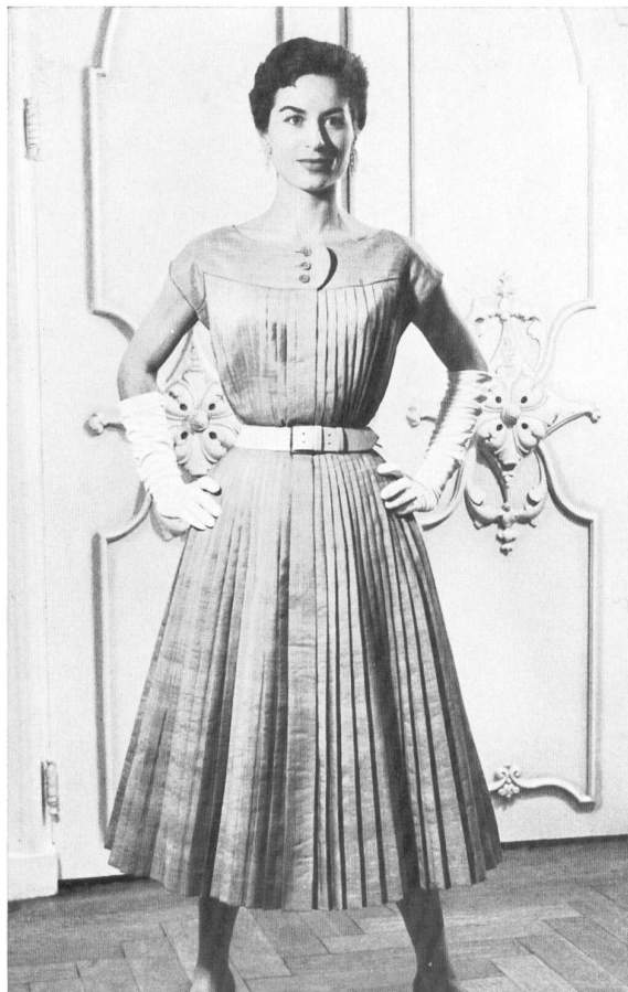
Jolo-Couture N.V., Utrecht Shantung pure soie de Rudolf Brauchbar & Cie, Zurich