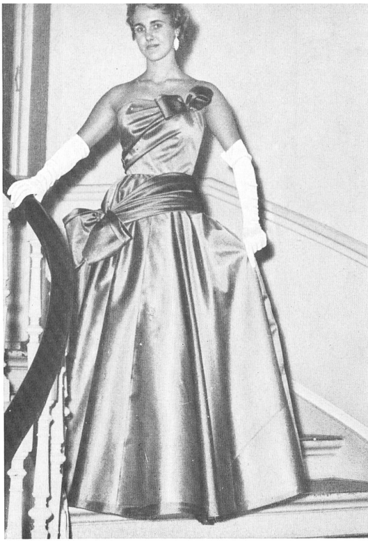
Honico A/S, Copenhagen Organza Cristalline de Emar S. A., Zurich