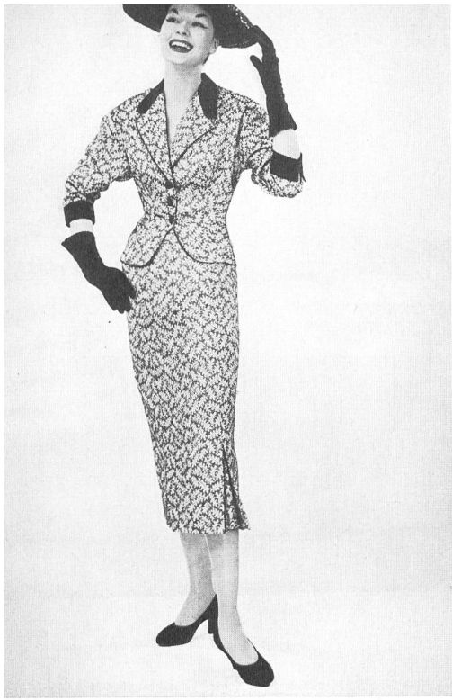
Jersey Mavèl, Amsterdam Panama façonné de Rudolf Brauchbar & Cie, Zurich