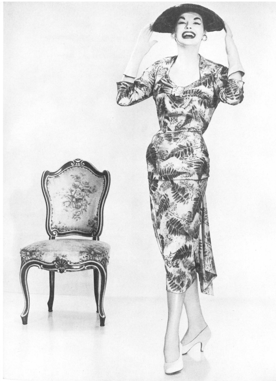
Gerson L. Dreese N.V., Amsterdam Toile magique pure soie de Emar S. A., Zurich