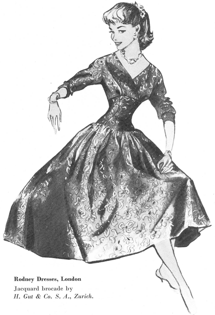
Rodney Dresses, London

A los fabricantes de vestidos no les embaraza la dificultad que presentan los hombres estrechos y el