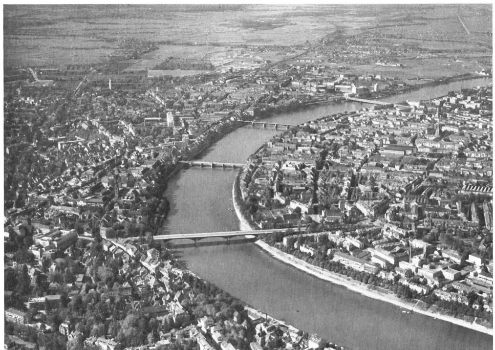
Basilea vista desde avión. A la izquierda el casco de la ciudad antigua, a orillas del Reno, entre los dos primeros puentes.