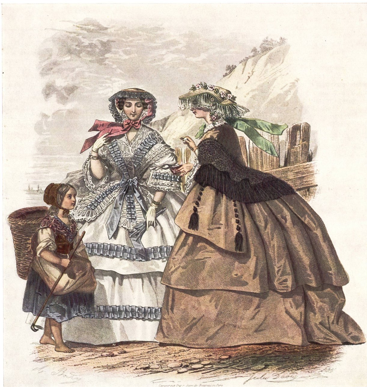
La cinta en la moda femenina de hace un siglo (según grabados de la época).

Los fabricantes cumplen la difícil tarea de dirigir una producción que ha de renovarse incesantemente para seguir la evolución de la moda y las costumbres de los