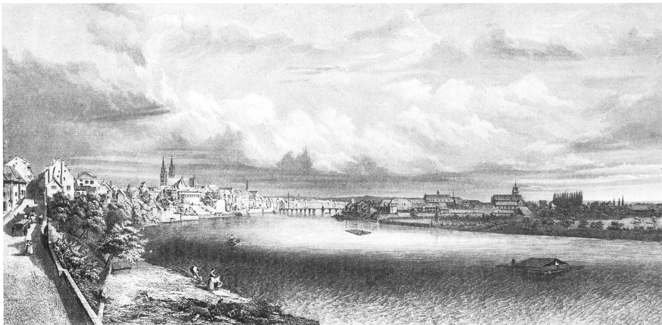
Basilea, hace un siglo (según un grabado de la época).