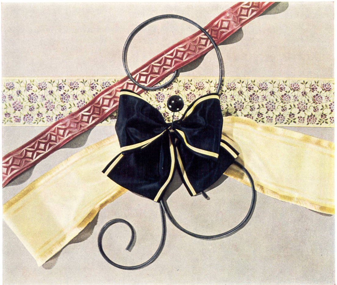
Cintas modernas de Basilea, distintos modelos.