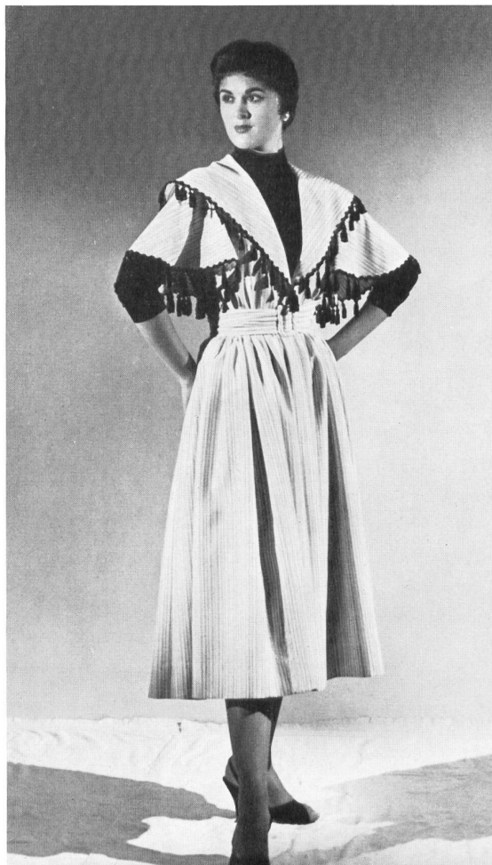
Spun rayon coat dress. « Zürrer » fabric by Weisbrod Zürrer Fils, Hausen s.A.

Las dos hermanas empezaron por abrir una tienda con el fin de darse cuenta de las necesidades del público. Después de un año de experiencia, durante el cual los negocios fueron viento en popa, sacaron en consecuencia que pocas son las mujeres que tienen gusto propio, que, sin embargo, saben lo que se quieren, y compran prendas bonitas, con tal de que les sean presentadas. Con la ayuda de un amigo, que se ocupa de la compra en nombre de tiendas de ropa hecha, se lanzaron hace un año en la costura al por mayor. La decoración de sus salones es encantadora y femenina en sumo grado ; por el menor motivo invitan a tomar un café o un té ; siempre están dispuestas a mezclar sus gracias con su trabajo y no es raro el que reciban a sus visitas entarascadas con tocados