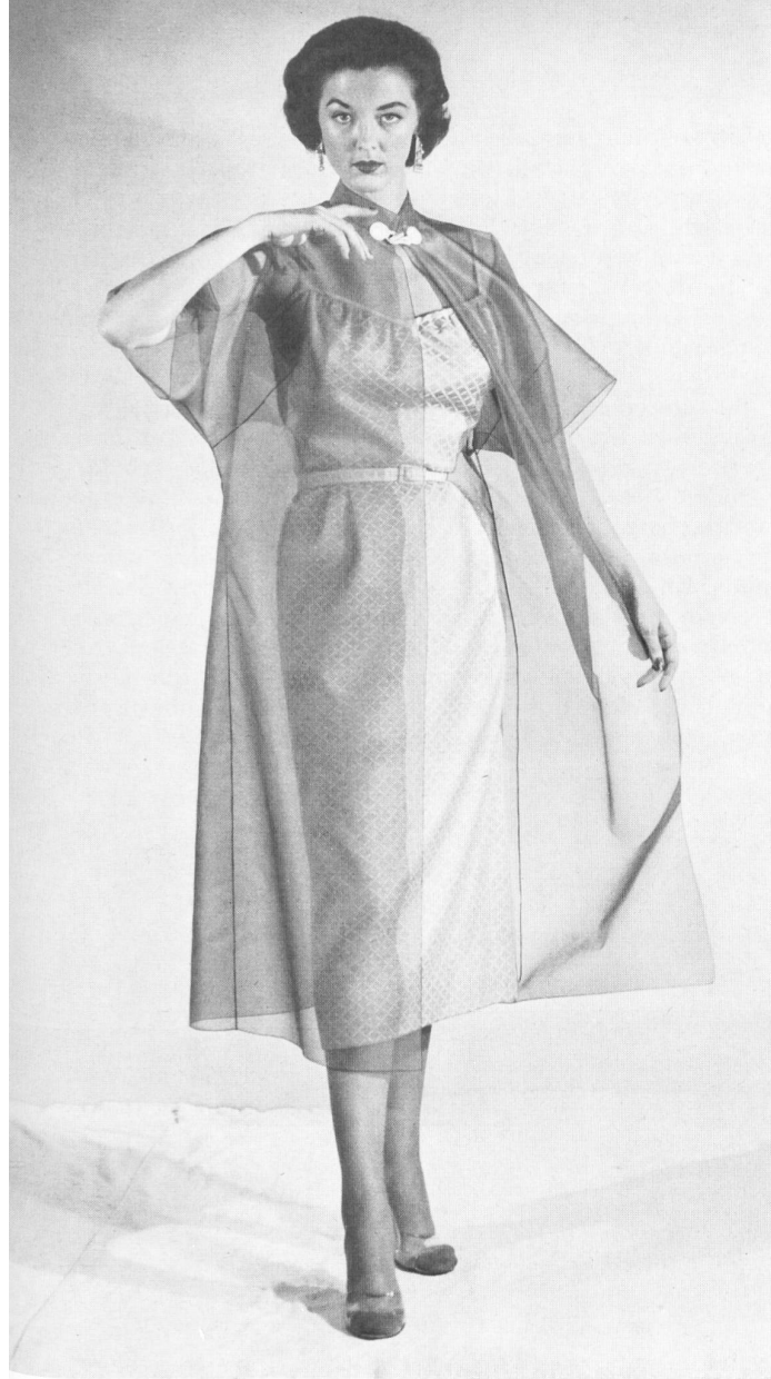
Dress of beige cotton Jacquard by Edwin Naef S.A., Zurich. Coat of bronze silk organza by L. Abraham & Co. Silks Ltd. Zurich.