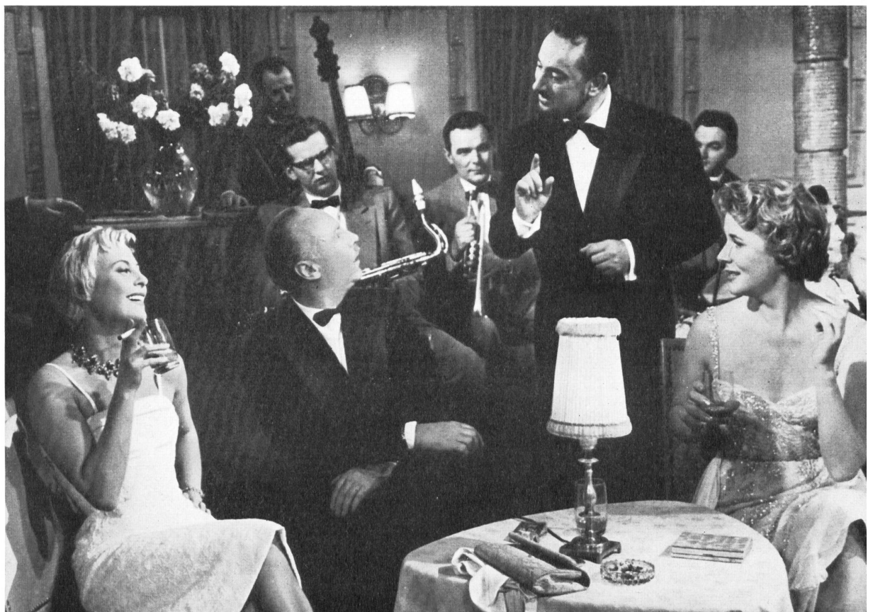
Michèle Morgan porte une robe de Hubert de Givenchy en toile brodée. Tissu de Rudolf Brauchbar & Cie, Zurich; distribué par Montex, Paris. Scène tirée du film « Oasis » en cinémascope, de Yves Allégret, avec Michèle Morgan (à gauche) et Pierre Brasseur (au centre).

— Entonces ¿me permitirá que le diga que Mallarmé hizo durante algún tiempo crónicas sobre la moda y que las lograba