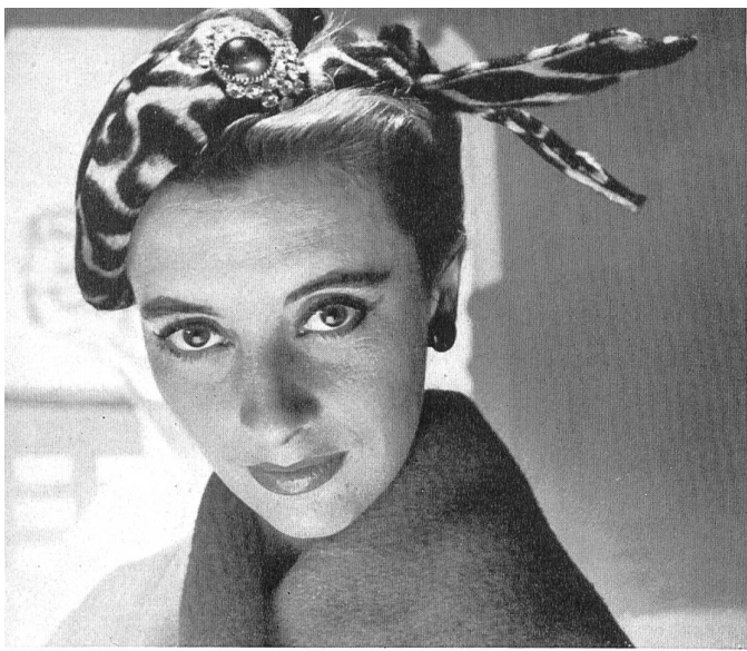
Modelo suizo