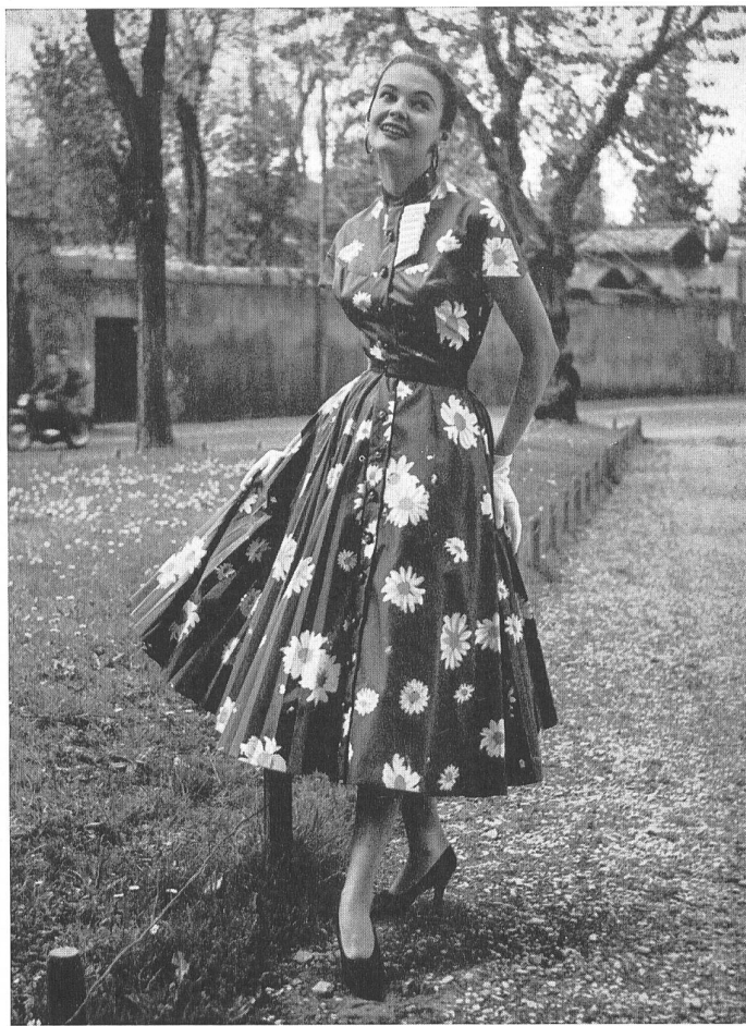
Antonelli, Rome Tissu « Poplinella » de Stoffel & Cie, St-Gall

de algodón, animado por florecillas solemnes y cándidas que parecen sacadas de un Libro de Horas : una cinta azul zafiro va anudada en torno de tanta blancura resplandeciente. En Venecia, en Capri y por todas partes, esa acertada mezcla de talentos opuestos valdrá a la joven desconocida y encintada el romanesco elogio de « Italian Look ».