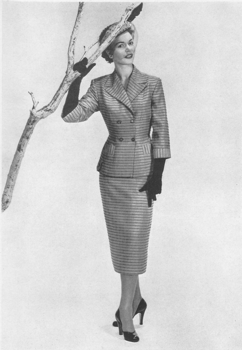
Fresco barré, rayonne et fibranne. Modèle Hellas Mfg. Co. (Pty) Ltd., Cape Town.