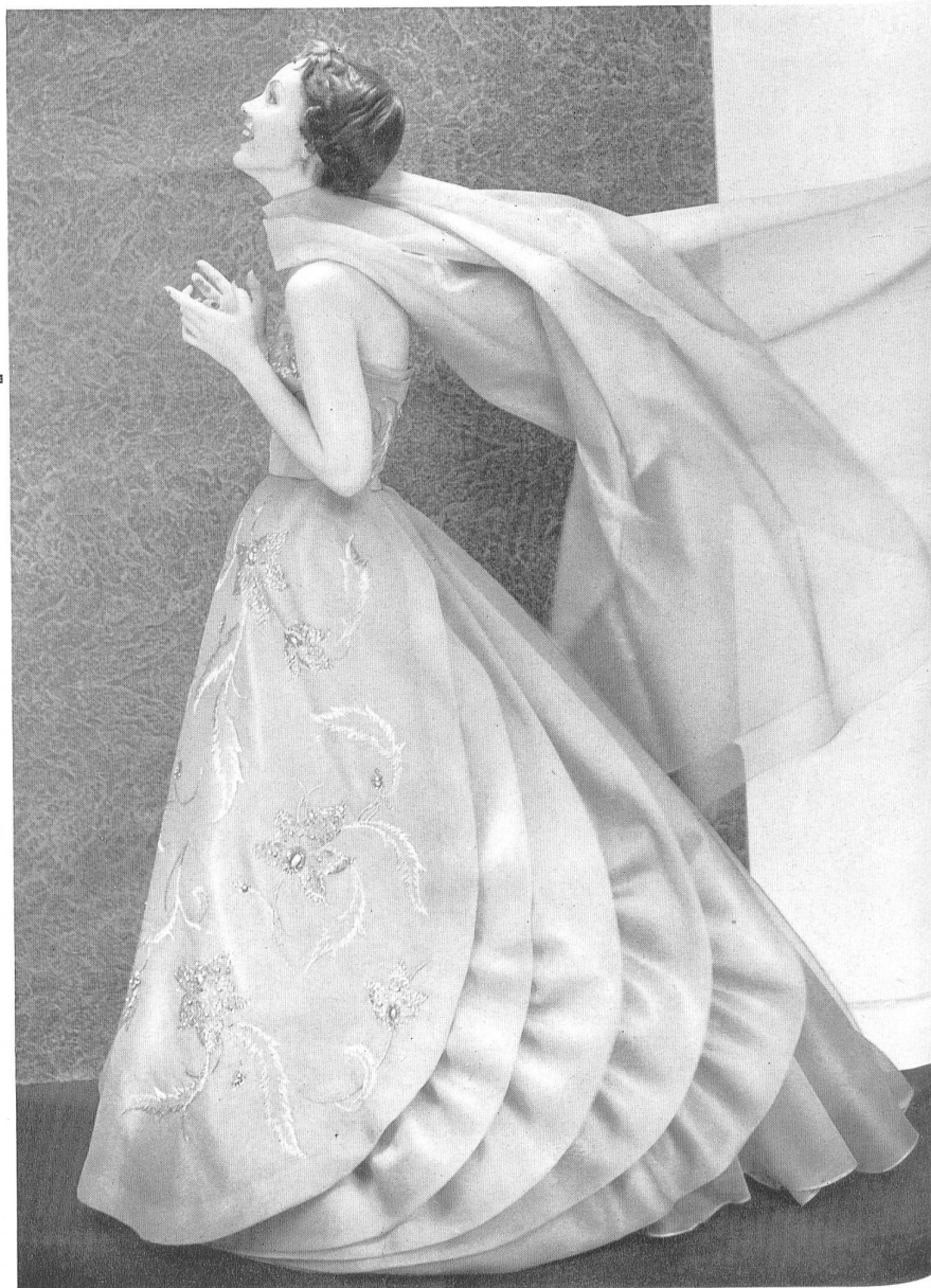
Organza pure soie. Modèle Marty & Cie, Zurich.