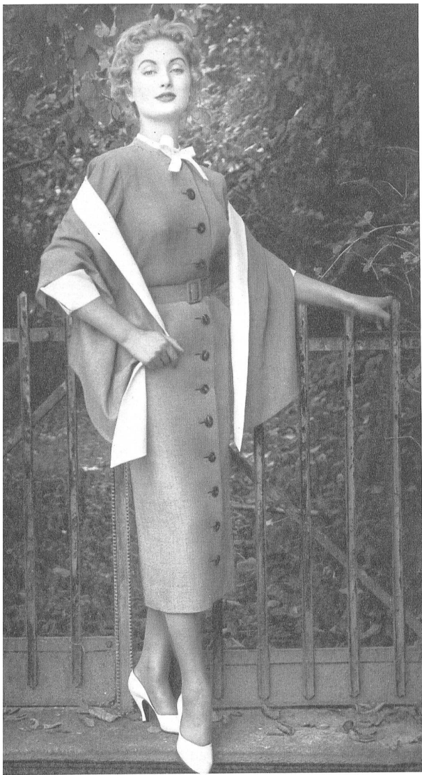
Tweed Belrobe fibranne. Modèle R. Cafader & Cie, Zurich.