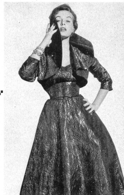
Matelassé façonné lamé. Modèle Hartnell Garment Co., Melbourne.