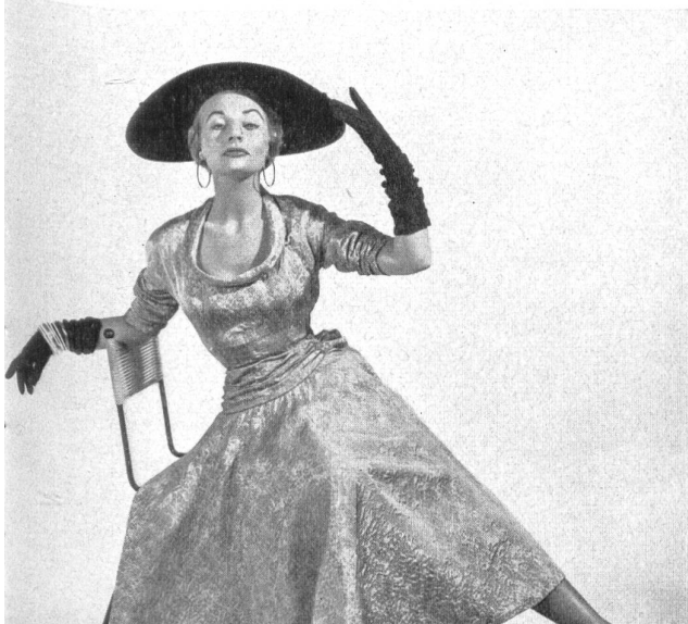
Matelassé façonné. Modèle Hartnell Garment Co., Melbourne.