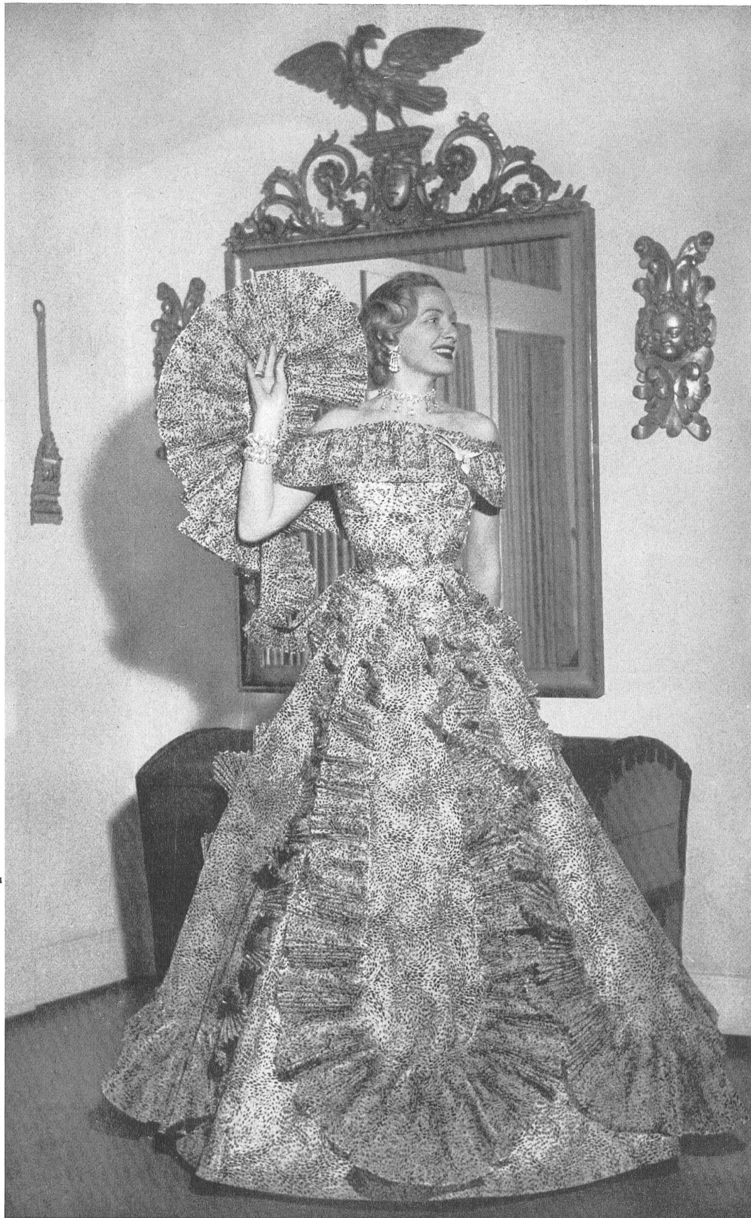
Flocosa, organdi de coton imprimé flock noir. Modèle Fred Spillmann, Bâle.