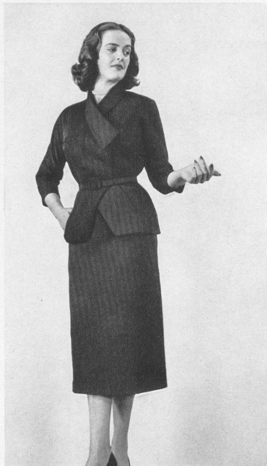
Grosgrain couture, rayonne et fibranne. Modèle Peggy Fashions (Pty) Ltd., Johannesburg.