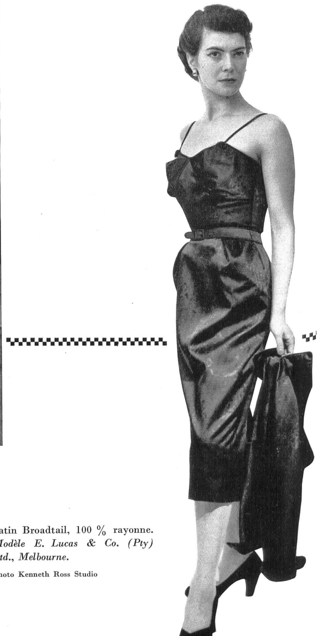
Satin Broadtail, 100 % rayonne. Modèle E. Lucas & Co. (Pty) Ltd., Melbourne.