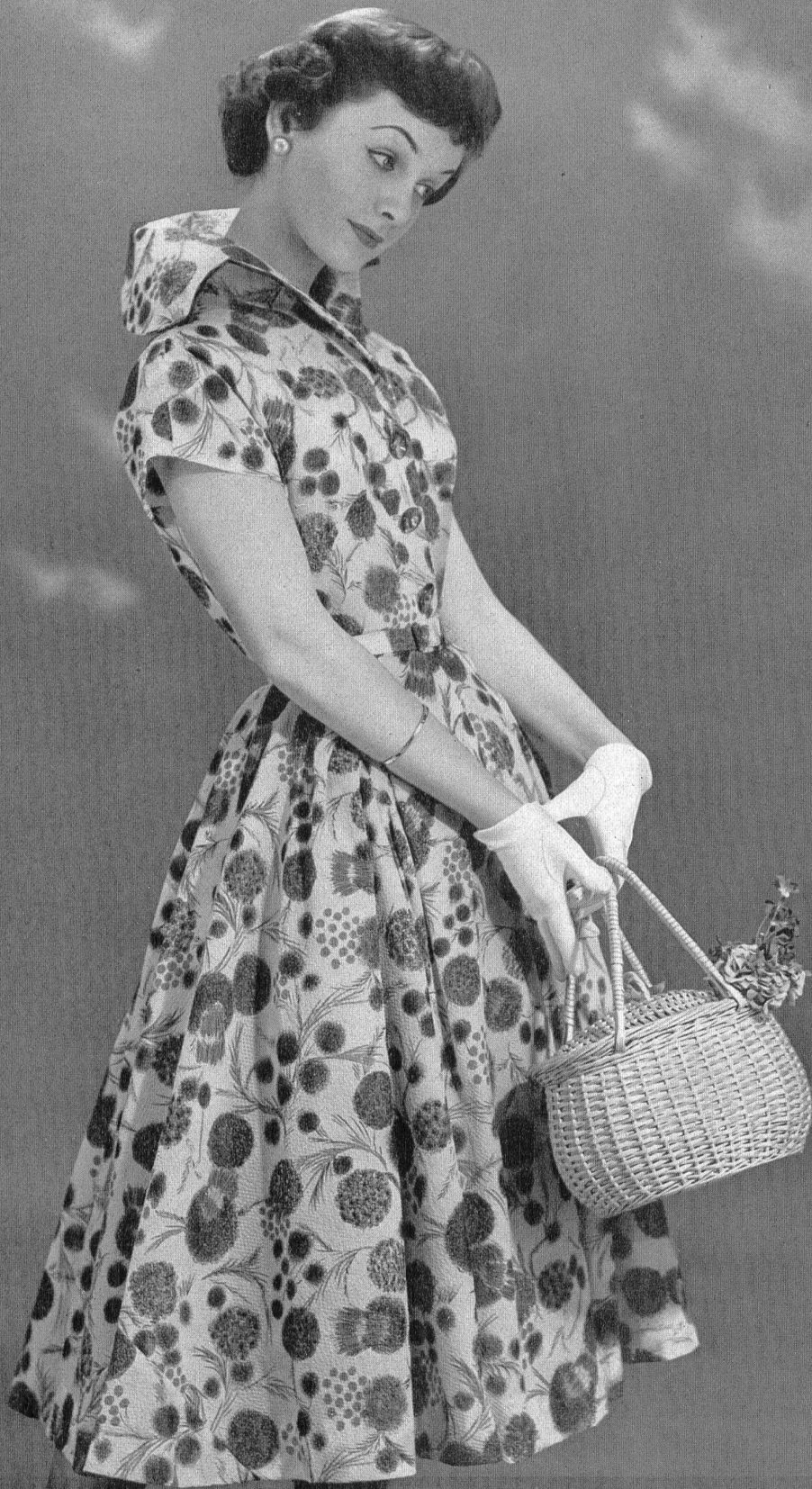
Nylon imprimé. Modèle Willy Meyer S. A., Zurich.