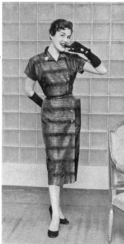
Matelassé façonné lamé. Modèle Molstad & Co., Oslo.