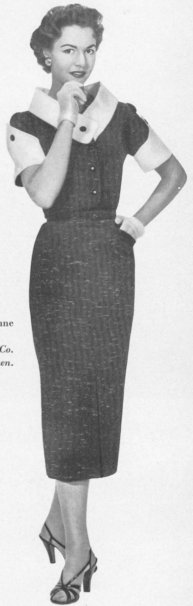
Toile Haruko, rayonne et fibranne. Modèle Hellas Mfg. Co. (Pty) Ltd., Cape Town.