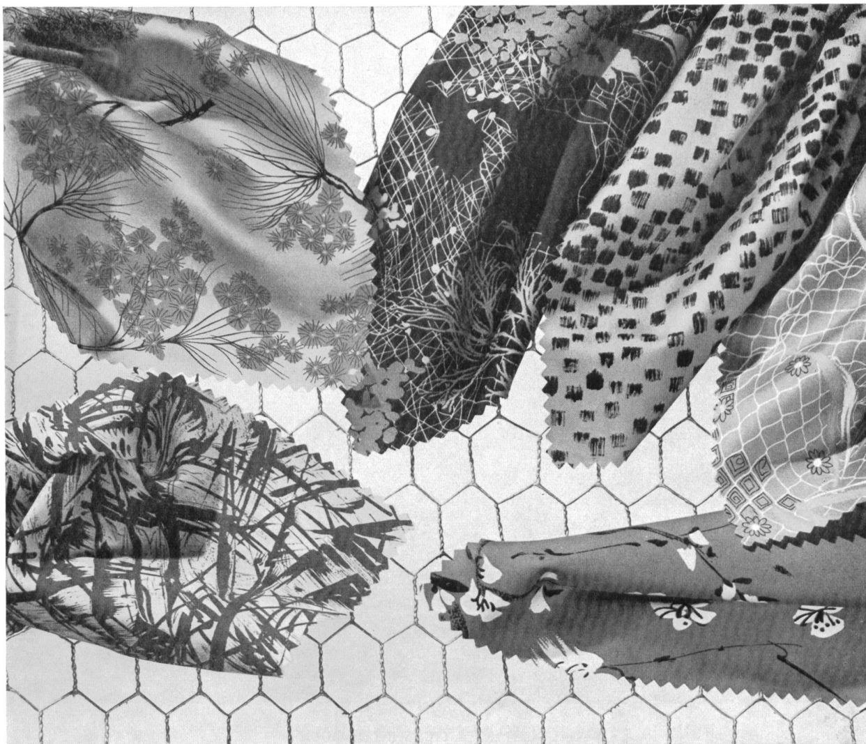
REICHENBACH & CO., ST-GALL « RECOSUPRA »

Popeline imprimée infroissable, dernières créations de la collection d'été 1954.