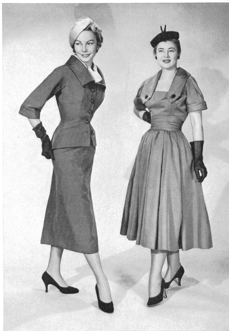
CHRISTIAN DIOR, NEW YORK

Rivalizando en ingenio, los telares americanos y los de Suiza u otros países de Europa inundan el mercado con hermosos tejidos de una variedad sin límites. Y la actual boga de emplearlos, mezclándolos de mil maneras