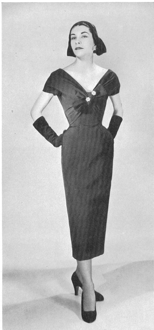
CHRISTIAN DIOR, NEW YORK

« Amadis » silk by L. Abraham & Cie, Soieries S. A., Zurich.