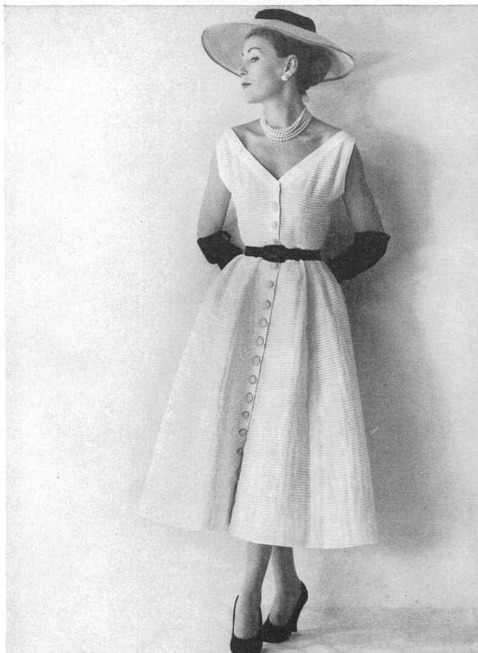
Batiste blanche plissée horizontalement de Reichenbach & Co., St-Gall distribué par Montex, Paris.