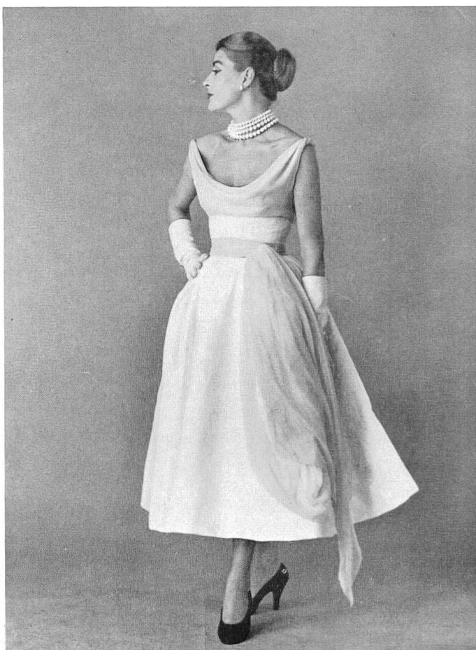
Coton jacquard blanc piqué fantaisie de Rudolf Brauchbar & Cie, Zurich distribué par Montex, Paris.