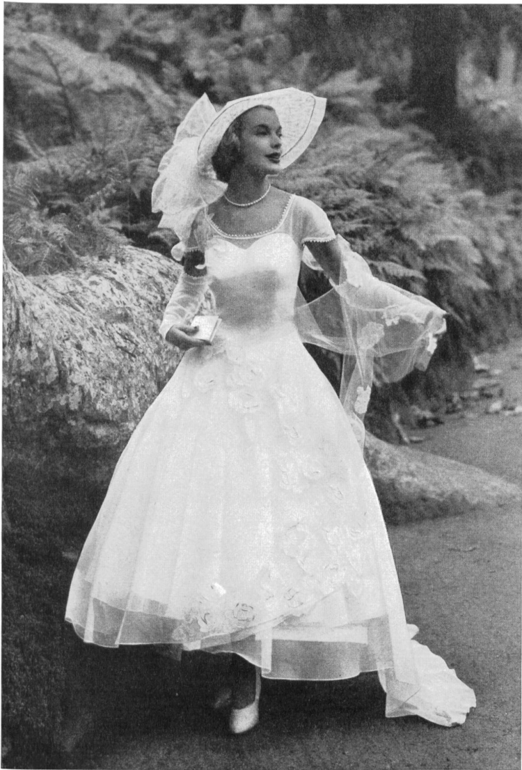
Embroidered organdy with detach- ed flowers by Forster Willi & Co., St-Gall.