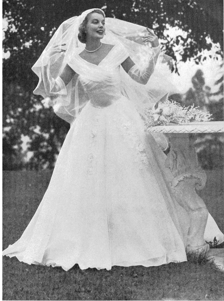
Bridal gown. Embroidered organdy by