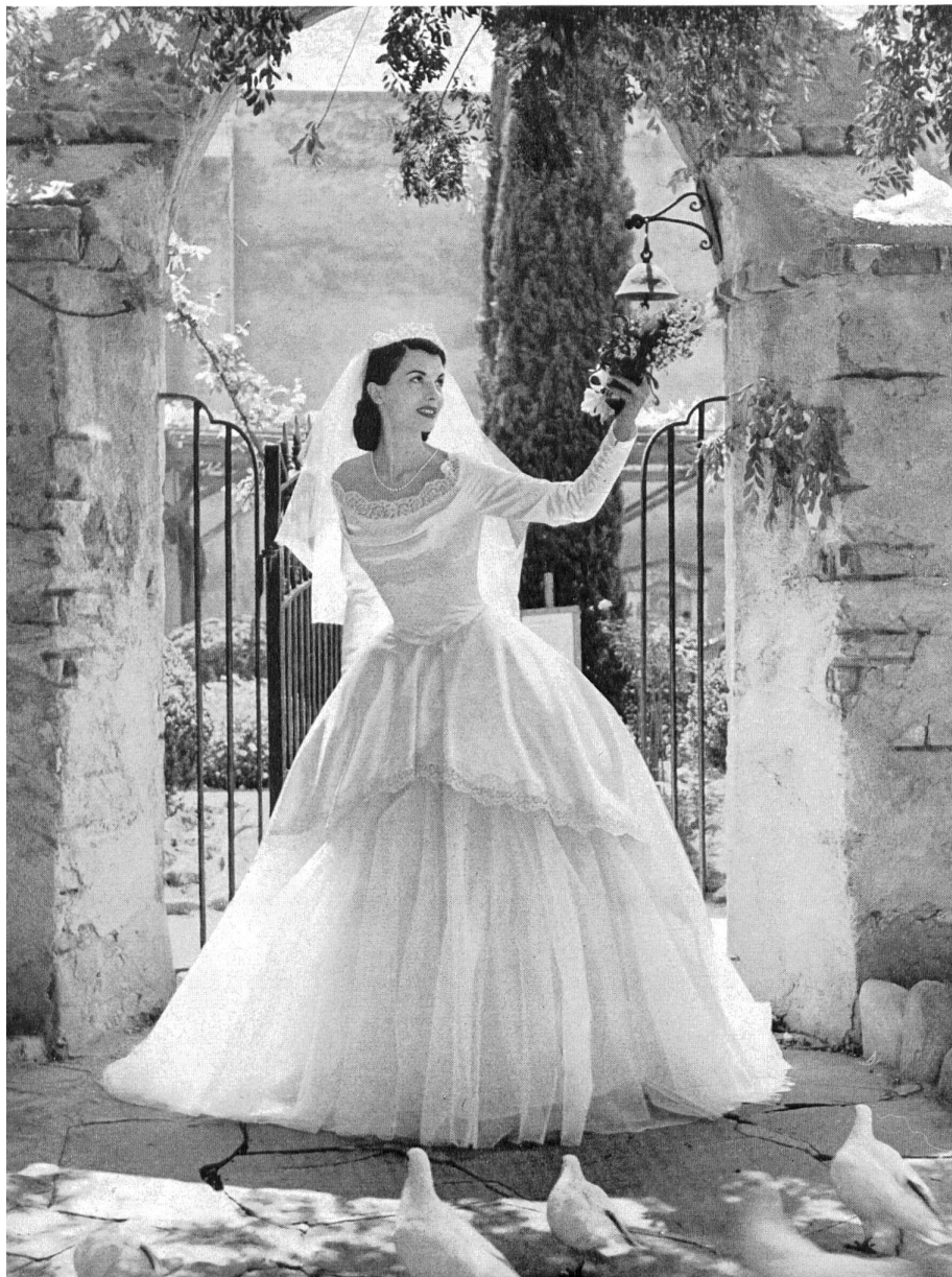
All models are from CAHILL LTD., LOS ANGELES