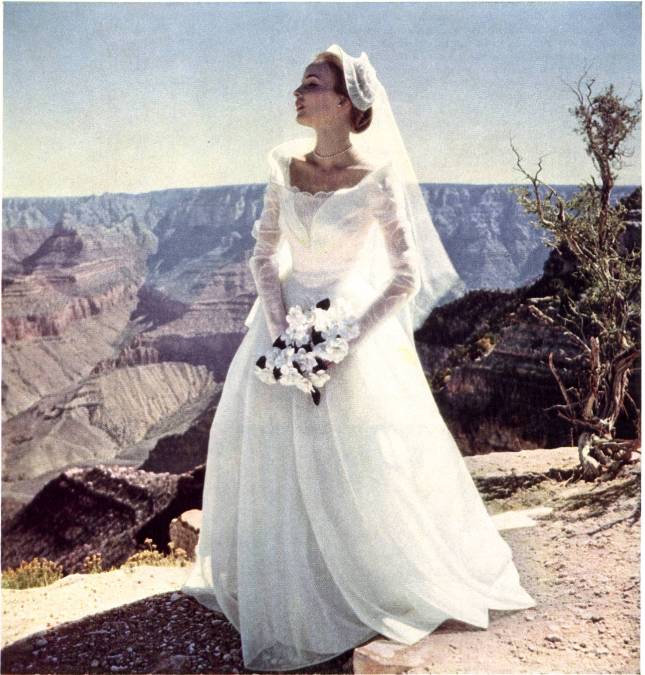
Bridal gown. White sheer cotton fabric by Stoffel & Co., St-Gall.

poder comprar siempre todo aquello que le parece nuevo, original o muy deseable respecto a los artículos suizos, a pesar de que sus programas de compras y sus presupuestos para los artículos americanos sean sumamente estrictos.