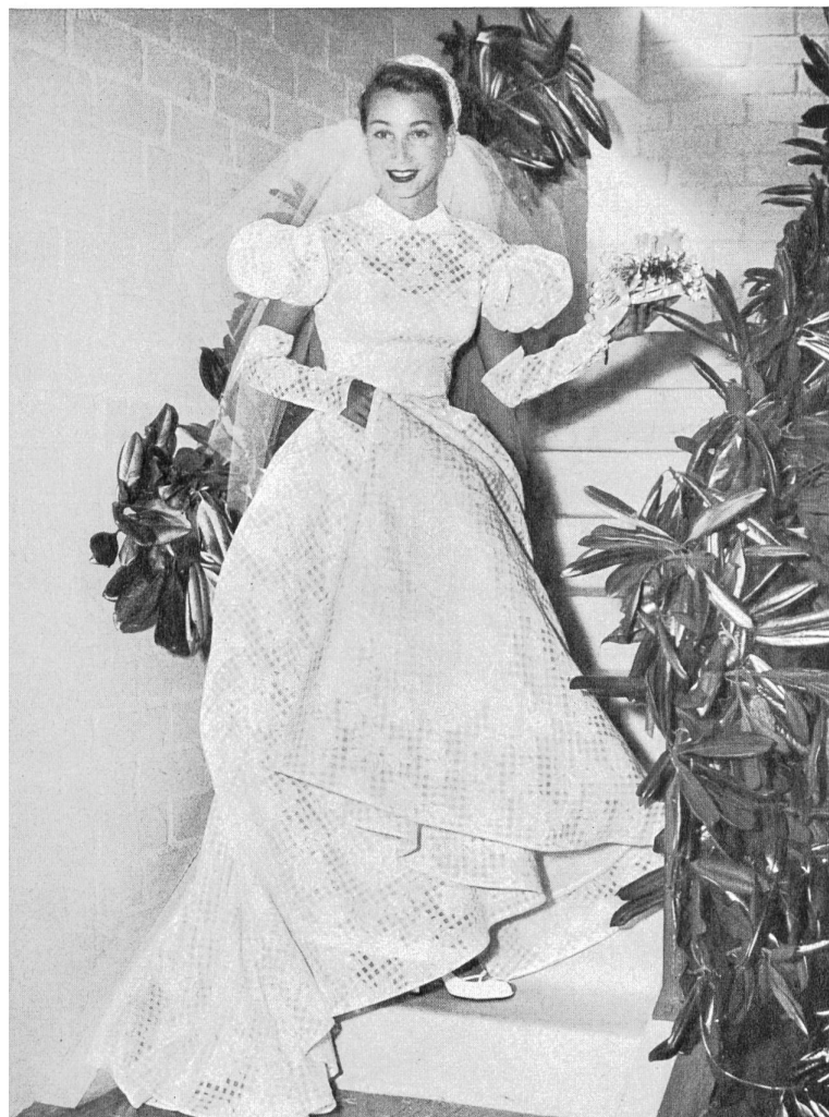
Bridal gown. Fabric by

Un aspecto muy original de los métodos comerciales de la casa Cahill Ltd. consiste en que se las apaña para