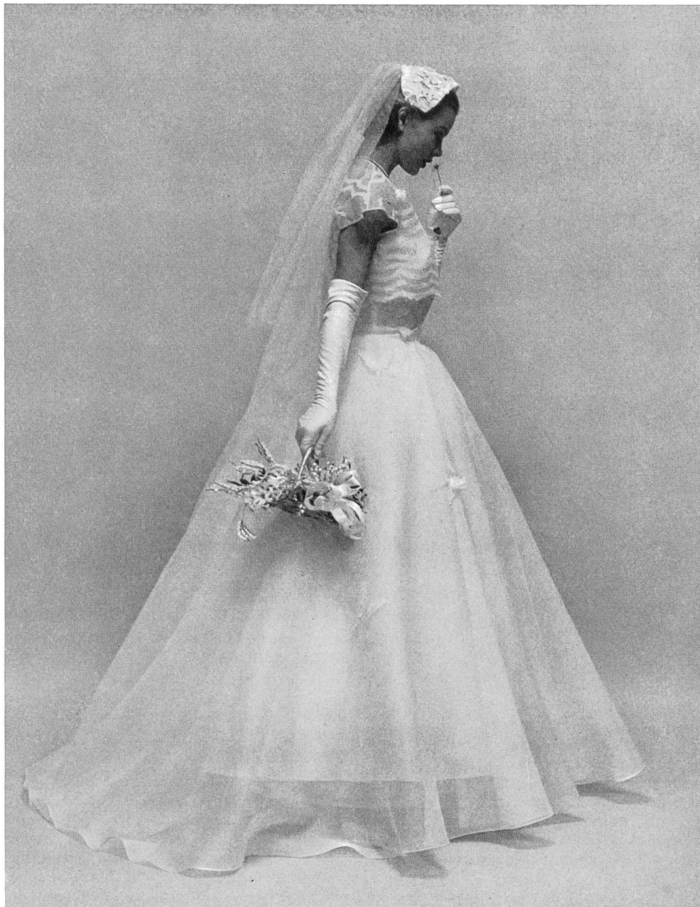
Bridal gown. Embroidered organdy appliquéd on organdy by Jacob Rohner Ltd., Rebstein.