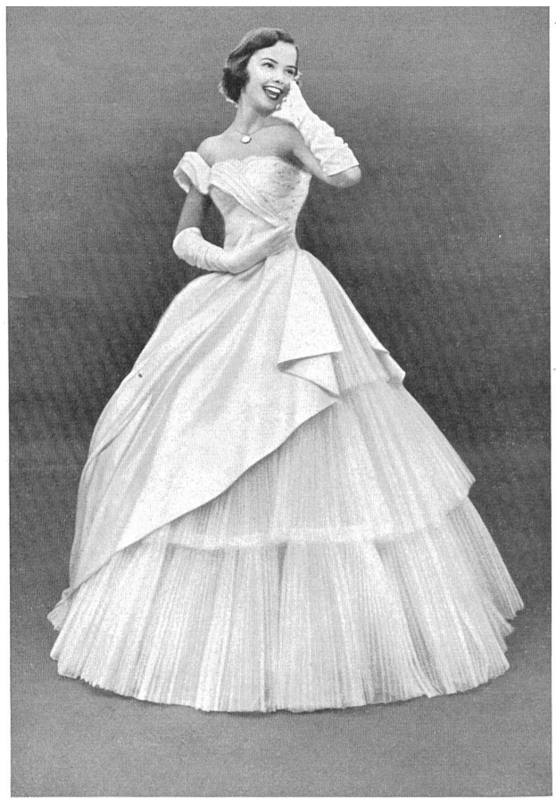
Evening dress in pleated tulle by Swiss Net Company Ltd., Münchwilen.