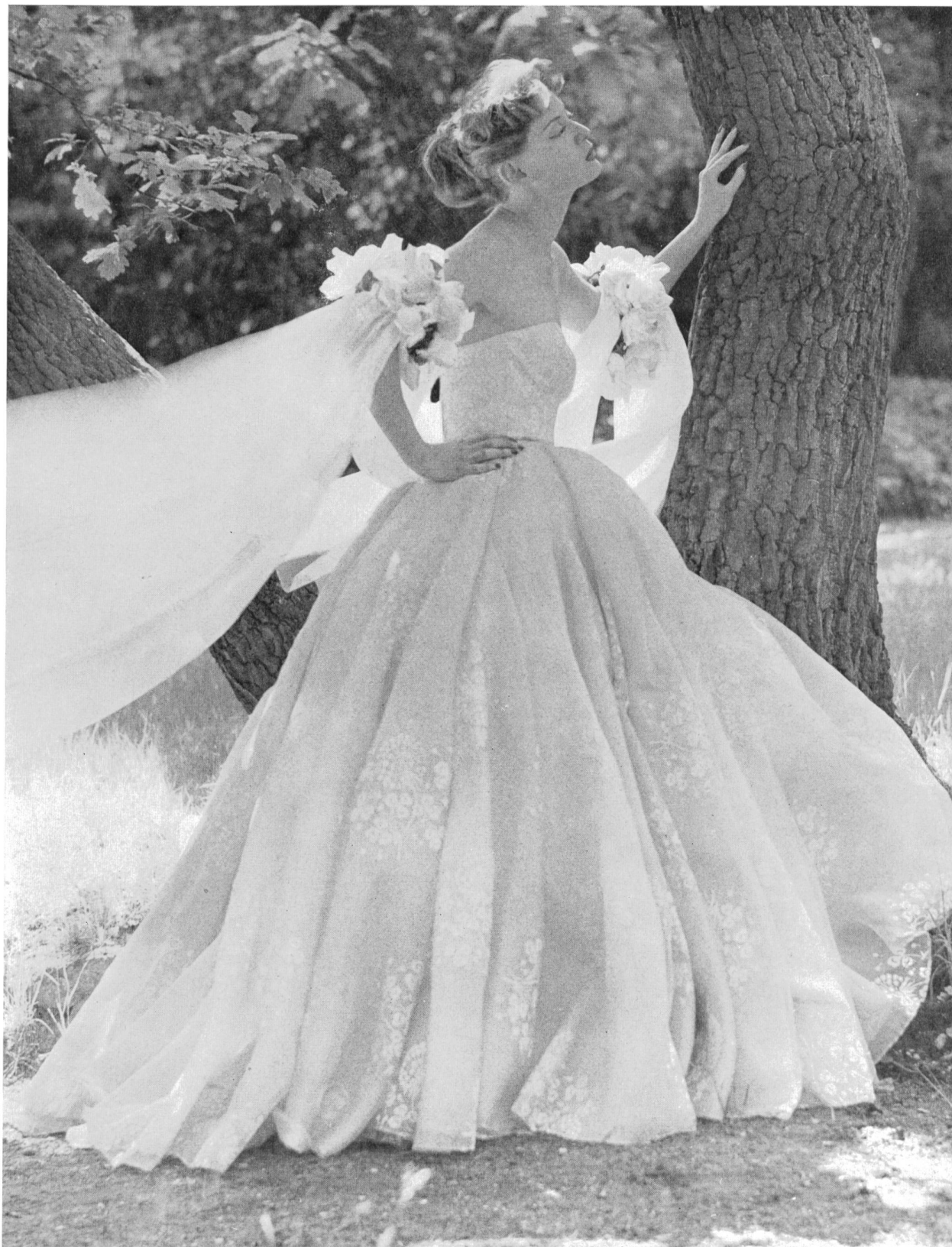
SERGE KOGAN Tissu « Flockprint » de Union S. A., St-Gall ; grossiste à Paris : Pierre Brivet S. à r. l.

Nous pensons intéresser nos lecteurs de l'hémisphère austral en reproduisant ici quelques modèles de collections de cette année précédant celle de l'hiver 1953-1954.