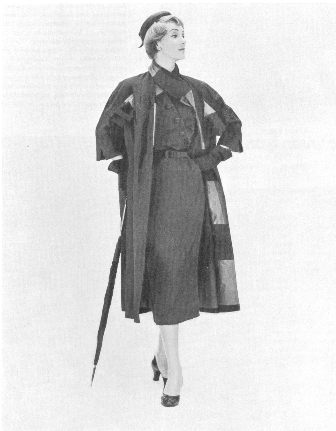
ELISABETH ARDEN Ensemble of black silk faille française by Schwarzenbach Huber Co., New York, fabric manu- factured by Robt Schwar- zenbach & Co., Thalwil.

El algodón ha llegado a ser una fibra más universal que nunca debido a los nuevos acabados y aprestos y a su mezcla con fibras sintéticas. Los tejidos de algodón se fabrican de todas las clases y calidades que van desde el traje hechura sastre hasta los más vaporosos vestidos para de noche. A cada instante se tropieza uno con una textura, un dibujo interesante o que se sale de lo ya visto. El reino de la competencia, el número de las importaciones multi-