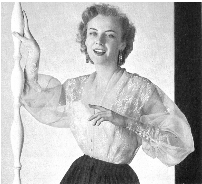
MAGGY ROUFF Les blouses en broderies de St-Gall.