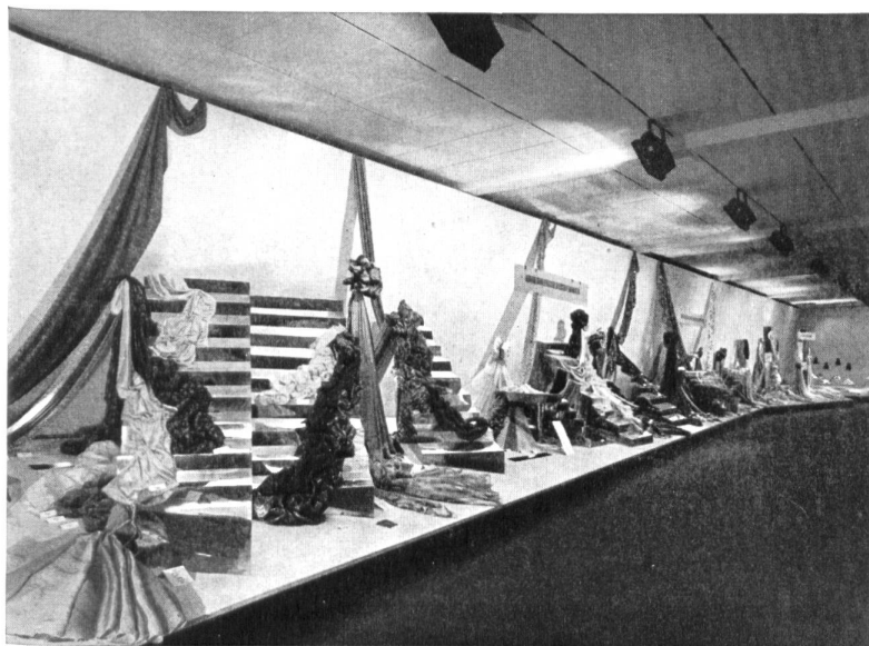
Sederfás de Zurich.

Esto es tan sólo un resumen muy sucinto de las novedades que se podrán ver, entre muchos otros artículos interesantísimos, en el grupo textil de la Feria de Muestras Suiza de Basilea, entre el 11 y el 21 de abril de 1953.