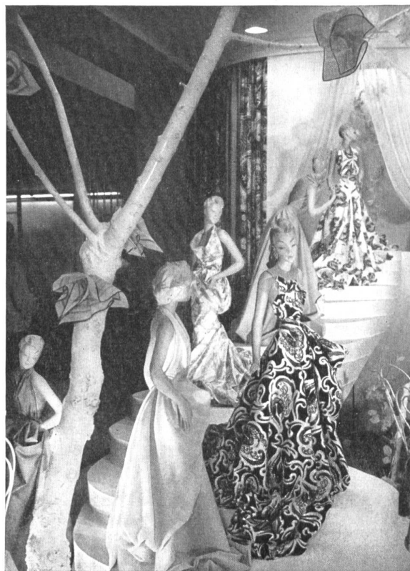
Bordados y tejidos finos de San Gallo.