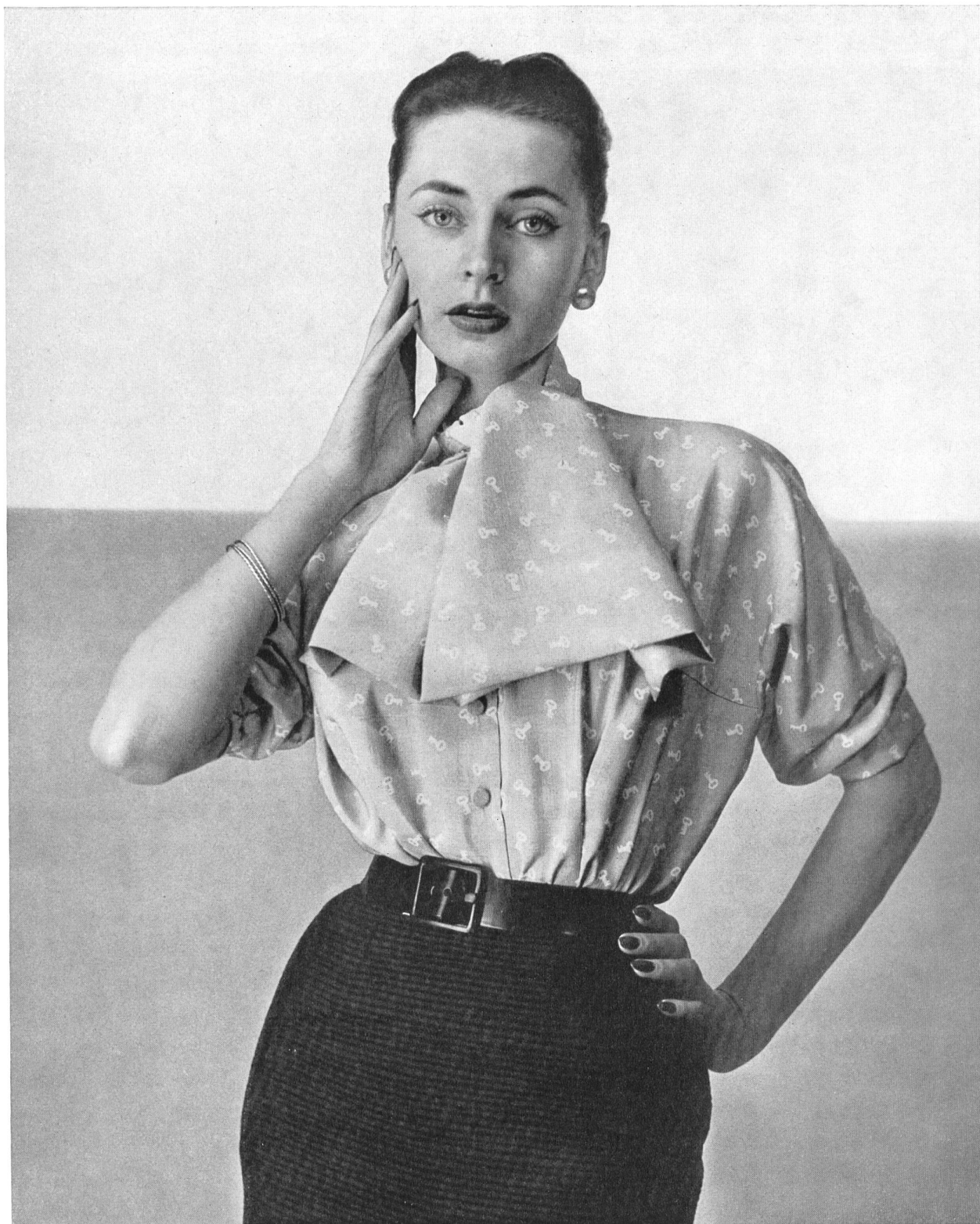
CHRISTIAN DIOR Honan imprimé de Rudolf Brauchbar & Cie, Zurich.