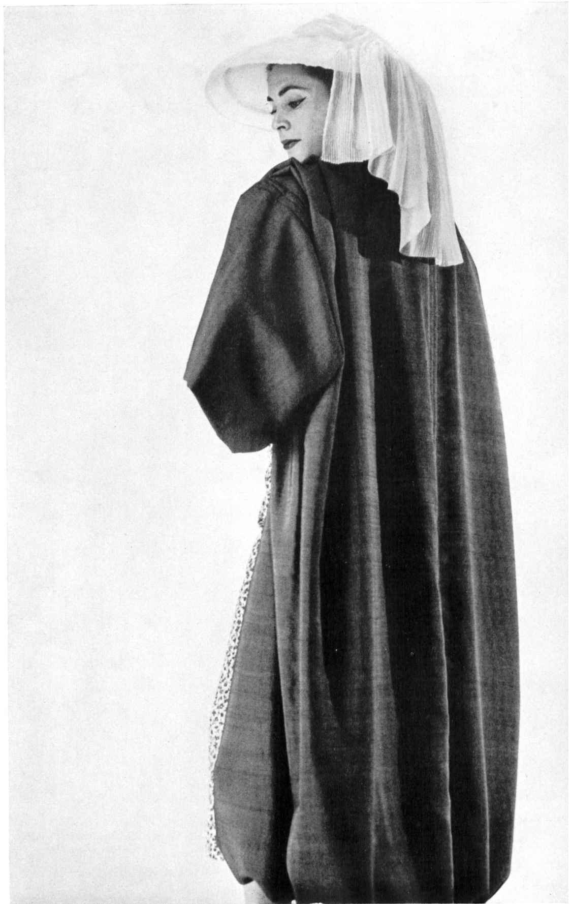
CHRISTIAN DIOR Honan couleur de Rudolf Brauchbar & Cie, Zurich.