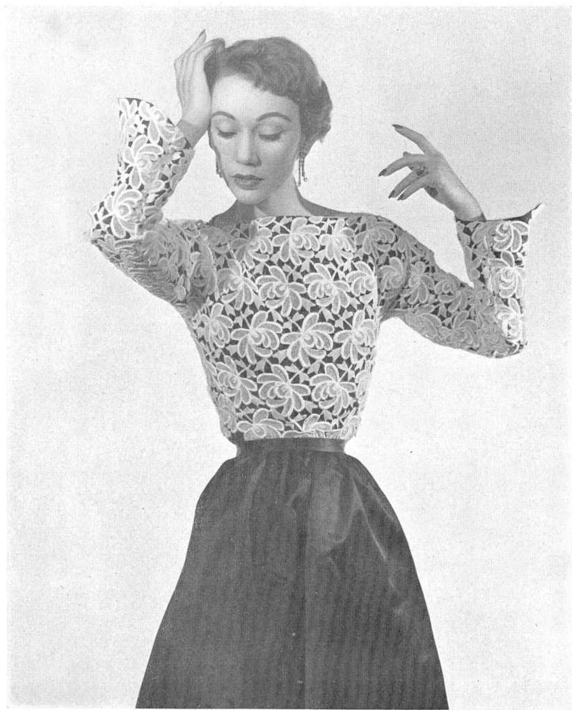
JACQUES HEIM Guipure d' Union S. A., Saint-Gall ; grossiste à Paris : Chatillon, Mouly, Roussel S.A.