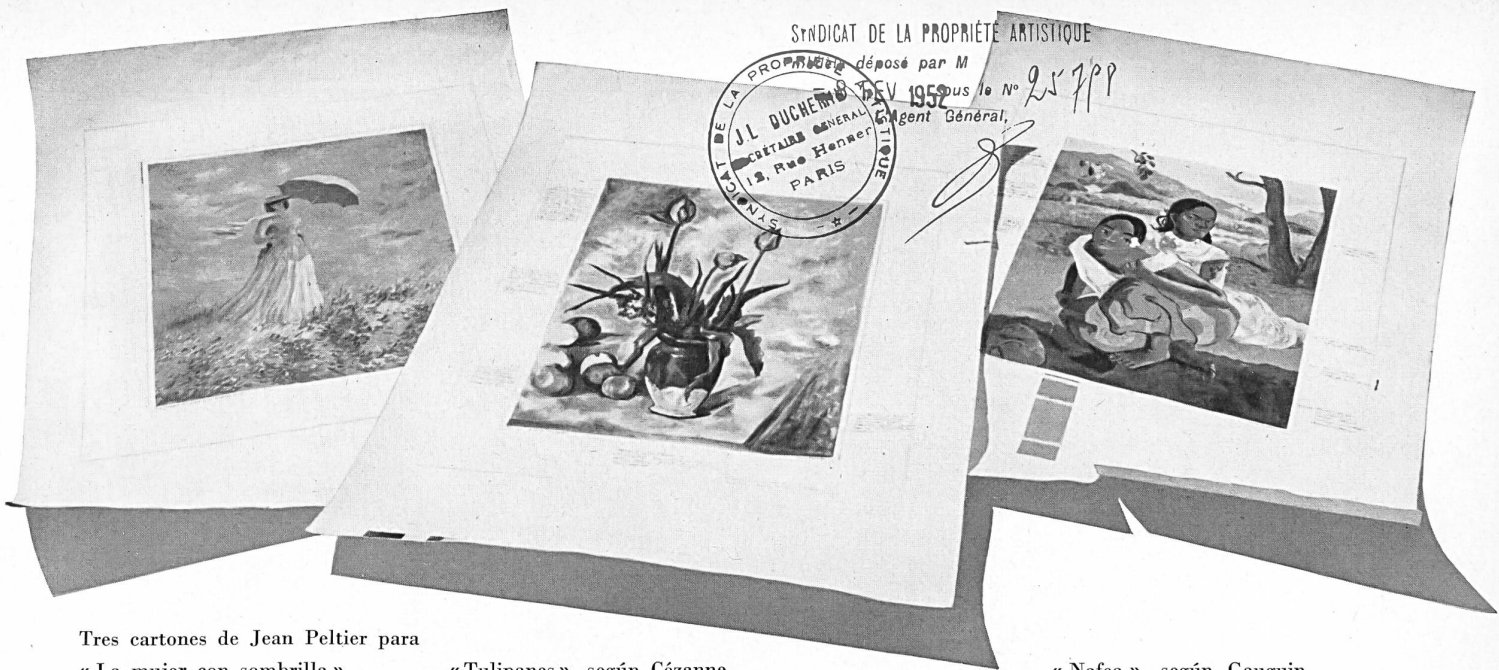
Tres cartones de Jean Peltier para « La mujer con sombrilla » según Monet