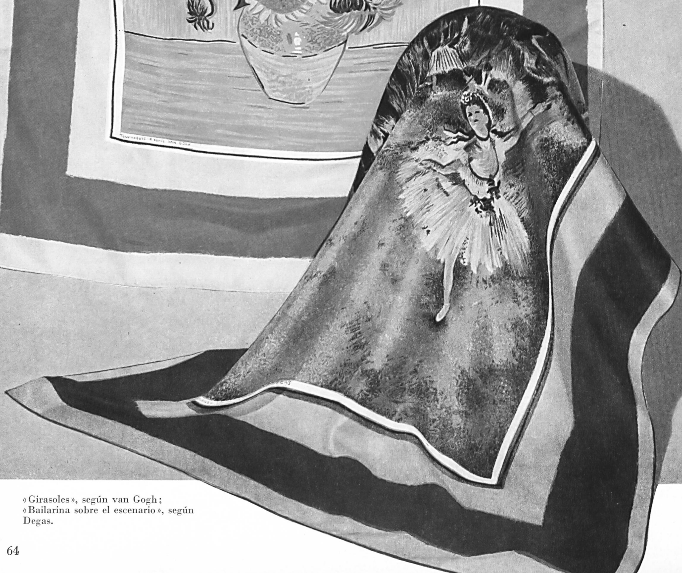
«Girasoles», según van Gogh; «Bailarina sobre el escenario», según Degas.