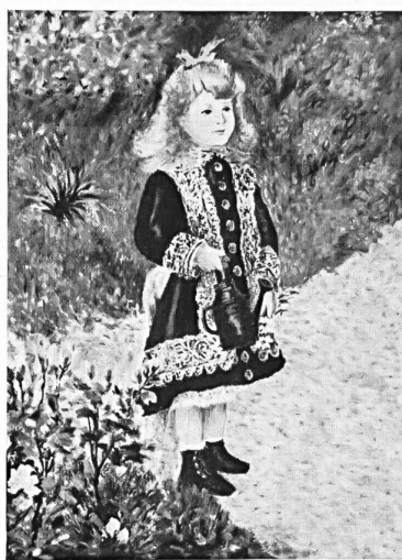
« La niña de la regadera » según Renoir