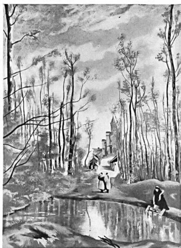
« Recuerdo de Marissel » según Corot

necesarias y los derechos de exclusividad, ponerse en regla con los organismos de defensa de la propiedad artística ya que algunas de estas obras están todavía protegidas legalmente y los herederos de los autores cobran derechos sobre la venta de estos pañuelos. Solo entonces, el artista parisiense Jean Peletier pudo poner manos a la obra, copiando exactamente los ocho lienzos en los museos sin perder de vista que sólo se podía utilizar una gama restringida de colores que permitiese la estampación sobre tejido utilizando tan sólo dieciséis colores. No hemos de insistir sobre las dificultades técnicas, sobre la minucia del trabajo necesario para la preparación de los dieciséis estarcidos y de los colores, sobre el esmero que hay que dedicar para la estampación. Cada obra conserva sus colores originales — que sólo fueron simplificados en la forma que acabamos de decir — pero habiéndose previsto matices diferentes para el marco. Lo mismo si agradan como si no agradan los asuntos escogidos y que se considere o no oportuno el verlos reproducidos en forma de pañuelos, no se puede por menos que inclinarse ante la probidad artística y la virtuosidad técnica de la ejecución. Nuestro único objeto es el de reseñar el éxito artístico, técnico y comercial de esta tentativa al dedicarla las presentes líneas.