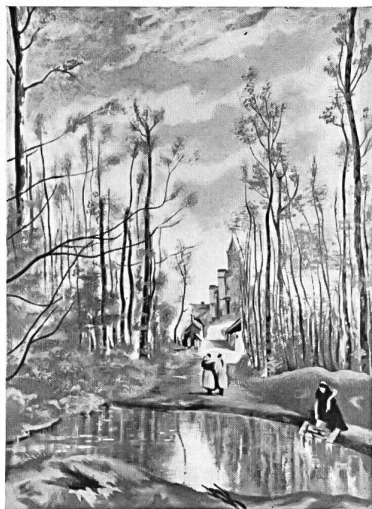
« Recuerdo de Marissel » según Corot