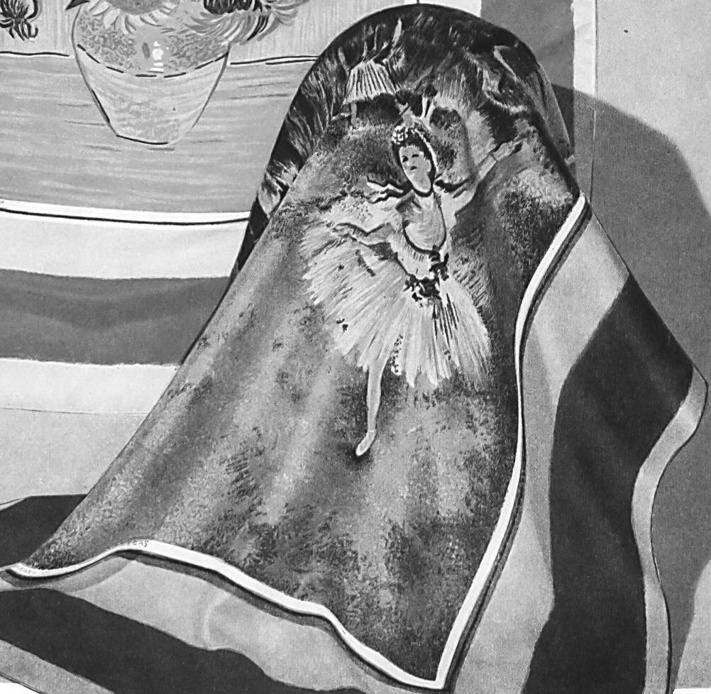
«Girasoles», según van Gogh; «Bailarina sobre el escenario», según Degas.