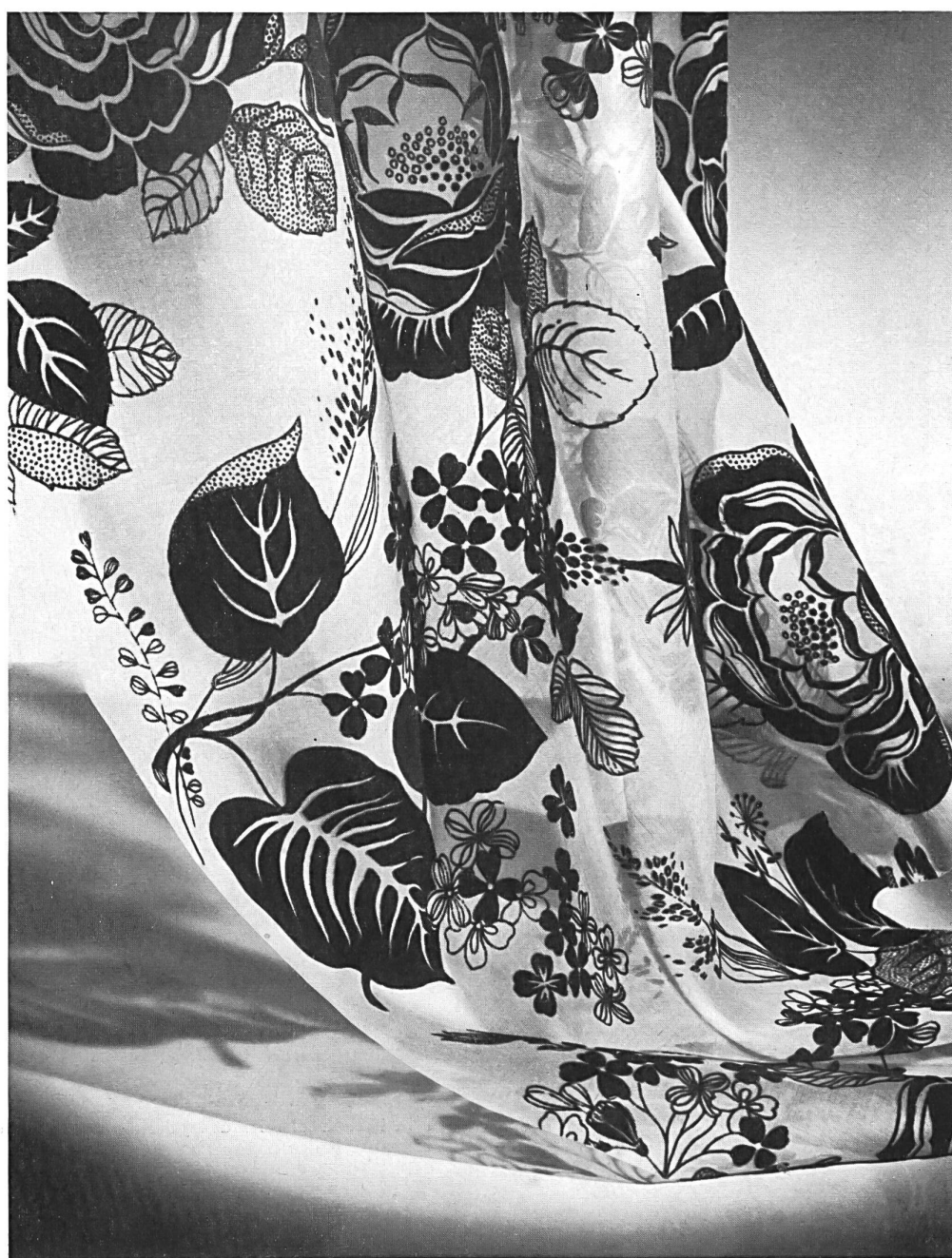
J. G. Nef & Cia., Herisau « Neloflock » estampado « flock » sobre organdí. Efecto aterciopelado en negro o blanco sobre fondo de color en diez matices, o blanco sobre blanco para vestidos de boda.

Ahora bien, no se trata de un efecto obtenido por tisaje, sino mediante el estampado. El sistema empleado para ello no tiene nada de complicado ni de secreto. Sobre el tejido se estampa el dibujo con cola y, luego, la parte encolada se recubre con