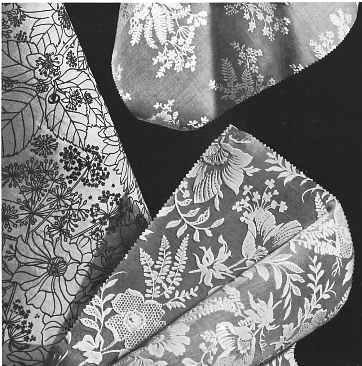
Hausammann & Cia., Winterthur Muestras de la colección « Flockprint » sobre fondos de organdí o de nylon.