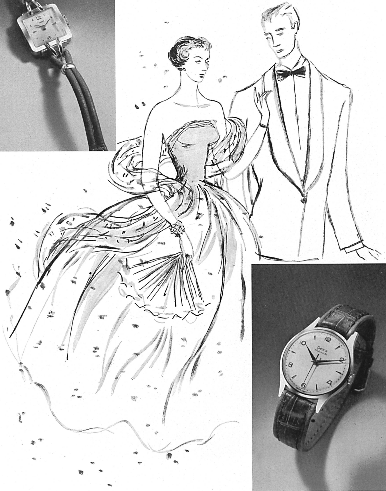
Manufacture des montres Doxa S. A., Le Locle. Montres — Watches — Relojes — Uhren