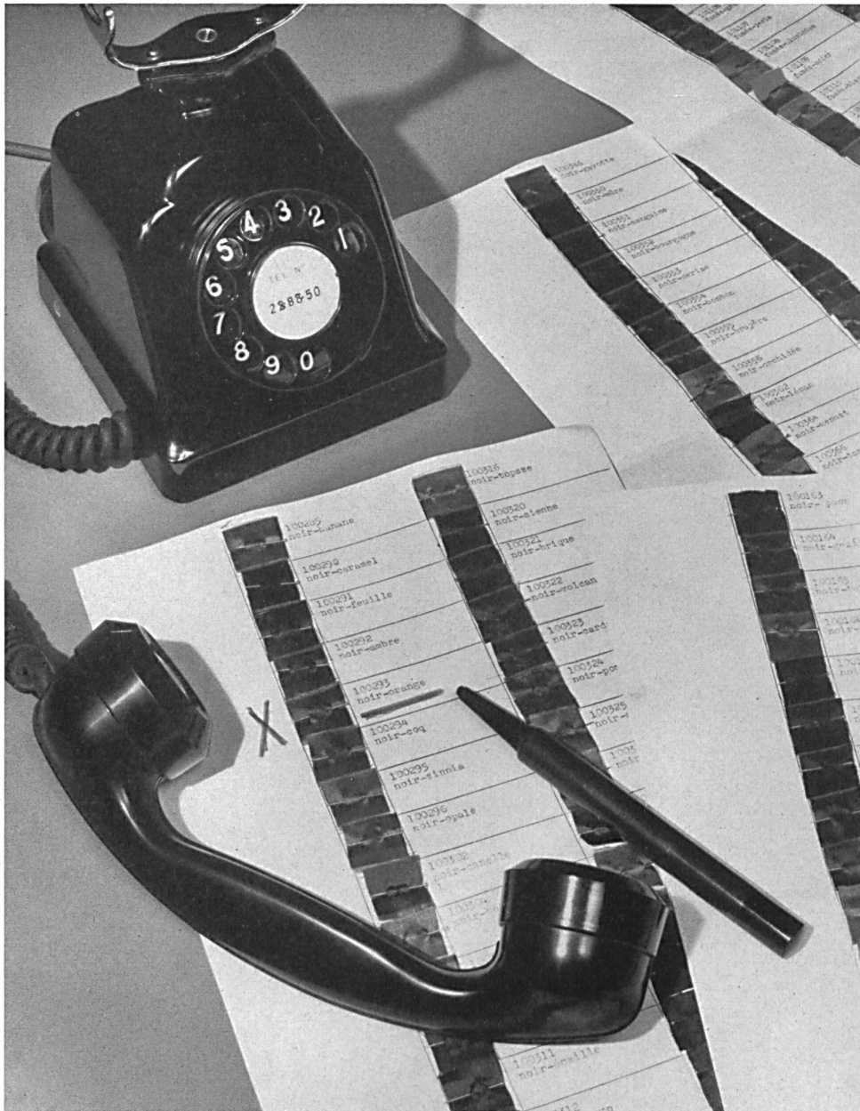
Studio Color, Zurich.