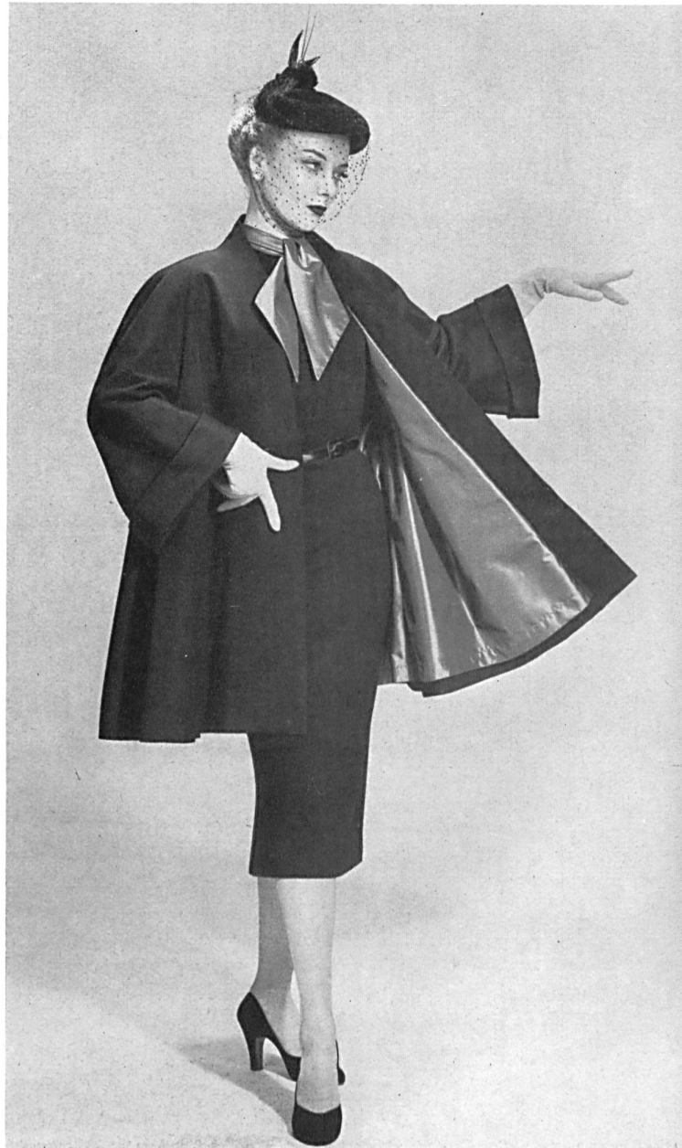
Ottoman lourd, teint en fil, de Heer & Cie S. A., Thalwil Confection : E. Braunschweig & Cie S. A., Zurich.