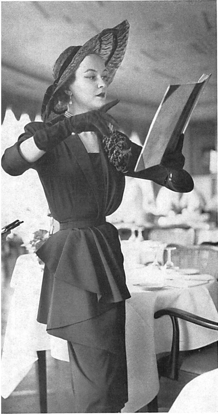
Faille pure soie de Heer & Cie S. A., Thalwil Confection : Algo S. A., Zurich.