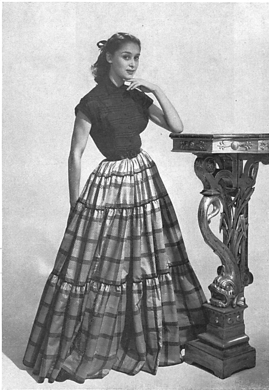
Tejidos fantasía de algodón Nelo, tan alabados en Tailandia como en Europa, de J. G. Nef y Cie, Herisau. Modelo BALMAIN.

Por cierto que es gran lástima que los siameses hayan renunciado al uso de su vestido tradicional. El traje que usan las mujeres en las regiones apartadas del país, o las magníficas vestiduras que se ven en las representaciones teatrales, como reminiscencias de una fastuosidad pretérita, permiten que los extranjeros se den plenamente cuenta del esplendor del traje siamés, y no cabe la menor duda de que, en la época evocada en el libro Ana y el Rey de Siam , el aspecto de una asamblea había de presentar un magnífico golpe de vista. Todavía es hoy posible ver a veces un alto dignatario o una gran dama revestidos de los atributos y adornos tradicionales, pero éstas son visiones que pertenecen más bien a los tiempos pasados.