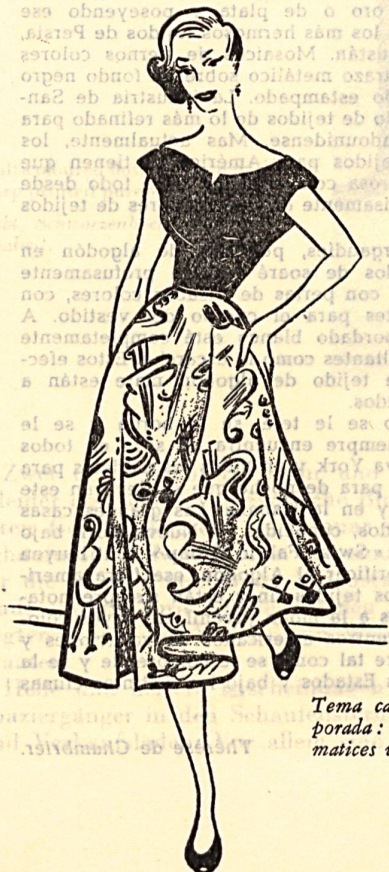
Tema característico para esta temporada: talles negros y faldas de matices vivos sobre fondo claro.

Actualmente — al ser menos apretadas que anteriormente las trabas a la importación — Suiza sabrá a su vez aportar a este mercado, no lo dudamos, esa nota que siempre le ha procurado su prestigio en los textiles, gracias al valor artístico y técnico de sus realizaciones. Fred Schlatter.