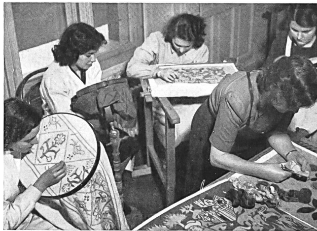
La clase de bordado artístico.

Es fácil aprender la técnica de un ramo y la base artesanal de un oficio para ganarse con ello el pan de cada día. Pero la moda se modifica continuamente, la evolución de los negocios reclama nuevas ideas para los dibujos de las telas y de las hechuras; son imprescindibles ideas artísticas. ¿Puede aprenderse la inspiración? Ciertamente sí, siempre que, como base, se posean dones artísticos. Pero además es necesario un ejercicio constante de la vista y del gusto y que prosiga la enseñanza durante el trabajo práctico.