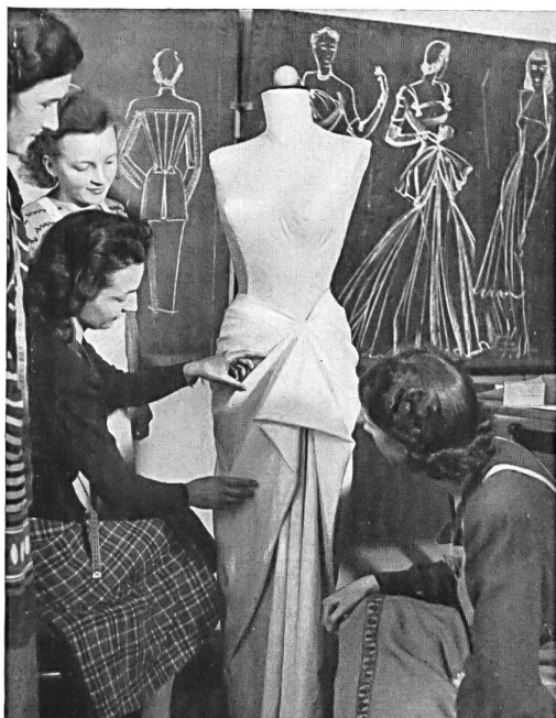
La clase de la moda.

Los tres puntos del programa: enseñanza, información, propaganda, delimitan el campo de las actuaciones a las que el instituto aporta su contribución práctica para el fomento industrial en Suiza.