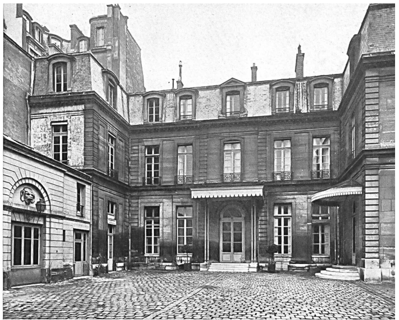
Legación de Suiza en París, patio de honor.

Añadase a esto, para completar estos datos, que los productos textiles constituyen, desde hace mucho ya, una parte considerable de los intercambios entre Francia y Suiza. Así, en 1938, las exportaciones totales de Suiza a Francia sumaron 121,4 millones de francos suizos, de los cuales, 13,7 eran de productos textiles ; y las importaciones suizas provenientes de Francia, de un total de 229,2 millones de francos suizos, entre los cuales, 38,1 se referían también a productos textiles. Lo mismo en 1948,