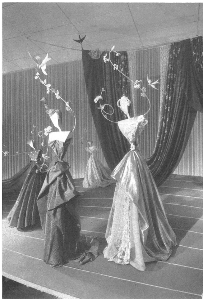
El grupo « Création » en 1950

Ya hoy, podemos dar como seguro que la participación textil en la Feria Suiza de 1951 figurará dignamente y no desmerecerá de las anteriores.