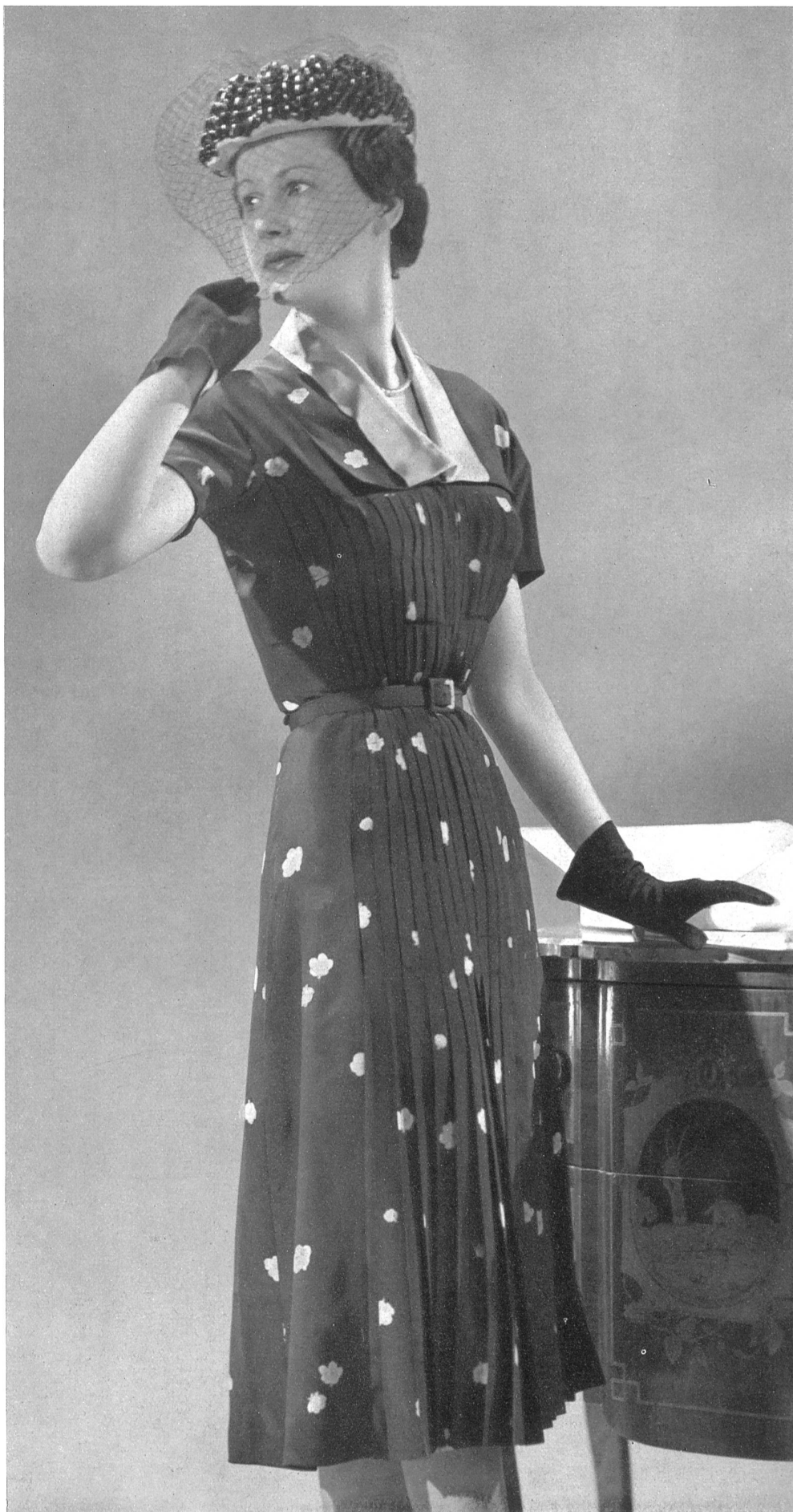
BRUYÈRE Rudolf Brauchbar & Cie, Zurich