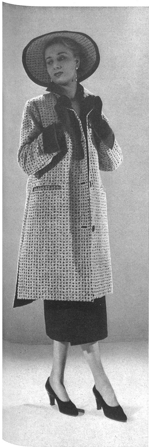
CHRISTIAN DIOR A. Naef & Cie, Flawil INAMO, ZURICH