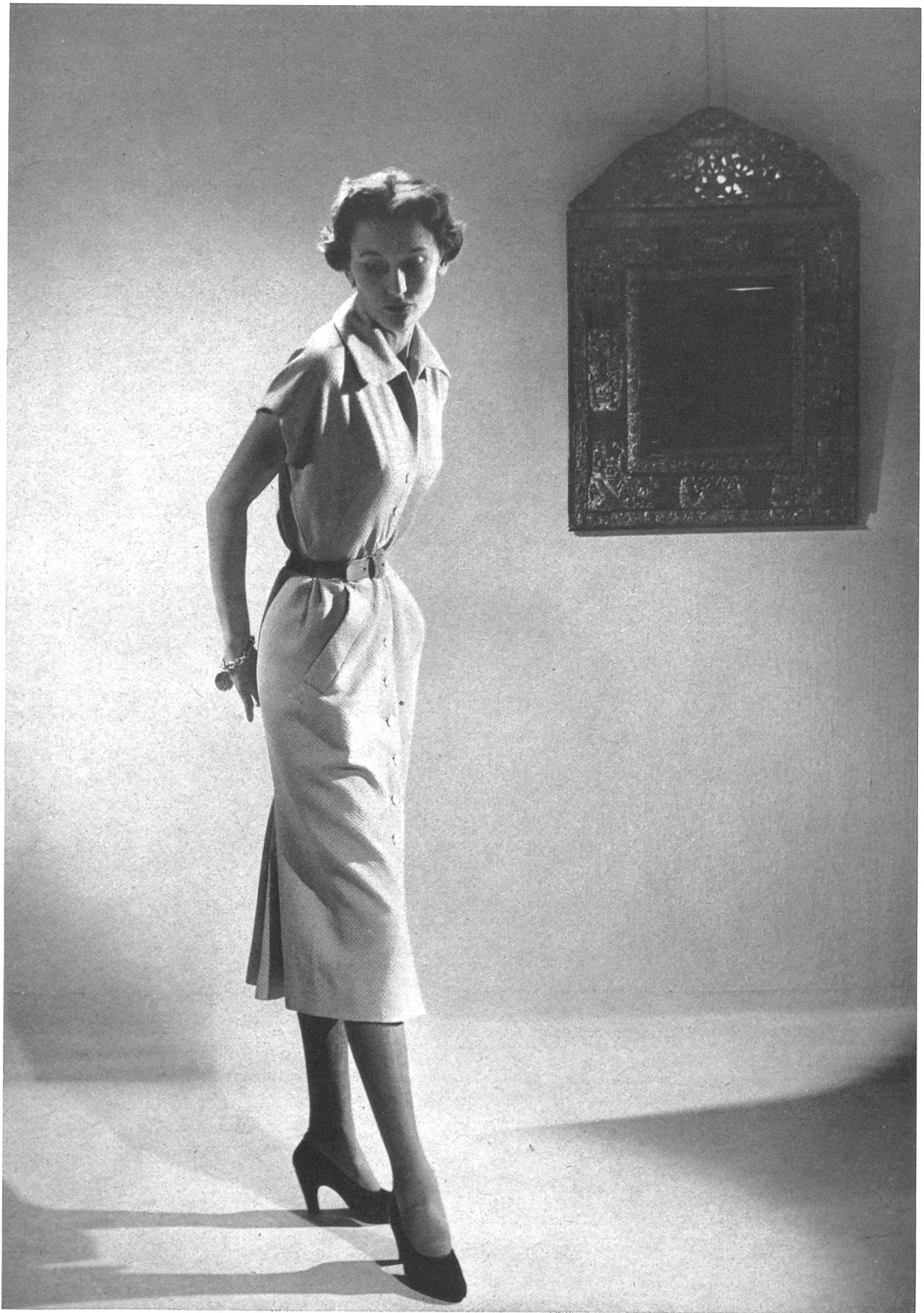
CHRISTIAN DIOR Stoffel & Cie, St-Gall INAMO, ZURICH