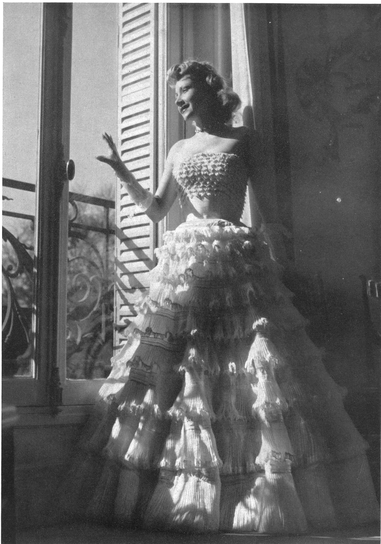
CARVEN Union S.A., St-Gall PIERRE BRIVET FILS, PARIS