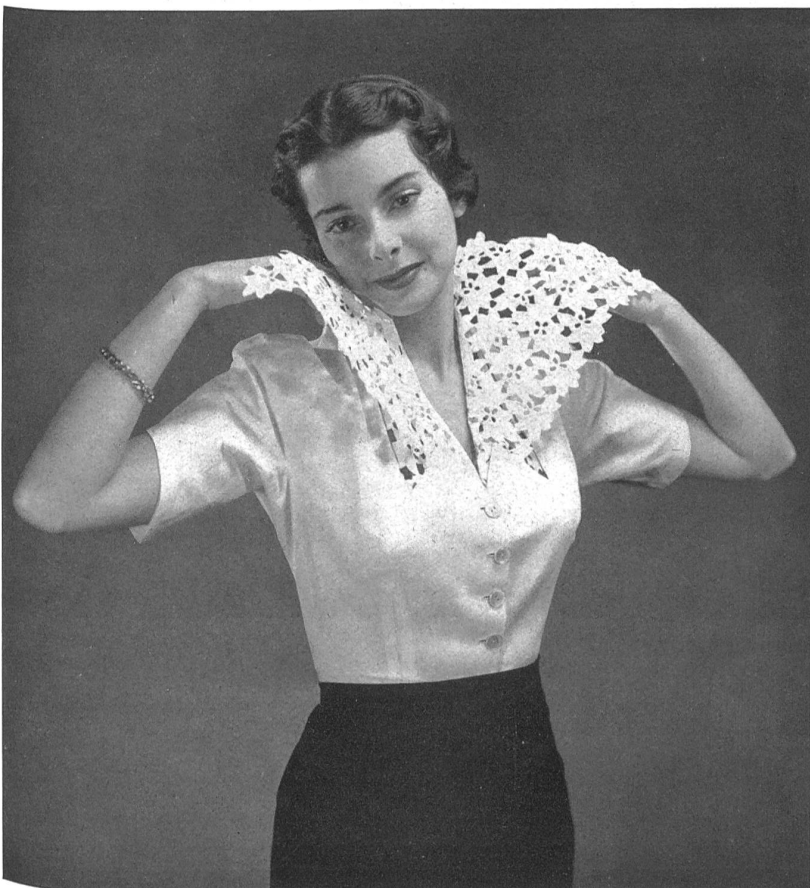
DENISE ET MAD A. Naef & Cie, Flawil PIERRE BRIVET FILS, PARIS