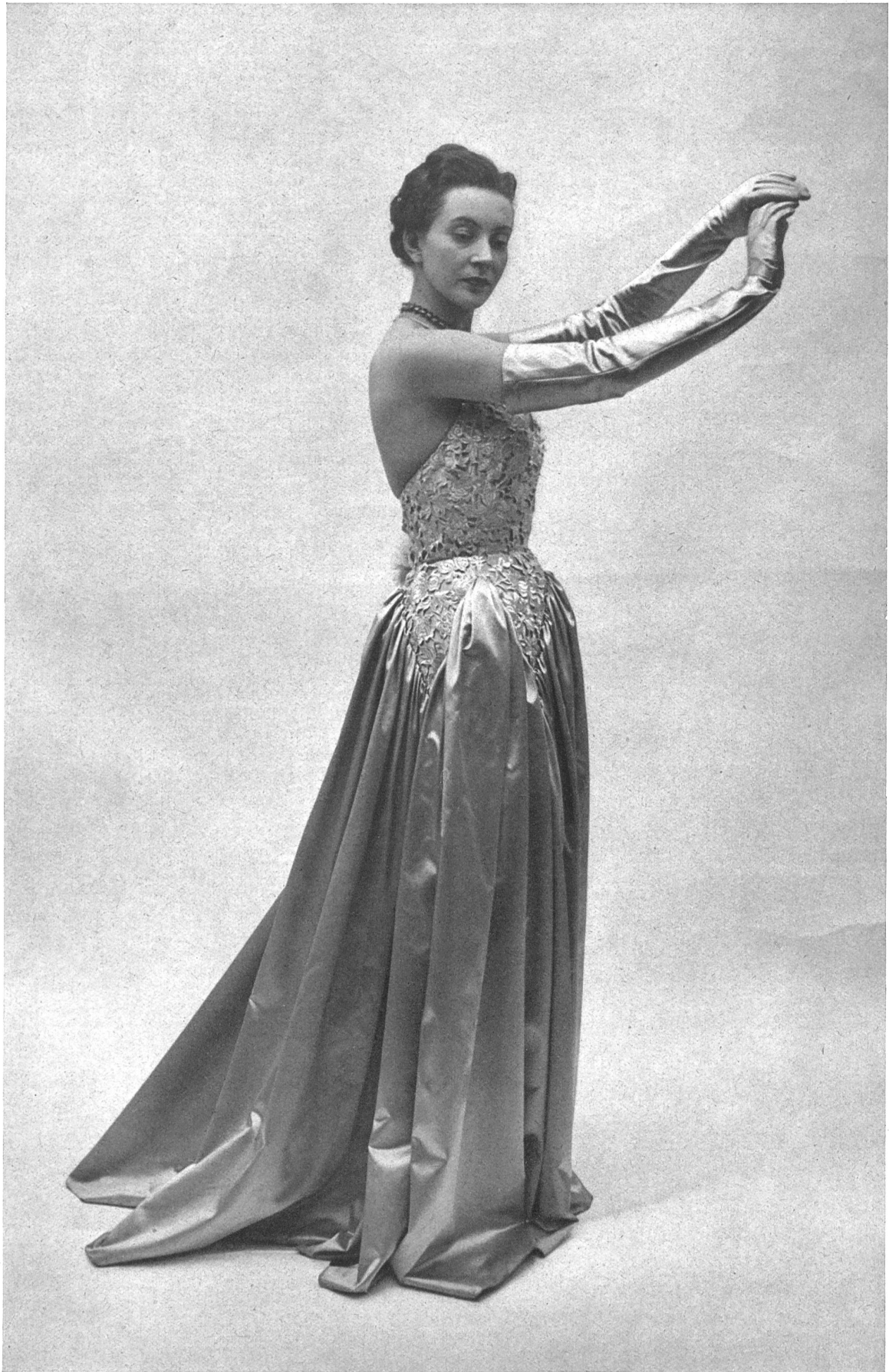
MOLYNEUX A. Naef & Cie, Flawil INÄMO, ZÜRICH