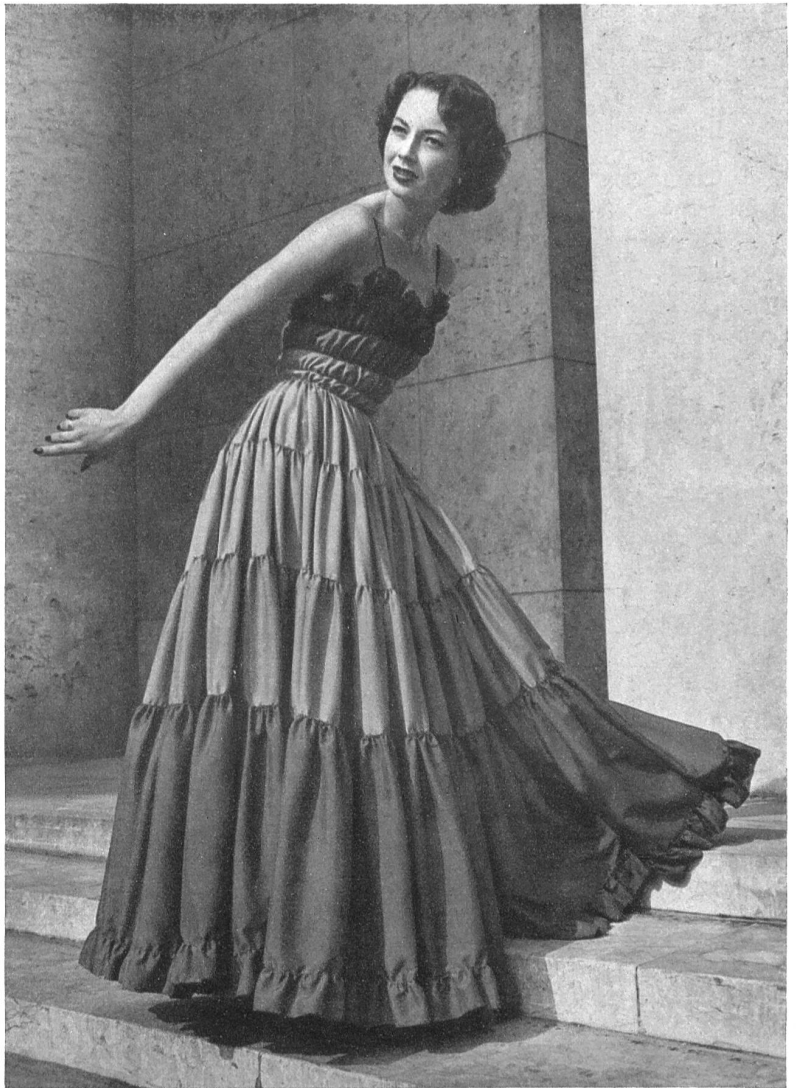
RAPHAEL Heer & Cie S.A., Thalwil INAMO, ZURICH