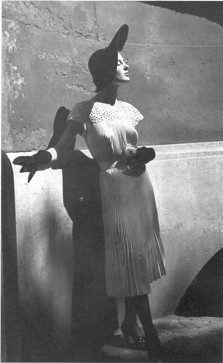
TRISTAN MAURICE Walter Schrank & Cie, St-Gall THIÉBAUT-ADAM, PARIS