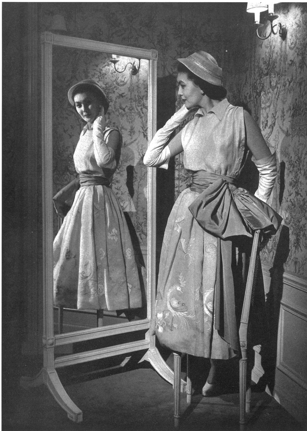
CHRISTIAN DIOR Forster Willi & Cie, St-Gall INAMO, ZURICH