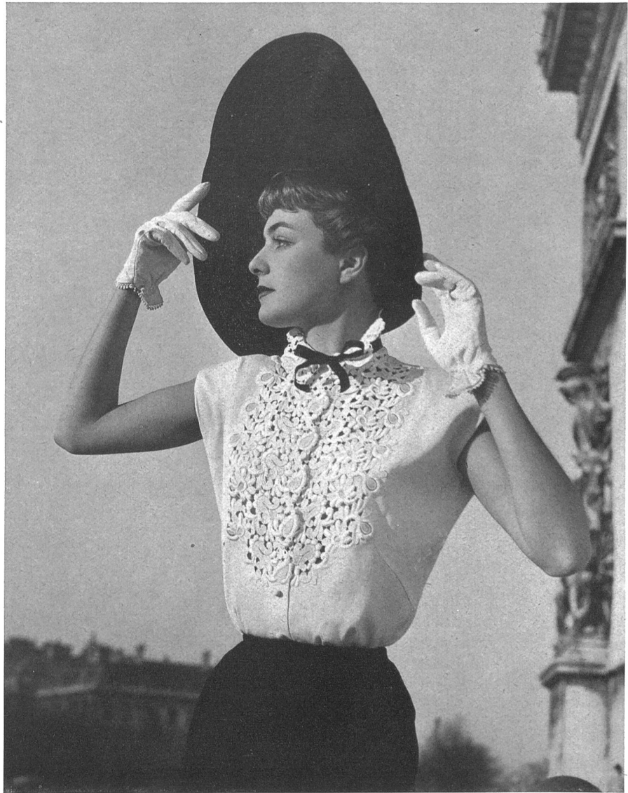
JACQUES FATH Walter Stark, St-Gall MONTEX, PARIS