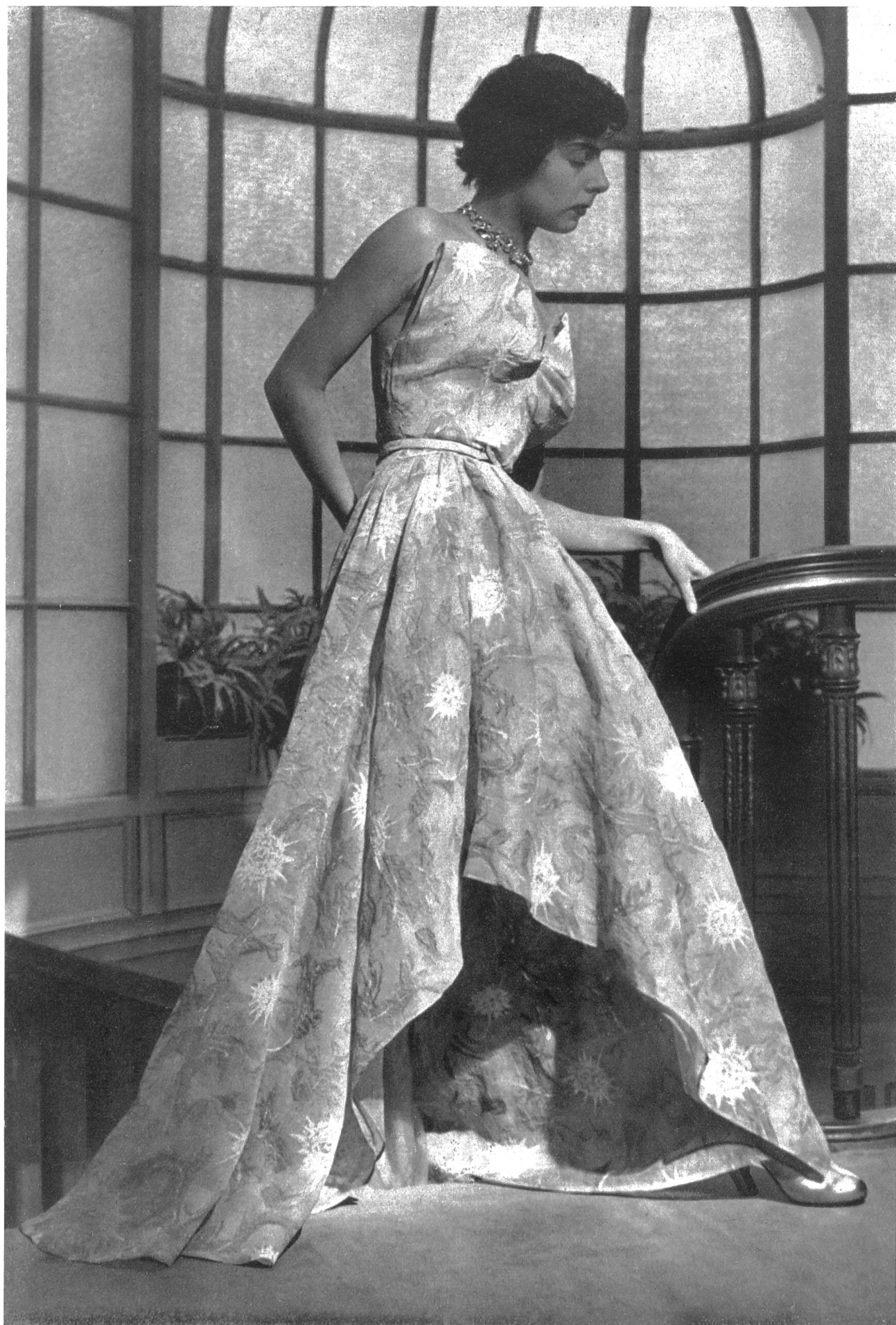
PAQUIN Emar S.A., Zurich INAMO, ZURICH