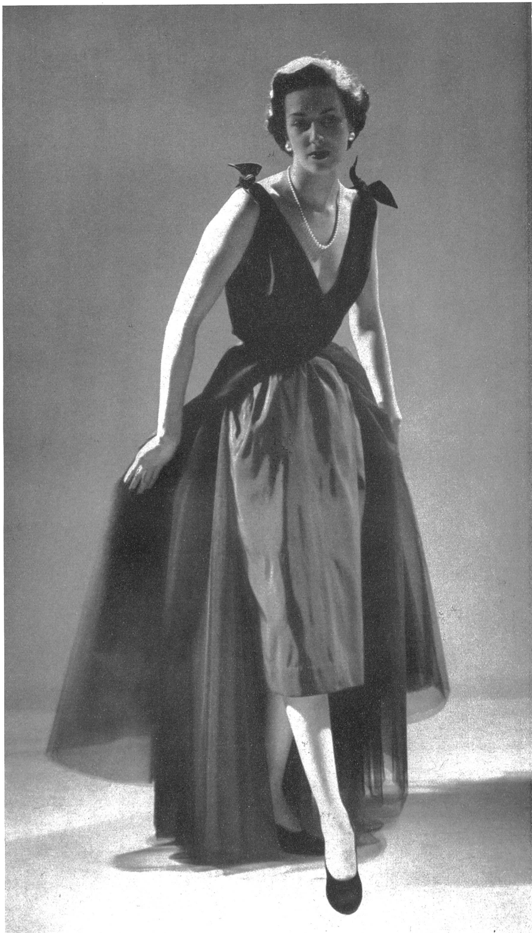
CHRISTIAN DIOR S. A. Stunzi Fils, Horgen