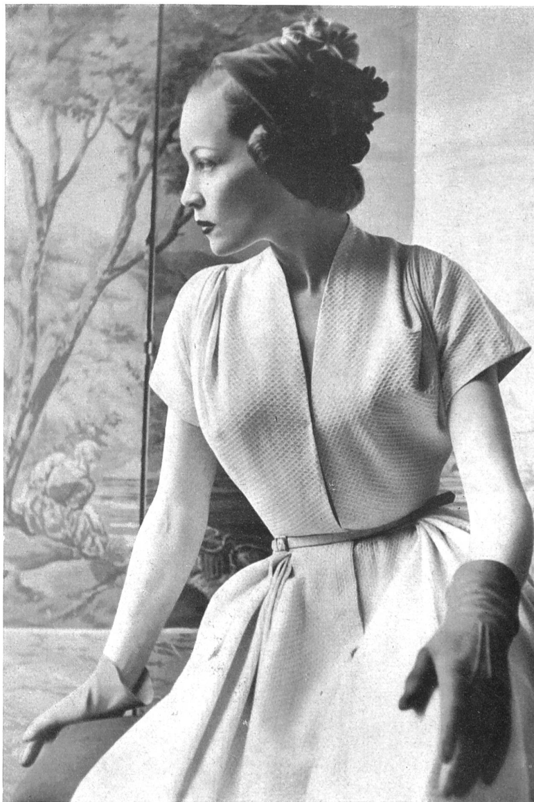
MANGUIN Stoffel & Cie, St-Gall INAMO, ZURICH