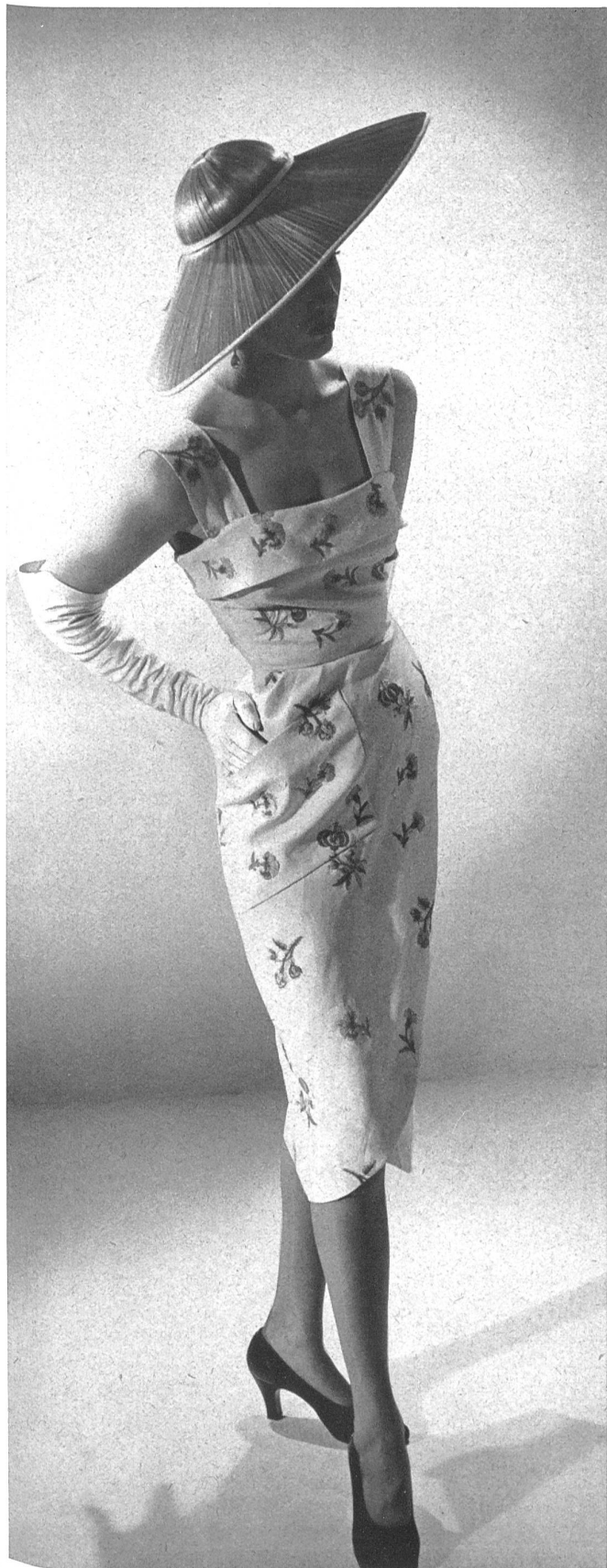
CHRISTIAN DIOR Forster Willi & Cie, St-Gall INAMO, ZURICH