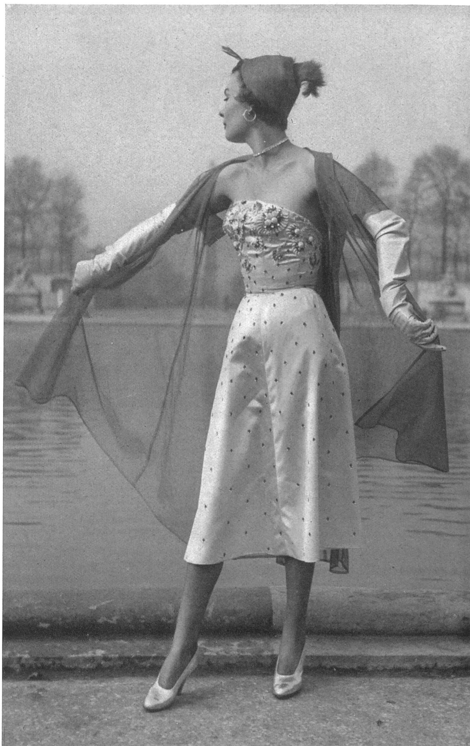
JACQUES FATH Union S.A., St-Gall PIERRE BRIVET FILS, PARIS