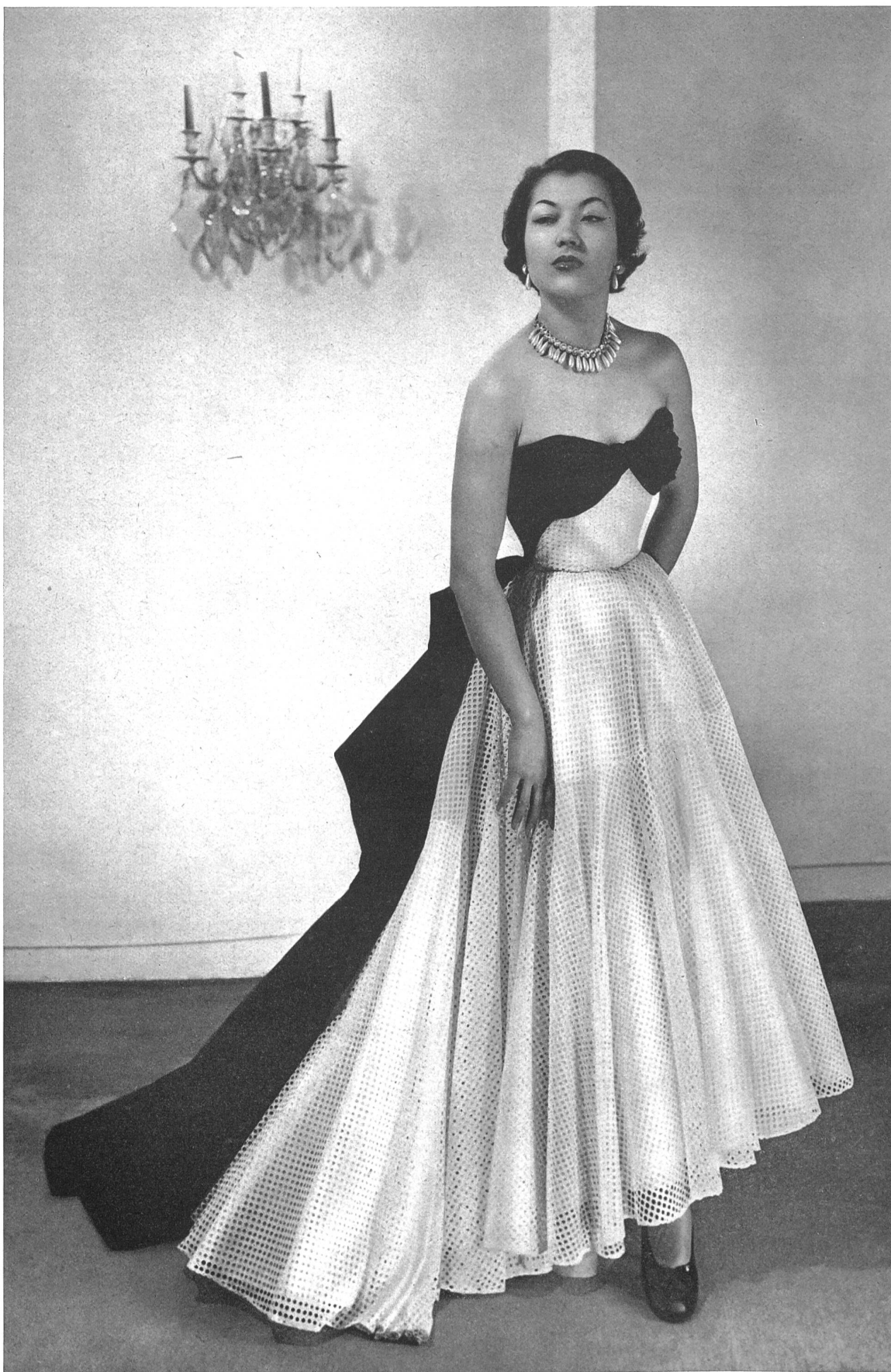
NINA RICCI J. G. Nef & Cie, Hérisau M. GUITRY, PARIS