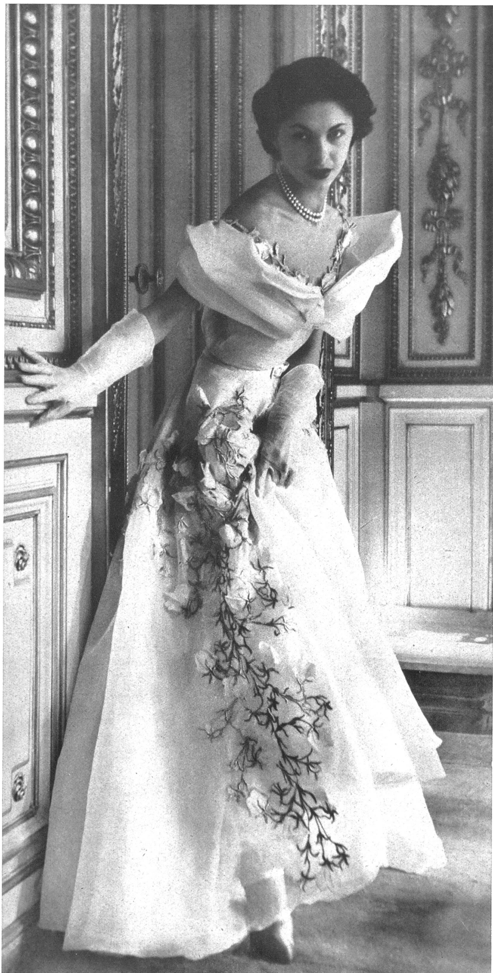
JEAN DESSÈS Forster Willi & Cie, St-Gall INAMO, ZURICH