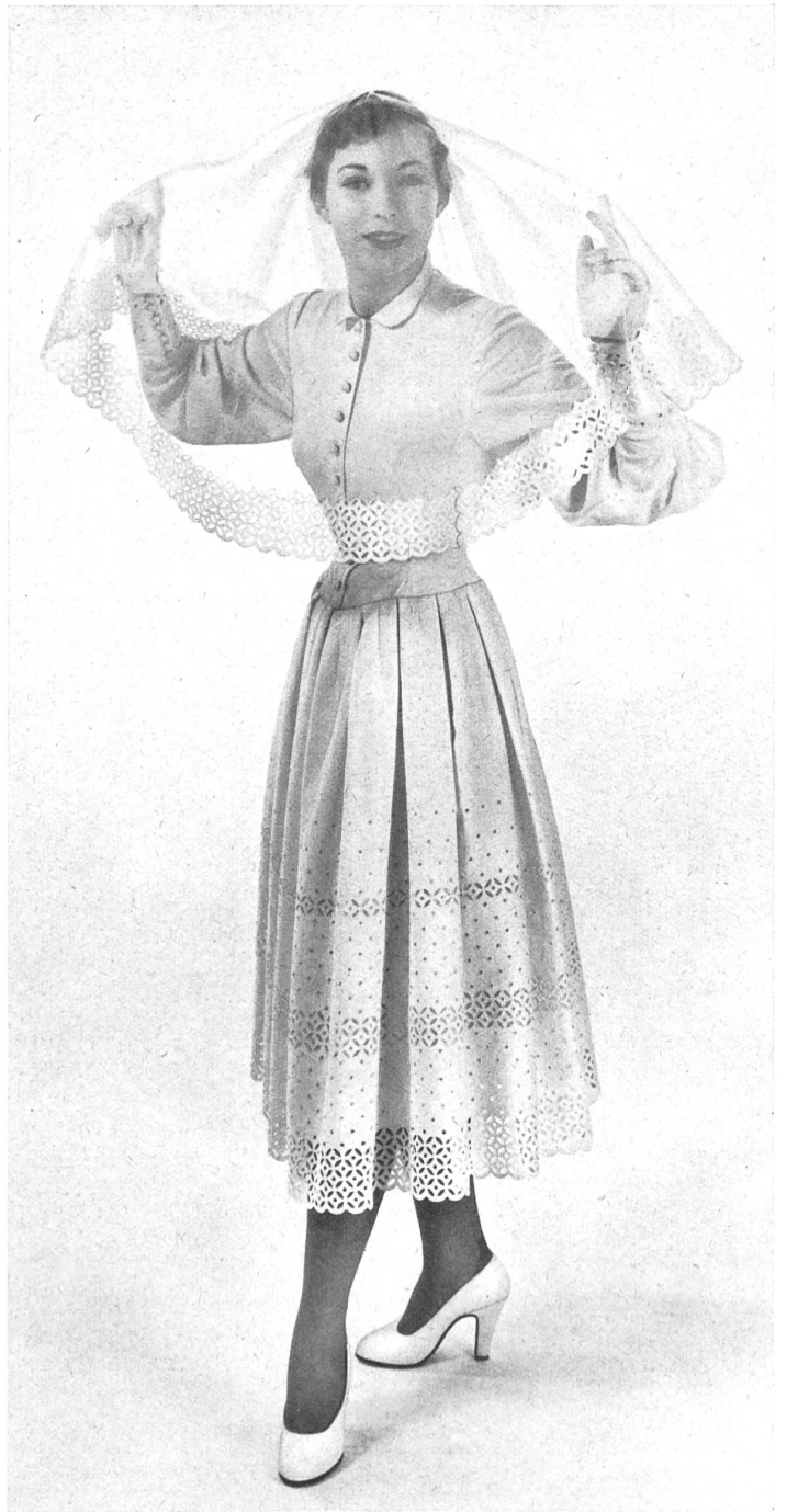
MARCEL ROCHAS Union S.A., St-Gall THIÉBAUT-ADAM, PARIS