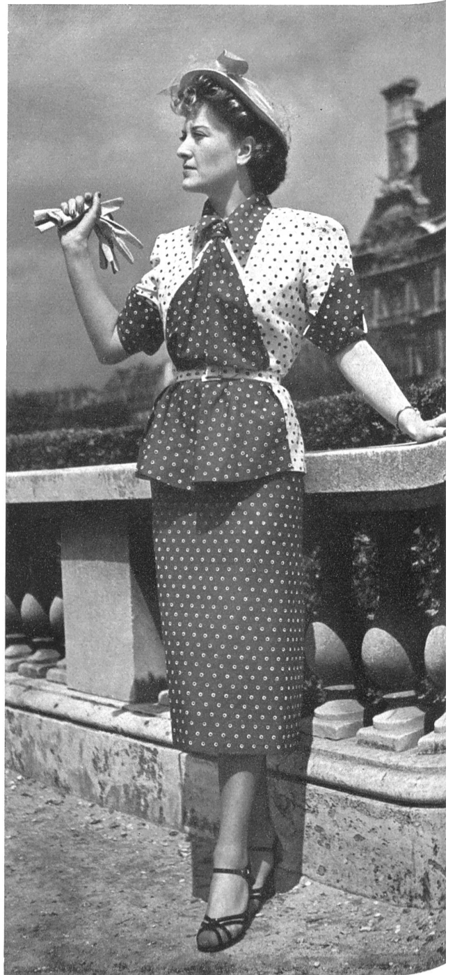
MARTIAL ET ARMAND Reichenbach & Co., St-Gall THIÉBAUT-ADAM, PARIS