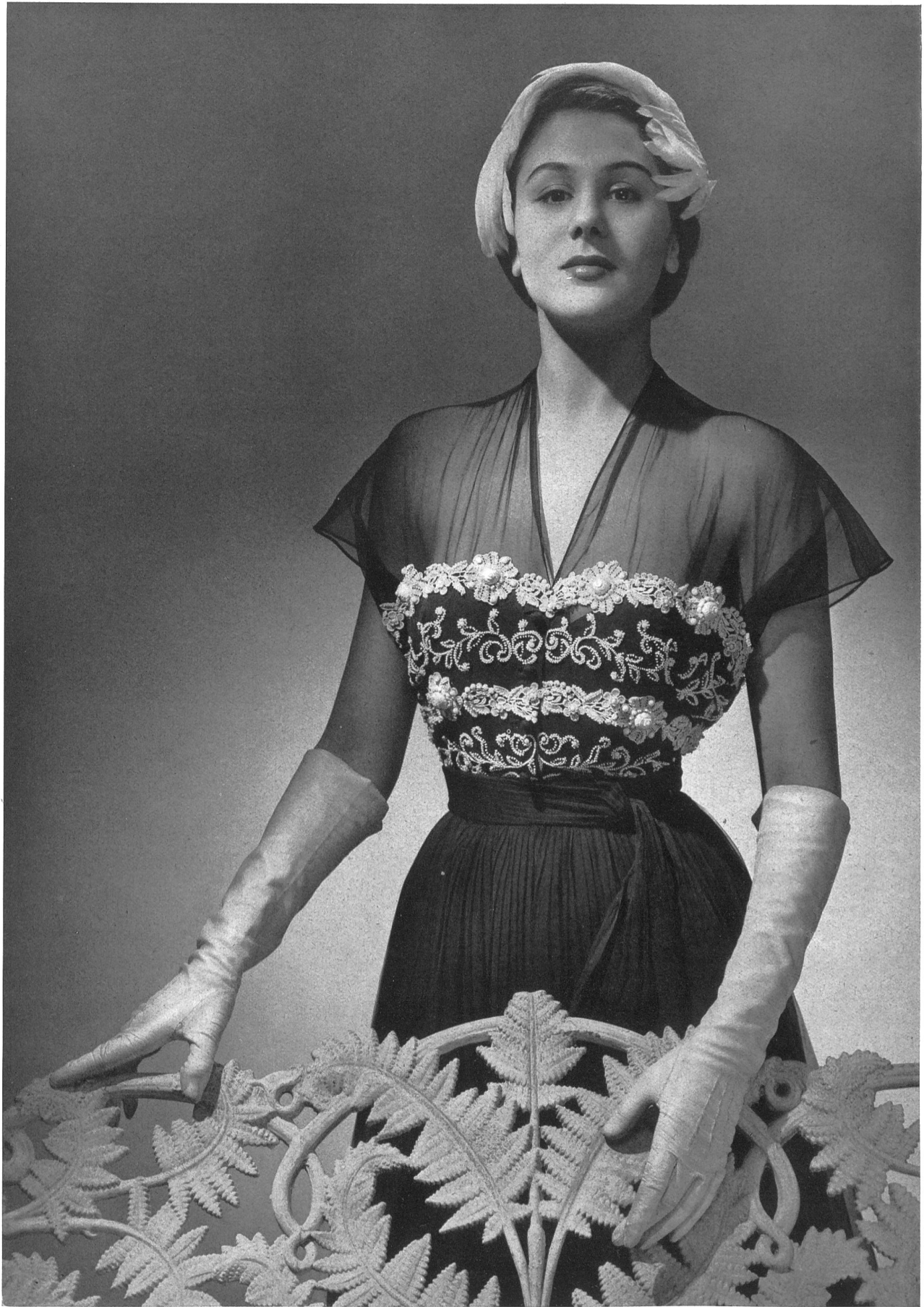
MARCEL ROCHAS Union S.A., St-Gall THIÉBAUT-ADAM, PARIS