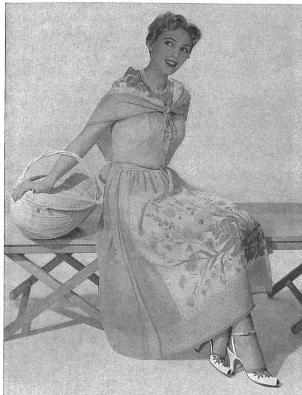
Traje de «L'Aiglon» en velo suizo inarrugable.

presentadas bajo la forma de modelos para verano de treinta y siete fabricantes americanos de vestidos confeccionados. Se trataba de demostrar que los tejidos finos de algodón tal y como se los fabrica en Suiza, convienen particularmente bien para las modas y los climas de América, para todas las ocasiones que se ofrecen en el