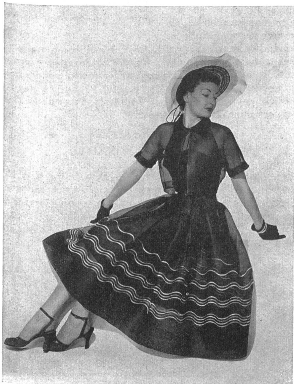
Traje de tarde de L. Aldrich en organdi azul marino.

Las telas finas de algodón que se fabrican en Suiza: batistas, velos, dotted Swiss, organdíes, etc., fueron