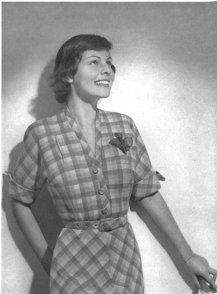
Oumansky & Co. Belfa, Genève

Esta relativa descentralización confiere a su vez a esta industria ciertas ventajas apreciables desde el punto de vista de la moda. Sabido es, en efecto, que el gusto varía notablemente en Suiza de una región a la otra, principalmente en cuanto a la vestimenta. Más cercana por su espíritu de Francia y de París mismo, con quienes